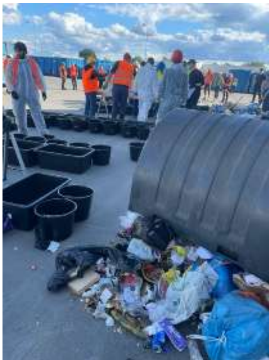
Ilustrační foto č. 4 – provádění rozboru smíšeného komunálního odpadu

Objemný odpad odevzdávají občané na sběrném dvoře, nebo pověřené odborné firmě do přistavených velkoobjemových kontejnerů, a také při mobilním sběru přímo do svozového vozidla podle instrukcí obsluhy. Při přebírání objemného odpadu zajišťuje přebírající obsluha oddělení recyklovatelných složek (minimálně kovů, plastů a dřeva velkých rozměrů). Odborná firma následně zajišťuje další úpravu objemného odpadu s cílem získat z něj využitelné složky, jako například dřevo, plast, kovy, sklo za účelem jejich recyklace, či jej využívá jako složku pro alternativní palivo, nevyužitelný zbytek je obvykle uložen na skládce nebo využit pro výrobu tuhého alternativního paliva, případně je spálen ve spalovně komunálních odpadů.