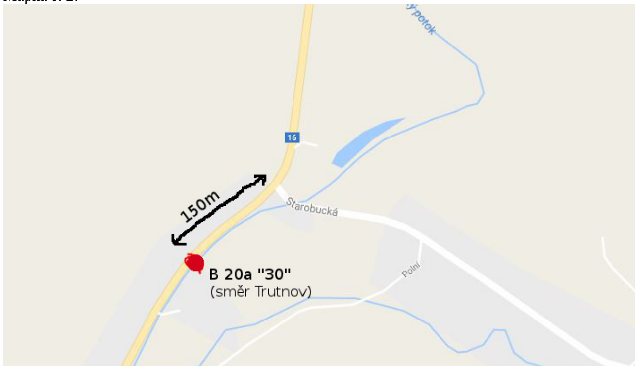
Mapka č. 2:

Značka B 20a „30“ cca 200 – 150m před křižovatkou I/16 a III/30018 ve směru na Trutnov.