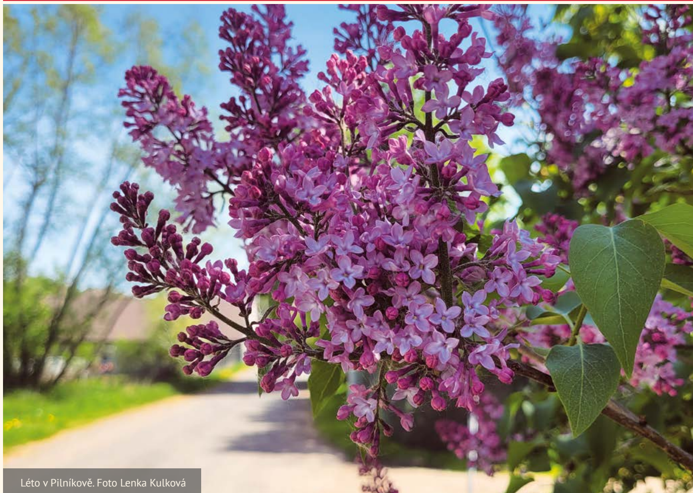
Léto v Pilníkově.

ČTVRTLETNÍK MĚSTA PILNÍKOVA / VYDÁNÍ 2. / ROČNÍK 20. / ČERVENEC 2022