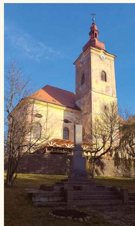
Pilníkovský kostel.

č. transparentního účtu: 123-6607140277/0100