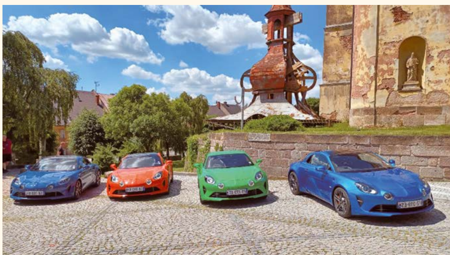
Reklamní kampaně kupé ALPINE A110.

Děkujeme předem za každý zasláný příspěvek i za to, že pomáháte s námi.