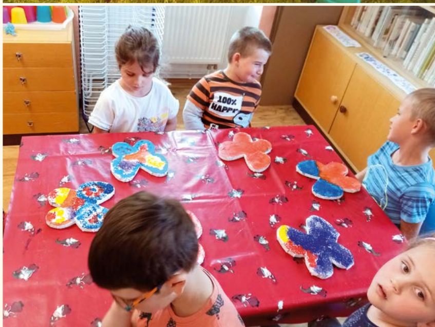
Projektový den MŠ.