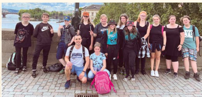
Výlet 7. třída.