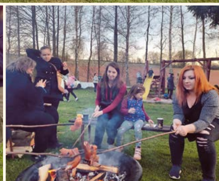
Čarodějnický rej.