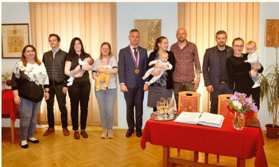
Vítání občánků.