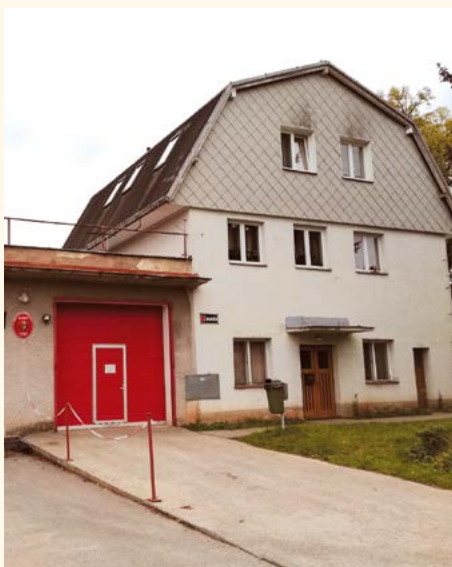
Požární zbrojnice a byty č. p. 151.

Druhý týden v červnu byly zahájeny opravy povrchu místních komunikací Nádražní, Za Tratí, Polní a od hřiště po Kolkovnu. Jedná se o lokální výpravu výtlučků, asfaltový nástřik tryskovou metodou a místní výměnu asfaltového koberce.