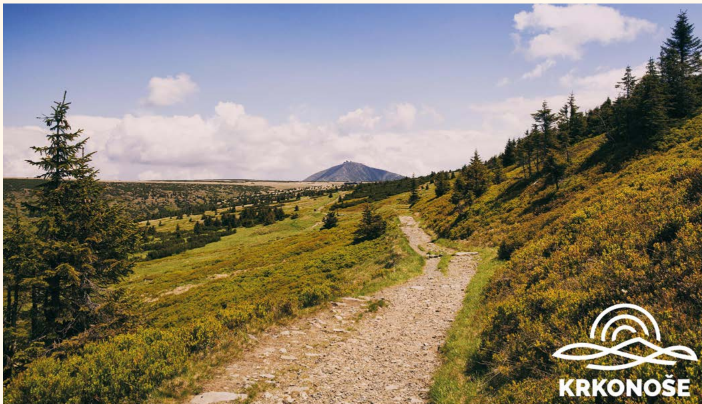
Stará Bucharova cesta.