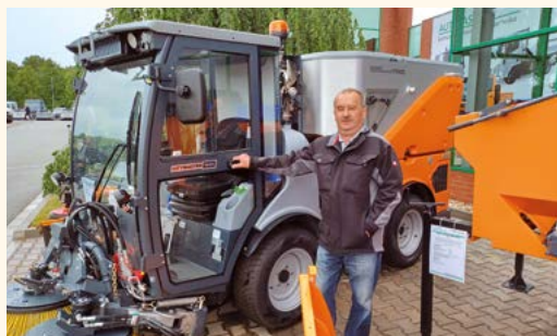
Výstava komunální techniky.

Po různých vyjednáváních a peripetiích jsme jej obdrželi až v únoru letošního roku. Největší vinu na tomto problému nese nedostatek a cena materiálu (tvrdí výrobci). K traktoru je přední tříbodový závěs, na který dodavatel traktoru čekal, až dorazí z Maďarska. S traktorem bychom měli