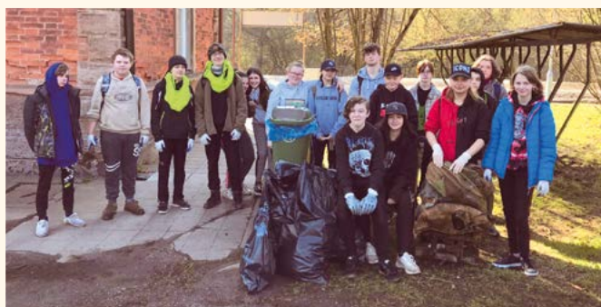
Uklidme Česko.

Poslední květnový pátek vystoupili s kulturním programem v domově pro seniory děti a žáci školy pod vedením svých učitelů. Naopak prvňáci zhlédli kouzelnické představení na akci „Podkrkonošská Sněžinka“, kterou každoročně pořádá MAS Jestřebí hory.