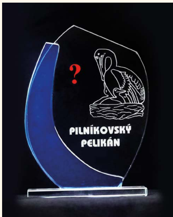
Cena Pilníkovský pelikán.

Věřím, že i letos se do nominace aktivně zapojíte a zašlete nám své návrhy i se zdůvodněním. Vyplněním ankety potvrzujete, že jste splnil/splnila podmínky ankety. Děkuji za vyplnění ankety. Můžete poslat i více než jednu nominaci.