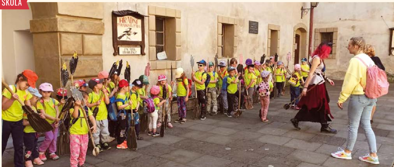
Školní výlet MŠ.