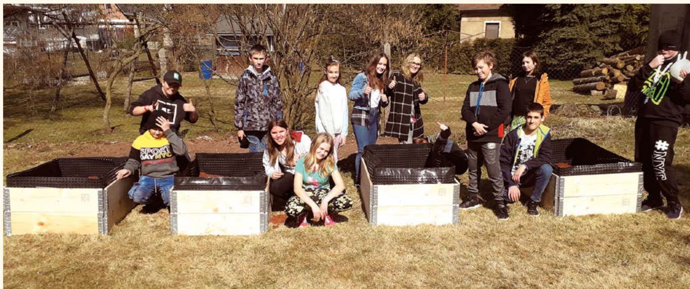
Realizace záhonů.