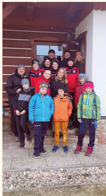
Soustředění mladších žáků.

Na závěr si dovoluji prosbu. Pokud by měl někdo chuť zapojit se do trénování našich nejmladších, ať se ozve. Budeme velmi rádi za pomoc.