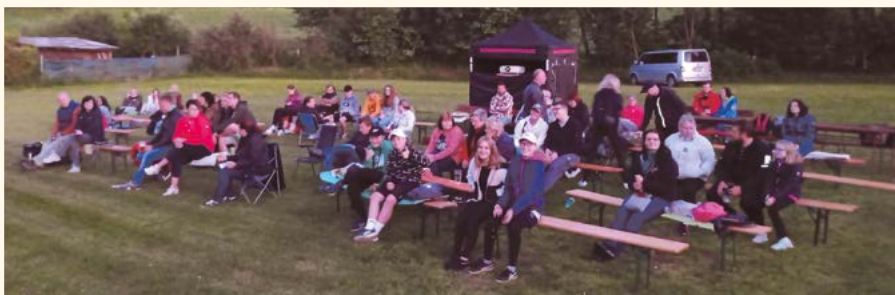
Letňák v Pilníkově.