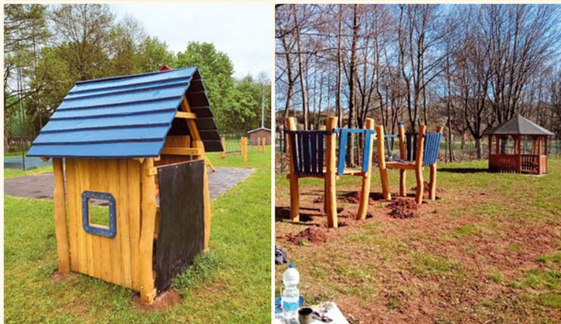
Nejhezčí zahrada.