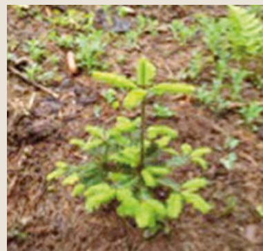
Sazenice jedle bělokoré z jarní výsadby.