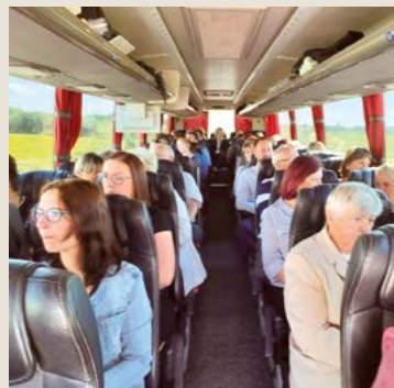
Zájezd na muzikál.