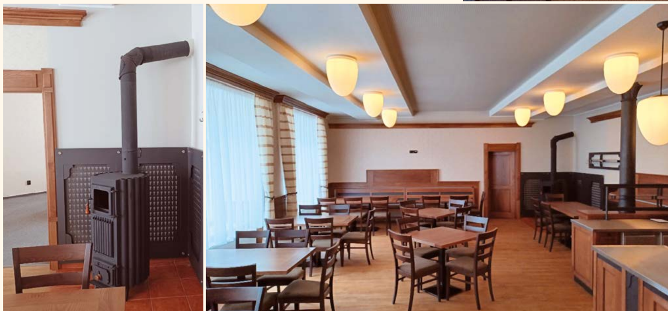
Dokončená rekonstrukce restaurace Slunce.