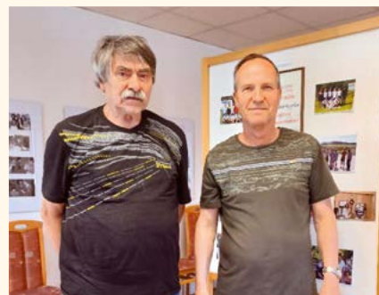
J. Haken a J. Mengler.

Od roku 1959 se stává slévárna Pilníkov provozem ZVÚ Hradec Králové, jehož hlavním výrobním programem byla výroba pivovarů, lihovarů, cukrovarů a chemických zařízení. Provoz v Pilníkově, ovlivněný tímto výrobním programem, začal odlévat nejen potřebné odlitky ze šedé litiny, ale vyráběl i finální výrobky jako čerpadla cukroviny, šroubové a odstředivé vyrovnávače tlaků, dávkovací čerpadla, rmutová čerpadla, šneková čerpadla mláta, ventily výhozu mláta, spádová síta, splachovače řepy, korečkové a pásové dopravníky a další výrobky pro dodávky ZVÚ HK.