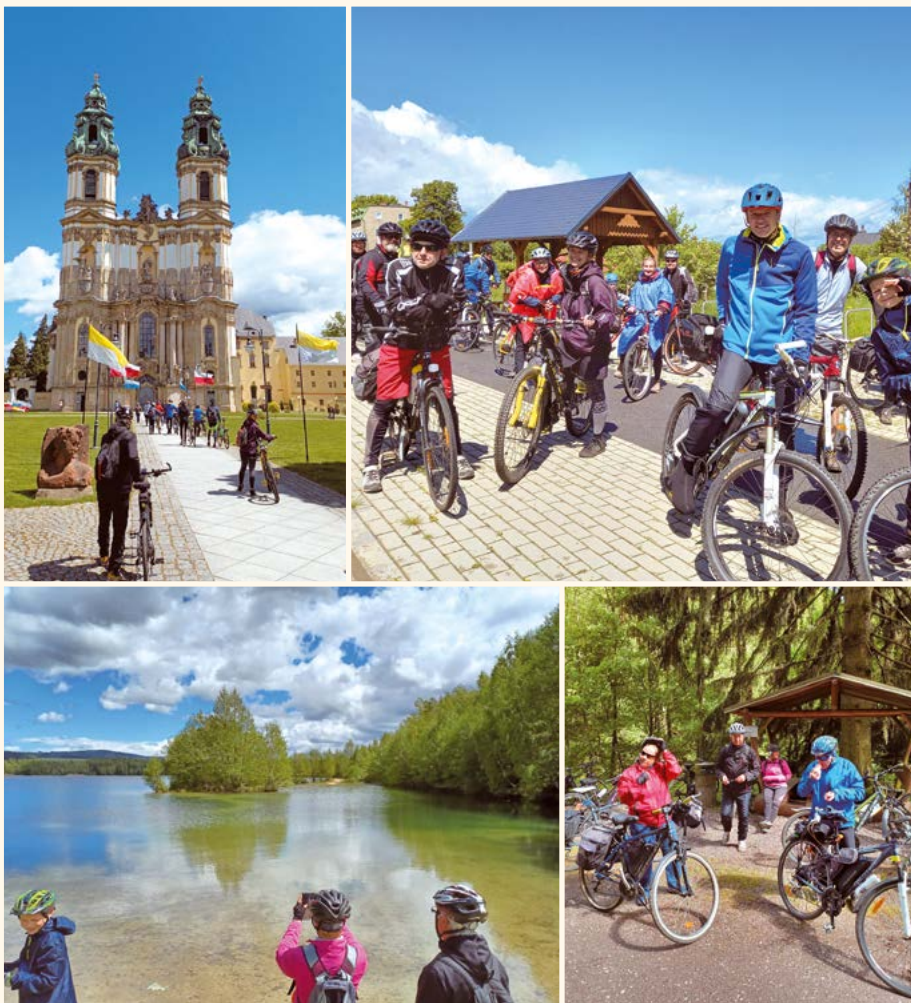
Cykloturistická sezóna začíná.