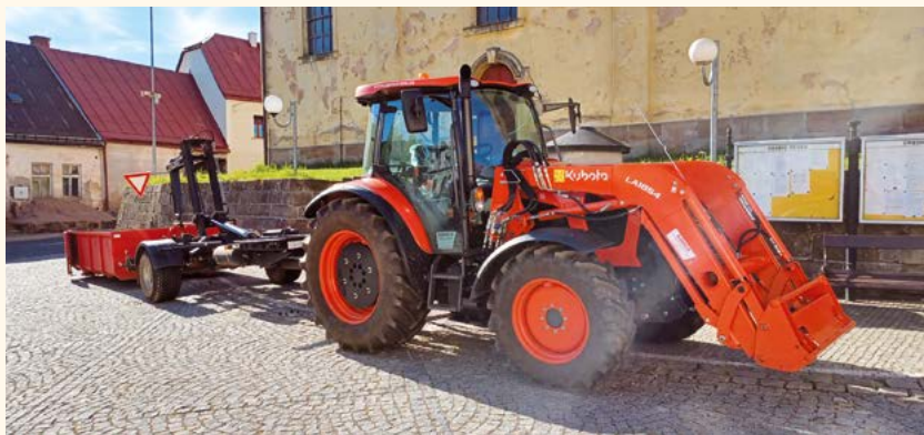
Nový traktor Kubota 5112.

Vážení spoluobčané, společnost Lesy-voda, s.r.o., pořídila pro komunální služby nový traktor zn. Kubota M 5112 s čelním nakladačem. Traktor byl objednán na podzim loňského roku u firmy Agrico Týniště nad Orlicí.