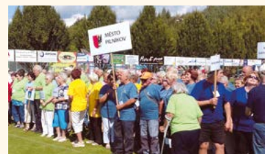
Havlovice 2020.