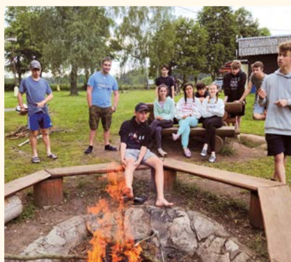
Výlet 9. třída. Fotoarchiv ZŠ