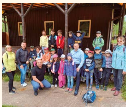
Podkrkonošská sněžinka.

Zástupci místního SDH besedovali s žáky 1. až 6. třídy o chování v mimořádných situacích, čímž si žáci upevnili a rozšířili znalosti a dovednosti. Ty mohou uplatnit během projektového dne, který proběhne koncem školního roku.