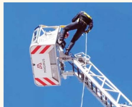
Akce ve výškách.

Podíleli jsme se na masopustu 12. 02. 2022 zajištěním nápojového občerstvení. 30. 4. 2022 jsme postavili vatru pro pálení čarodějnic. 14. 5. 2022 jsme se účastnili na