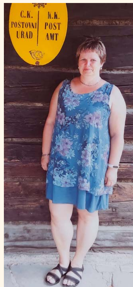
Ve skanzenu v Rožnově pod Radhoštěm.