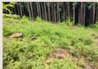
Šetrné vytěžení mýtního porostu z náletu.