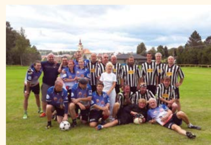
Zápas Meziboří-Pilníkov, 2017.