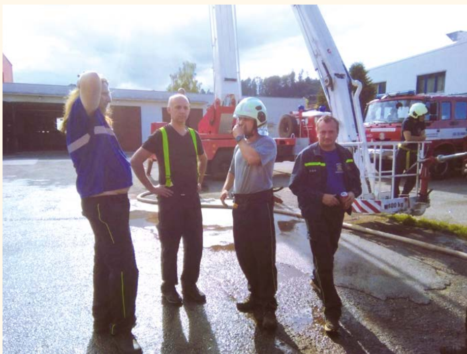
Hasiči Pilníkov.