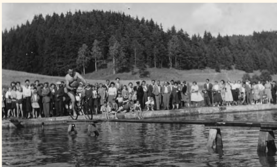
Soutěž na koupališti.