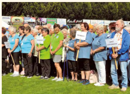
Nástup sportovců na zahájení.