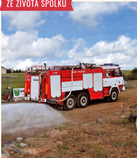
Hasiči kropili trať.