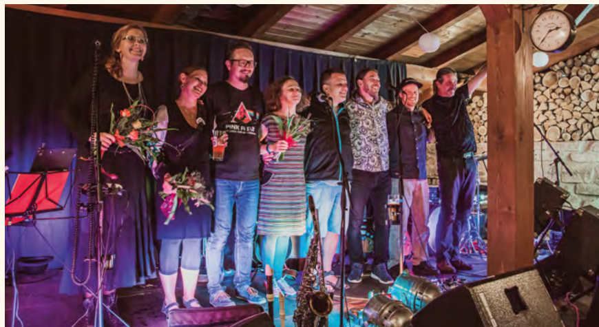
Tlupa tlap .

11. září je datum, které si obyčejně spojujeme spíše se smutnými událostmi v New Yorku. Letošní rok kapela Tlupa tlap toto datum použila k oslavě 25. výročí hudební činnosti skupiny Kaluží a poté Tlupy .