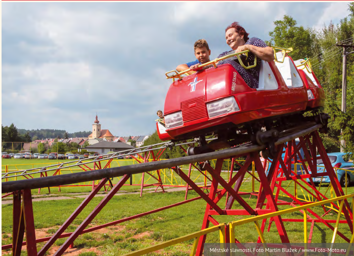
Městské slavnosti.

ČTVRTLETNÍK MĚSTA PILNÍKOVA / VYDÁNÍ 3. / ROČNÍK 19. / ŘÍJEN 2021