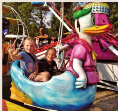
Na městských slavnostech.