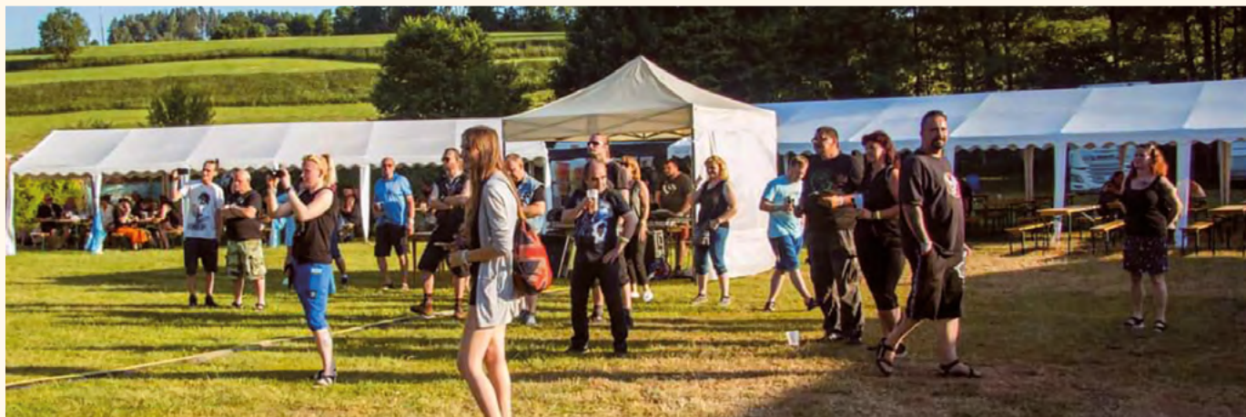
Nadějefest 18. – 19. 6. 2021.