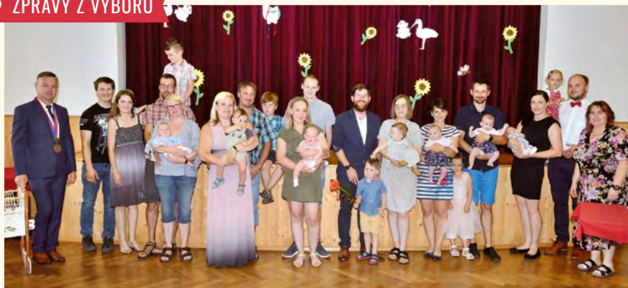
Společná fotografie.