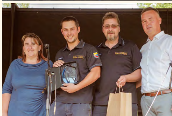
Předání pilníkovského Pelikána hasičům.