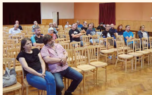
Studie revitalizace náměstí.