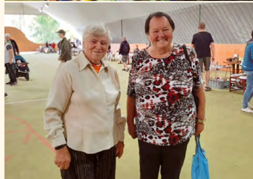
Blešák 11. 9. 2021.