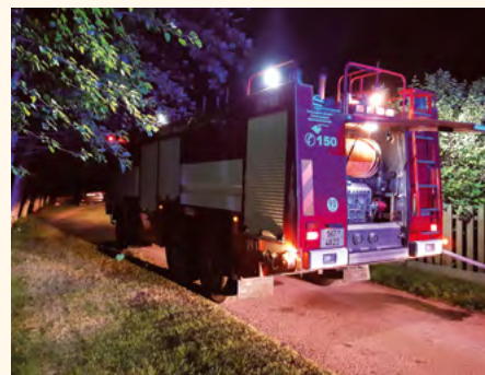
Noční zásah.

dovolte mi malé ohlédnutí za činností hasičů během letních měsíců. Ke dni 10.9.2021 evidujeme celkem 41 výjezdů různého charakteru. Zmíním ty zajímavější. Dne 14.7.2021 se prohnala okolím Nemojova větrná smršť a naše jednotka pomáhala s odstraňováním popadaných stromů ze silnic i budov.