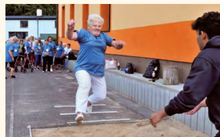
Do olympiády dali všichni vše.

Během Olympiády pro starší a dříve narozené probíhalo v dějišti akce i pozorování Slunce s úpickými hvězdáři. Zájemci se také mohli projet na elektrokolech, která byla k zapůjčení ve stanu společnosti Barta.bike. Probíhal zde také bezplatný servis jízdních kol. V krásném areálu na břehu Úpy nechyběla ani minixpozice