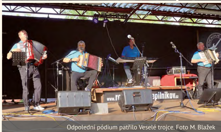
Odpolední pódium patřilo Veselé trojce.