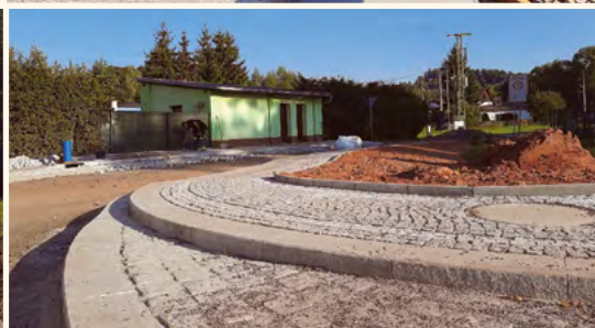
Rekonstrukce města.