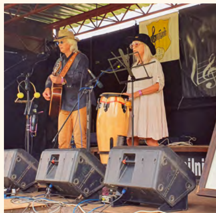
Pilníkovský písničkář.

Letošní ročník byl sice ve znamení pošmorného počasí a menší účasti návštěvníků, nicméně ani jeden z těchto faktorů neochudil publikum o skvělý hudební zážitek.