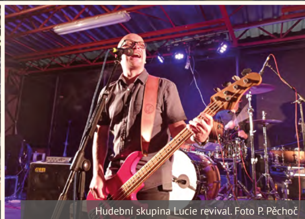
Hudební skupina Lucie revival.