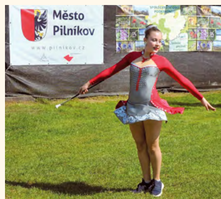
Mažoretky Nessie Trutnov zahájily program.

Krátce po ohňostroji se kapela Lucie revival vrátila a zahrála pár písniček. Slavnosti zakončila skupina Jam&Bazar, která bavila návštěvníky až do půlnoci.