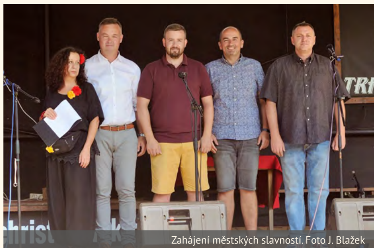
Zahájení městských slavností.