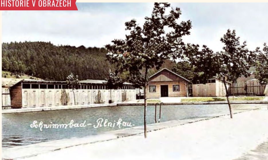
Pilníkovská plavárna.