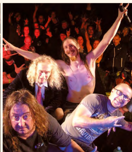
Rockové hřiště.