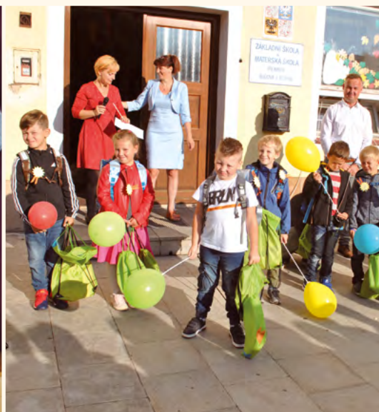
Přivítání prvňáčků a vedení školy.