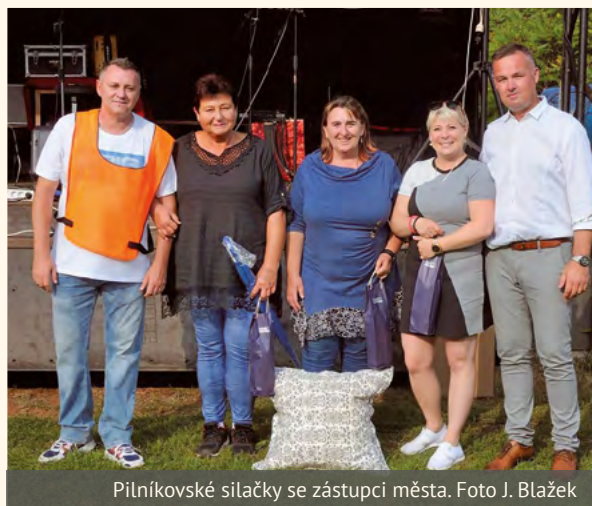
Pilníkovské silačky se zástupci města.