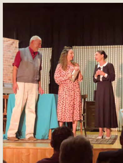
Divadlo Liga proti nevěře.