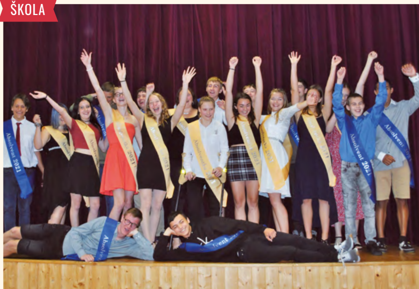
Devítka se loučí.