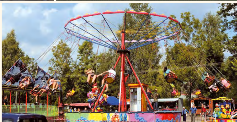
Na pořádných slavnostech nemůže chybět velký řetězák.