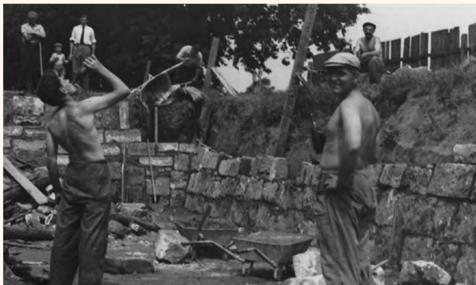
Výstavba koupaliště.