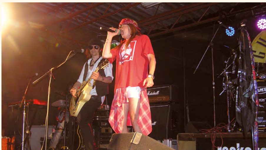
Rockové hřiště.

Za sedmero horami a sedmero řekami se před sedmi lety zrodila myšlenka, jak přinést dobrou muziku do vcelku poklidného městečka Pilníkov. Rok od roku se tento nápad vyvíjel a rozrůstal i díky podpoře našich věrných fanoušků, až jsme i přes rozkol nuceného kulturního temna posledního roku a půl mohli úspěšně uzavřít další sezónu.