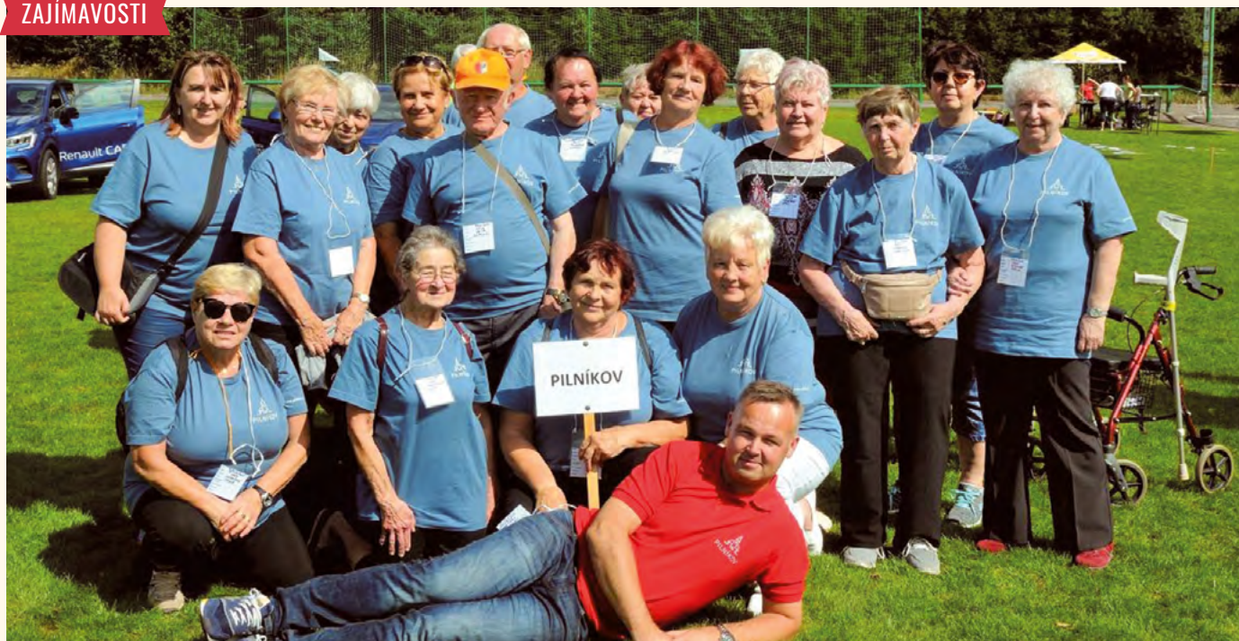
Pilníkovský olympijský tým s kapitánem.