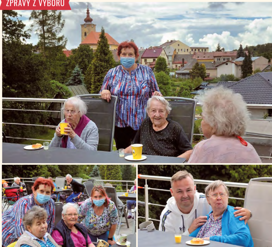
Setkání se seniory.