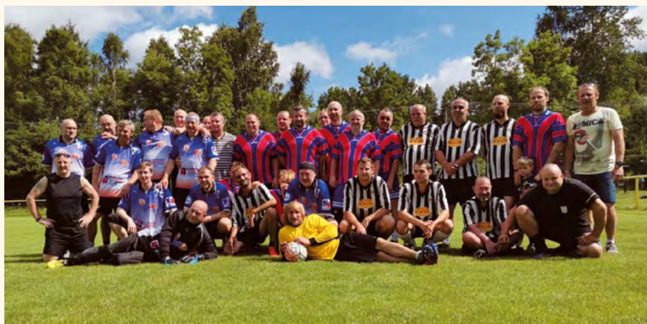
Fotbalisté Spartaku.