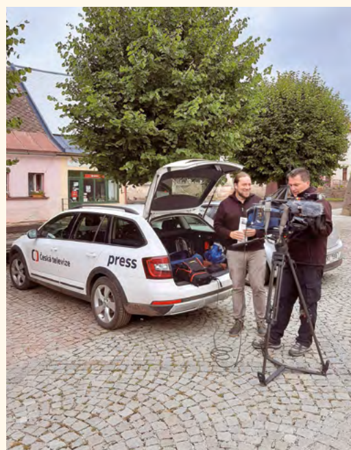
Natáčení České televize 24. 8. 2021.