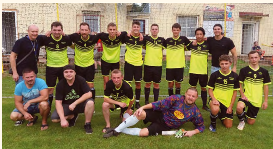
Fotbalové mužstvo Spartak.

O týden později se konal v hale tenisový turnaj.