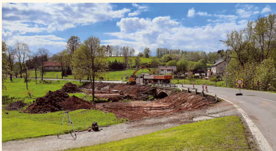
Oprava mostu v ulici Pražská.

mezi Libereckým a Královéhradeckým krajem se předání staveniště uskutečnilo až dne 10. května a stavba byla zahájena 17. května úsekem křižovatky na Staré Buky. Jednoměsíční skluz chce zhotovitel dohnat nasazením nové technologie pokládání asfaltového koberce, aby se akce dokončila do 14. listopadu letošního roku.