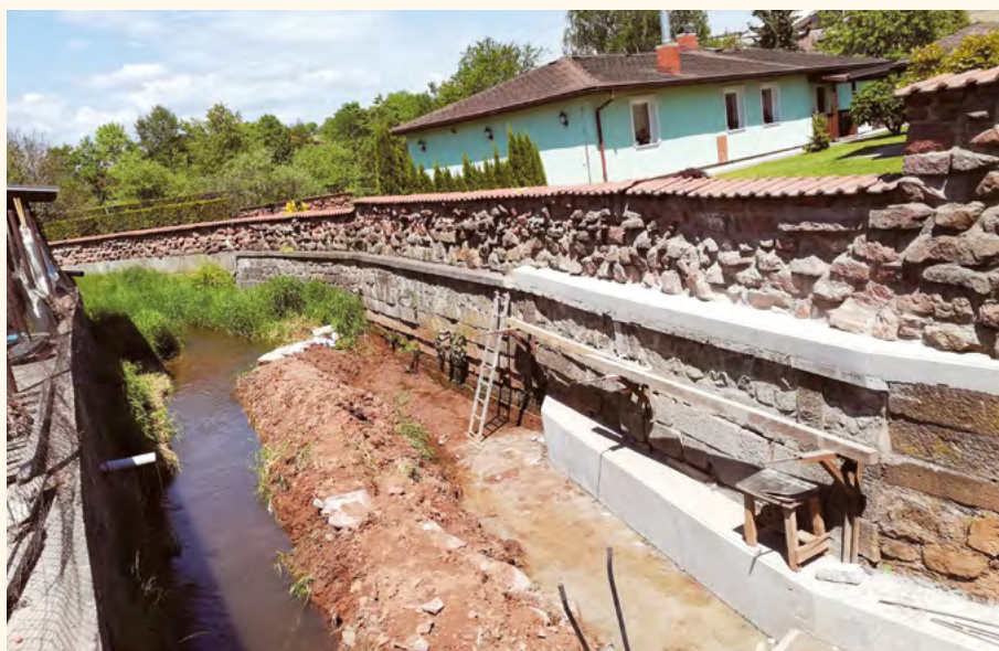
Oprava mostu u sportovní haly.