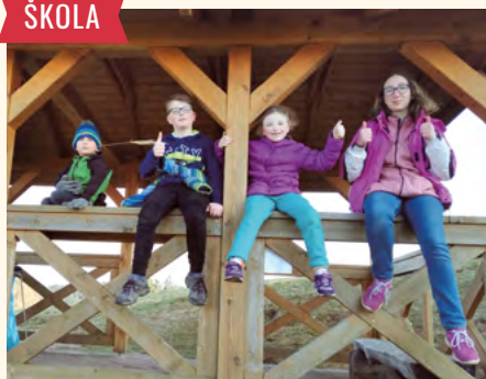
Děti objevují stanoviště naučné stezky.