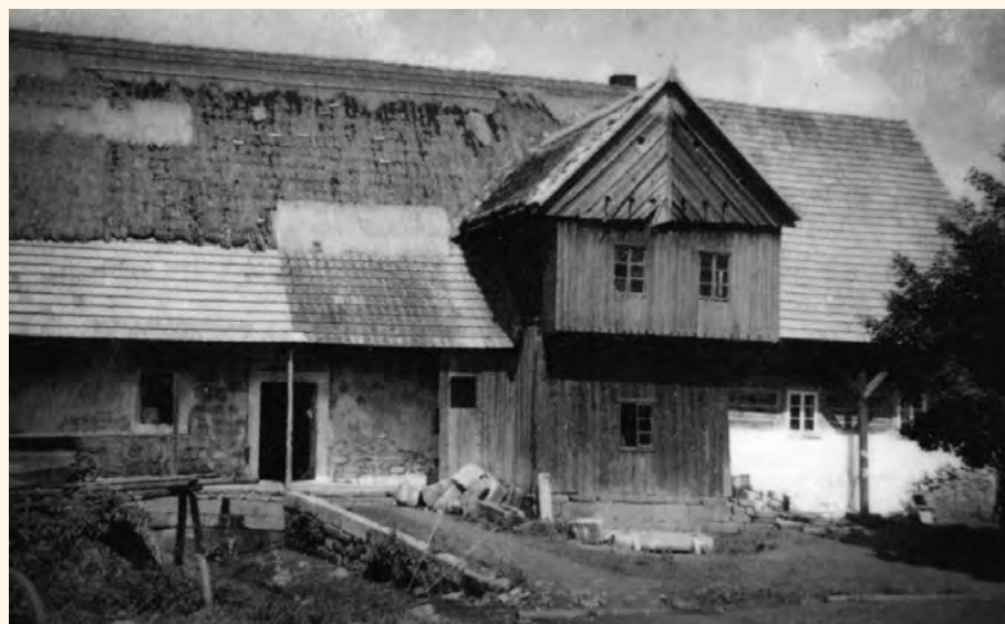
Historické foto statku, 1947.

Obecně máme v rodině hezké a úzké vztahy. Taťku s bráchou Kájou možná znáte, vedou každý část hospodářství.