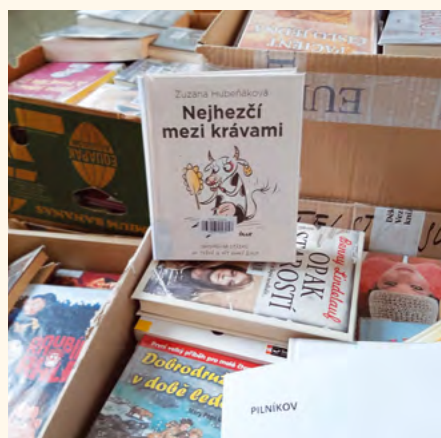
Nové knihy čekají na své čtenáře.

Alena Pacholíkova oblastní destinační společnost Krkonoše – svazek měst a obcí