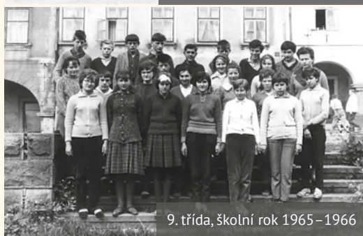
9. třída, školní rok 1965–1966