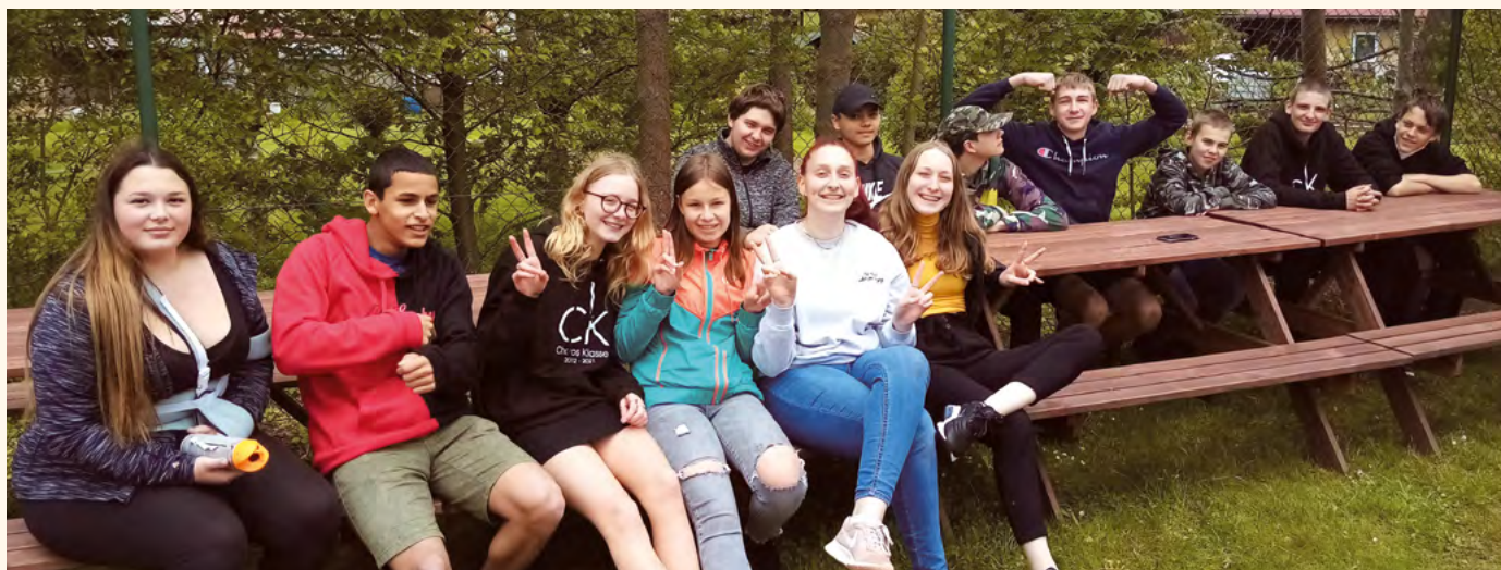
Devátáci sestavují venkovní sety.