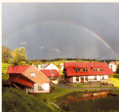
Květnová duha.