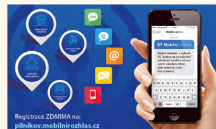
Mobilní rozhlas – jednoduchá registrace

Místní rozhlas je neoddělitelně spjatý s každou vesničkou, městysem či menším městem. Ampliony zavěšené na sloupech nebo lampách veřejného osvětlení jsou evergreenem, který zřejmě nikdy nevymizí. Dodnes je zaběhnutým prostředkem v přenosu informací z radnice k občanům. Nicméně někdy se stane, že pravidelné vysílání nestihnete, nebo dokonce přeslechnete. Informace můžete získat i zpětně díky projektu Mobilní rozhlas. Stačí se zaregistrovat na webových stránkách www.mobilnirozhlas.cz , ideálně i stáhnout mobilní aplikaci a neuteče vám žádná důležitá informace.