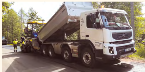
Oprava komunikace I/16.

Objízdná trasa pro nákladní dopravu je přes Vrchlábí a Studenec a objízdná trasa pro osobní dopravu je přes Hostinné a Rudník. Z důvodu zpoždění vyřízení objízdné trasy pro nákladní dopravu