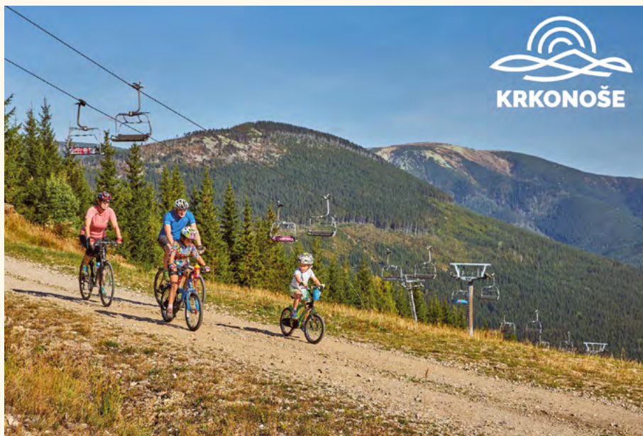
Co zažít v Krkonoších na kole

Pro každého, kdo na kole touží po adrenalinu a zároveň trochu technické jízdy, jsou vytvořeny bike parky. Ať už jste začátečník, nebo zkušený jezdec, určitě si vyberete některou z tras ve Špindlerově Mlýně, Trutnově nebo Rokytnici nad Jizerou. Také děti mohou rozpumpovat kola, otestovat svoji rovnováhu a schopnosti bikerů na pump tracku. Jízdu pohybem nahoru a dolů silou vlastního těla a občas správně klopat zatáčku vyzkouší v Rudníku, Hostinném, Mladých Bukách, Harrachově nebo ve Vrchlabí a Špindlerově Mlýně. Originální sportovní přírodní trasou pro děti je Singltrekk na Benecku. Malý okruh v lese zvládne na horském kole i začátečník. Další přírodní terénní stezky pro horská kola nabízí zkušenějším jezdčům singl trailu v lokalitě Čížkových kamenů u Trutnova. Proměnlivá