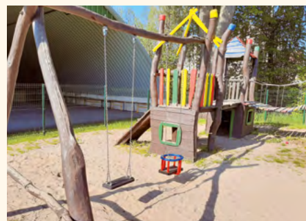
Nové houpačky na hřišti.

Už jste si také všimli? Na dětském hřišti máme dvě nové dětské houpačky a také nový návštěvní řád, který byl bohužel nějakým neznámým vandalem zničen. Příběh těch starých houpaček je bohužel smutný. Ptáte se, co se stalo? Dětské hřiště navštívila parta odrostlých mladíků, kteří nepochopili, že některé herní prvky jsou určeny především malým dětem, a také, že se po konstrukcích prolézaček neleze jako opice po stromě včetně střechy věže.