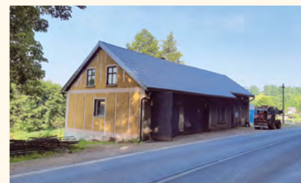
Opravená střecha bývalé váhy.

Během letních měsíců počítáme s vydáním územního rozhodnutí na výstavbu 9 rodinných domů nad fotbalovým hřištěm a stavebního povolení nového bytového domu v místě bývalé školní jídelny. Do konce června budeme vědět, zda se zvýší alokace krajských finančních prostředků a tím možnost získání dotace na výměnu krovu nad restaurací Slunce. V červenci končí zkušební provoz čistírny odpadních vod a v srpnu proběhne kolaudace. V září budeme opakovaně žádat o dotace na rekonstrukci požární zbroj-