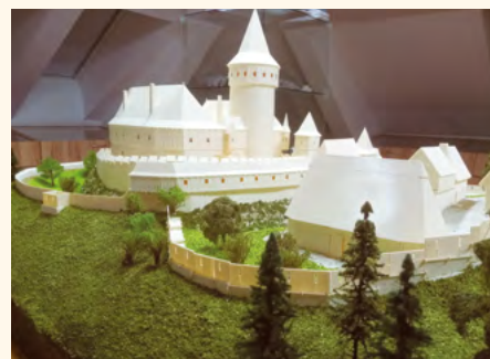
3D model hradu Vizmburk

Při obnově památek v Královéhradeckém kraji hrají důležitou roli místní akční skupiny (MAS). Díky společnostem zaměřeným na rozvoj venkova se podařilo v regionu podpořit péči o památkové objekty bezmála 32 miliony korun. Tyto dotační peníze od roku 2008 umožnily realizaci desítek projektů, mezi nimiž jsou například opravy hradů, zámků nebo kostelů. A kdyby je někdo šikovně zaznamenal, zůstaly by tu k nahlédnutí i v dalších letech dalším Pilníkovánům.