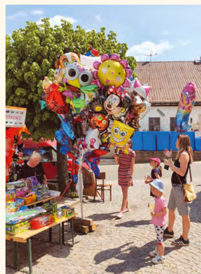
Pouťová lákadla.