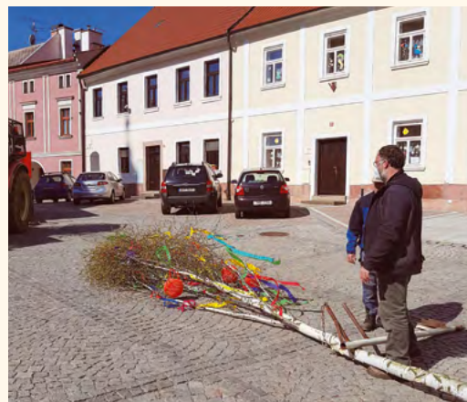
Příprava májky.