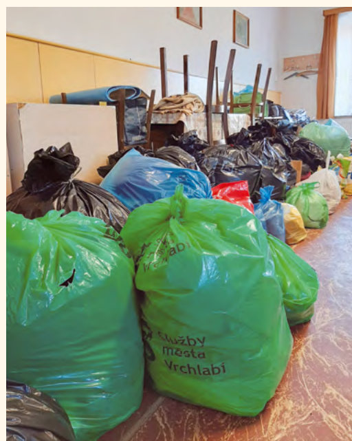
Sbírka pro diakonii.

Pokud bych měl vypíchnout dění na radnici, které uvnitř čísla bude více popisovat náš referent investic, se zdárným dokončením výstavby kanalizace byla v polovině května zahájena masivní rekonstrukce páteřní komunikace I/16 a s tím přílehlých propustků a mostů. Vše je spojeno s objízdnými trasami a komplikacemi v dopravě. Obrňte se prosím trpělivostí, slibuji, že až bude hotovo, bude město krásnější a především bezpečnější. Zápisy a usnesení z jednání zastupitelstva si poté může přečíst na webových stránkách města.