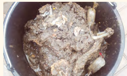
Nekázeň občanů.

Na závěr bych vám všem, kteří jste napojeni na kanalizaci nebo se brzké době