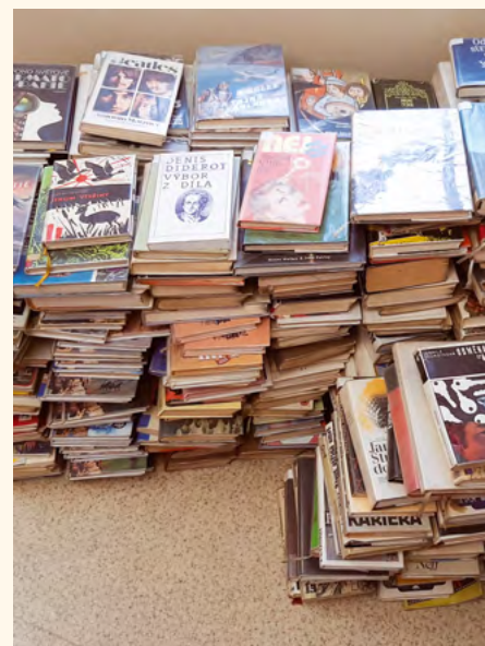
Vyřazené knihy.