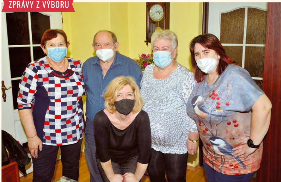
Setkání s oslavenci.