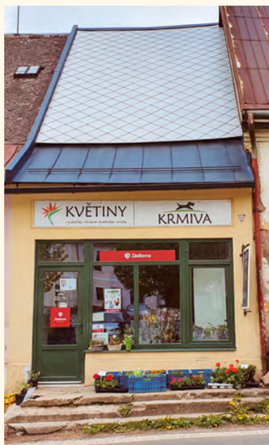
Zásilkovna Květiny.