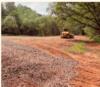
Úklid u šterku.

V letošním roce máme garantovanou cenu 500,-/t za odvoz komunálního odpadu do 200 kg na osobu. V případě, že se tato hranice překročí, poté každá další odvezená tuna směsného a objemového odpadu vyjde město v nákladech o 300,- více. Proto je potřeba, aby se každý z nás snažil co nejvíce odpad třídit. Nejenže se vytríděný odpad nepočítá do vyprodukovaného odpadu na osobu/rok, ale zpět do města přivádí peněžní prostředky ve formě bonusů za množství vytríděného odpadu (sklo, papír, plast, nápojový karton, drobný kovový odpad). V letošním roce nám za první tři