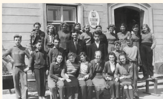
8. třída, školní rok 1957–1958