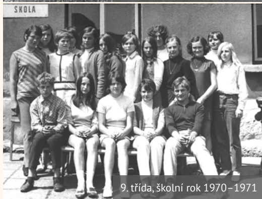
9. třída, školní rok 1970–1971