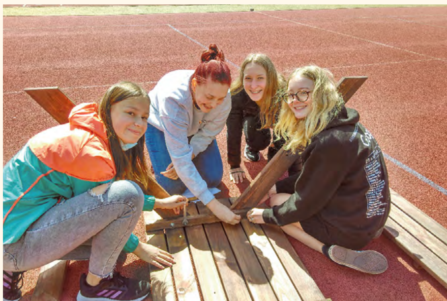
Devátáci sestavují venkovní sety II.