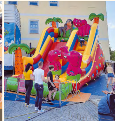
Fotogalerie: Dětský den / Pilníkovská pouť / Soutěž o nejlepší pouťový koláč