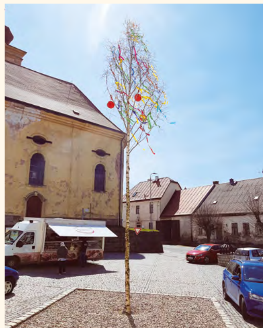
Letošní májka.