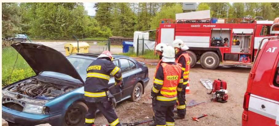
Záběry ze cvičení dobrovolných hasičů Pilníkov.

přiblížím opět činnost hasičů v Pilníkově od posledního vydání Zpravodaje. Ke dni 7.6.2021 evidujeme celkem 22 výjezdů k různým typům událostí. Stručně shrnu zajímavější události.