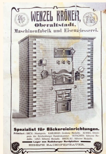
Nabídka pekařské pece, prospekt jsme našli na půdě