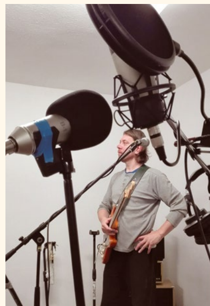
První zkouška v Obývaku – kapelník.

dením Petra Pyciaka (Hostinné). Přijďte se odreagovat a zrelaxovat si. Zvuk tohoto nástroje vede přímo ke hvězdám. Budete si také moci odzkoušet tradiční i méně tradiční rytmické hudební nástroje.