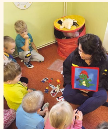
Tichá knížka v praxi.

Děti mají vlastní přirozenou zvědavost a toto je další způsob, jak se mohou rozvíjet, něco nového se naučit. My dospělí bychom si měli uvědomit, že v dětech je naše budoucnost a měli bychom se snažit z nich vychovat správně a slušné lidi se zdravým selským rozumem, který je často daleko cennější než hodiny strávené u počítače nebo s mobilem v ruce.