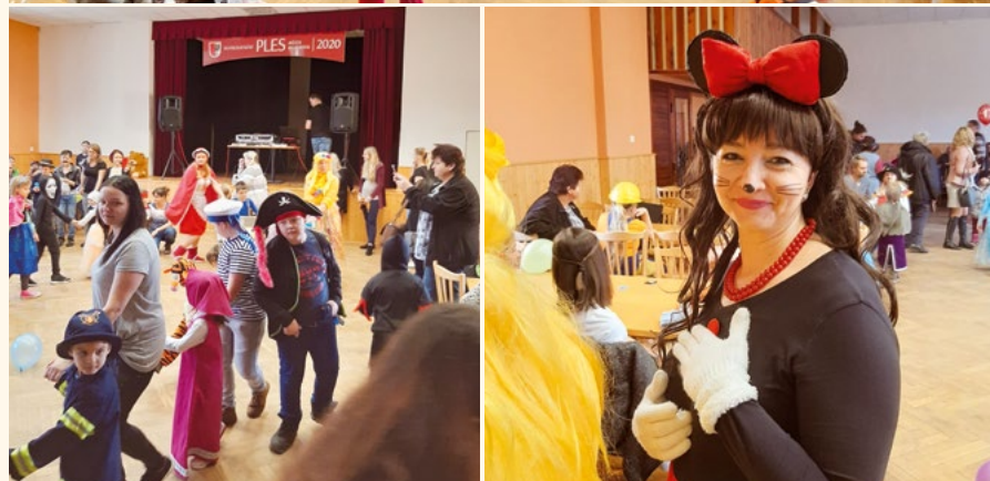
Tradiční dětský karneval završil plesovou sezónu.