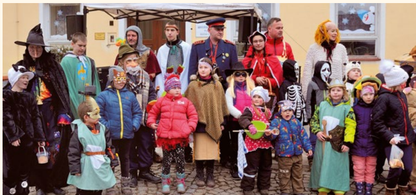
Převleky a masky na náměstí – masopust 2020.

Tradiční masopustní veselí v Pilníkově bylo v roce 2020 poznamenáno stavebními pracemi na městské kanalizaci. Program se v rámci masopustní tradice odehrával z důvodů bezpečnosti pouze na pilníkovském náměstí. Doprovázelo ho pro začátek února netypicky teplé, dosti deštivé a větrné počasí.