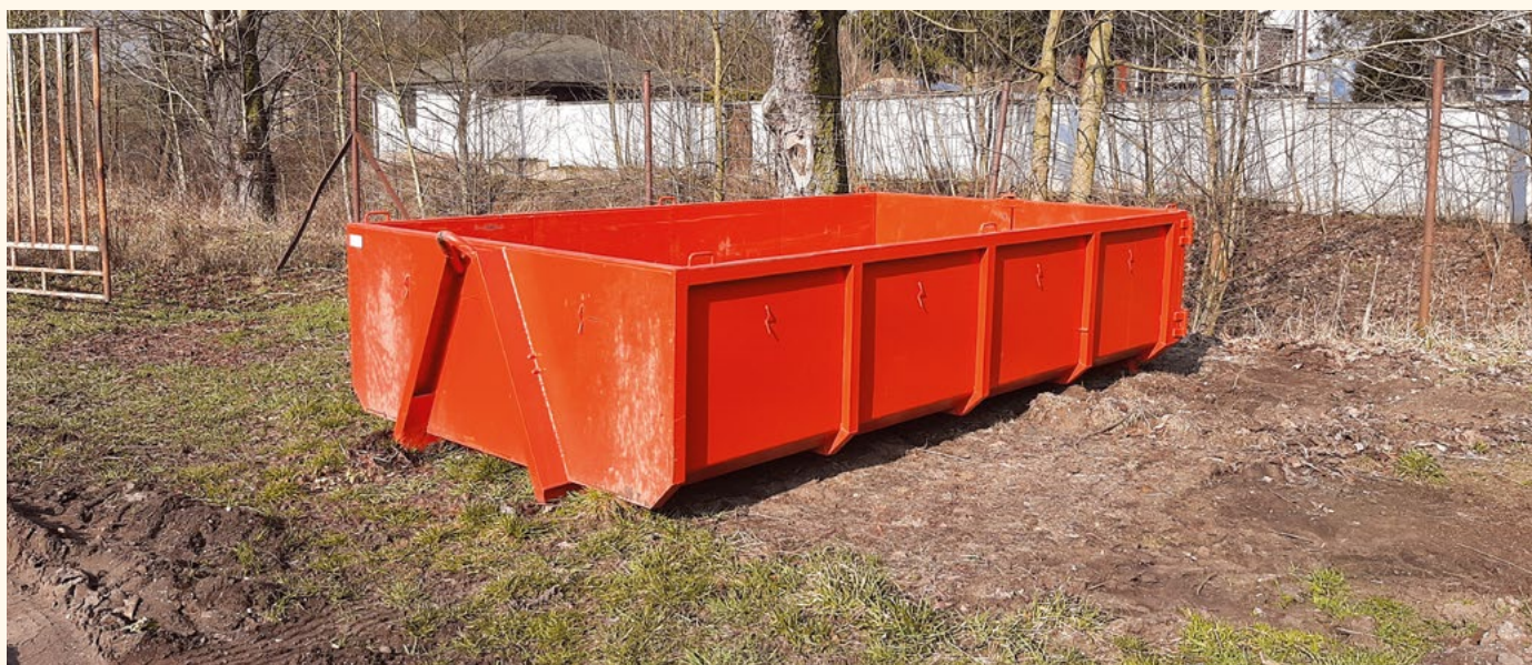
Kontejner na BIO odpad ze zahrad stojí u továrny.