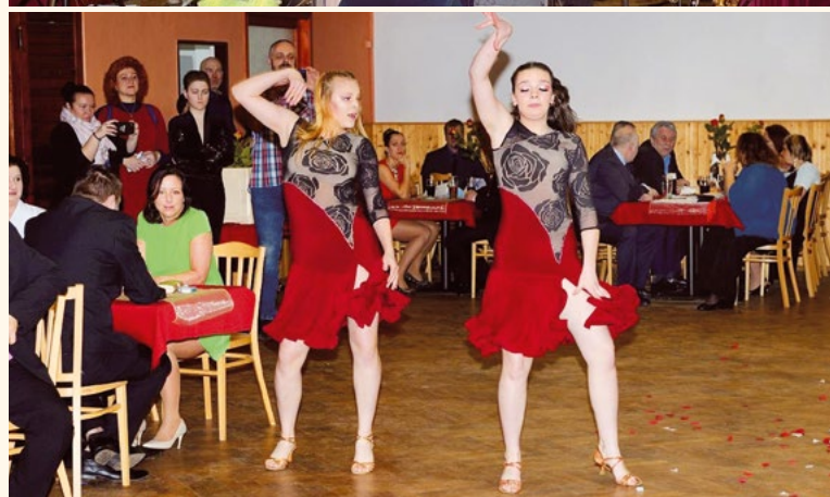
Zahájení plesu a tanečnice.