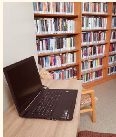
Internet v knihovně.