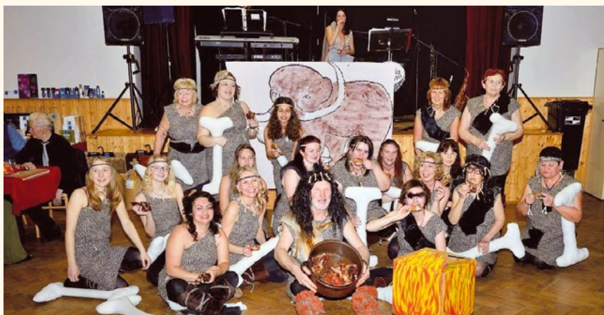
Schovanky s farářem opět vystoupily na městském plesu.

V páteční večer 6. března 2020 se na sále restaurace Slunce uskutečnil další ročník obecního reprezentačního plesu. Sál byl zaplněn do posledního místečka. Na některé zájemce se dokonce ani nedostalo! Vstupenky totiž byly vyprodány již dlouho před konáním plesu.