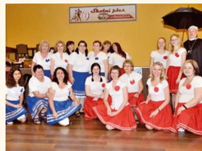
Schovanky zatančily také v Chotěvicích.