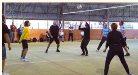
Přátelské utkání s Batňovicemi – podzim 2019.