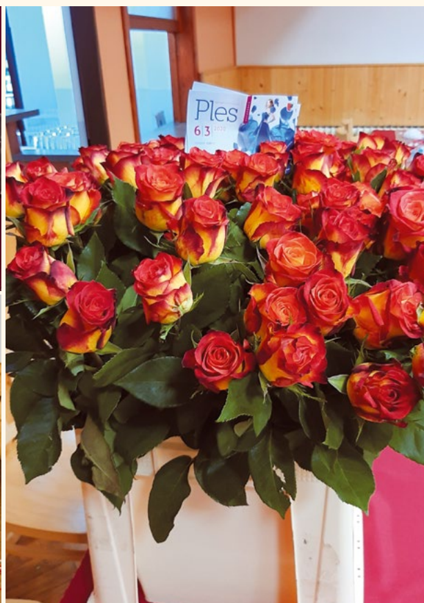
Růže pro dámy.