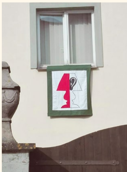
Vstupte do Obývaku. První akcí bude poslechový večer.

21 schodů k didgeridoo – povídání a ukázky hry na tento dechový hudební nástroj australských domorodců pod ve-