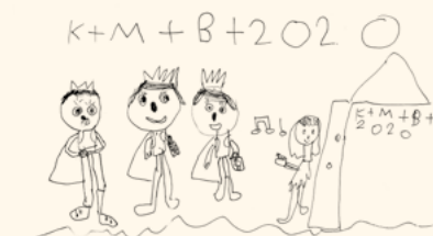
Tři králové 2020 od Jůlinky Dostálové.