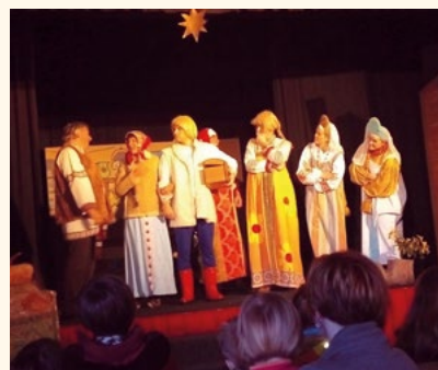
Tříkráloví koledníci za odměnu navštívili představení Mrazík – Divadlo bez zábran.