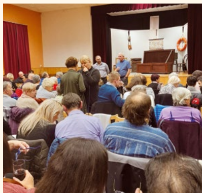
Diváci, kteří navštívili komedii Ani za milion.

Předprodej vstupenek je zahájen na městském úřadu u paní Čubičové.