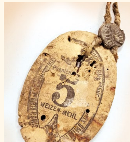
Značka – pečeť dodavatele z 5 kg pšeničné mouky