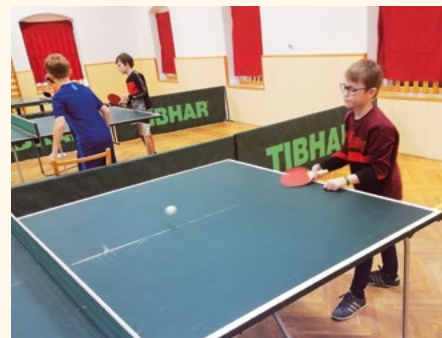
Turnaj ve stolním tenise 2019.

někoho překvapení, ale kdo viděl, musí uznat, že právem. Prošla totiž celým turnajem se ztrátou jediného setu a o vítězi (vítězce) bylo rozhodnuto. Tím, kdo ten