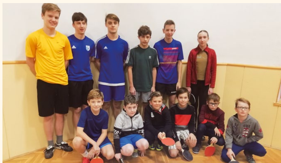
Mladá pingpongová krev na 31. vánočním turnaji.