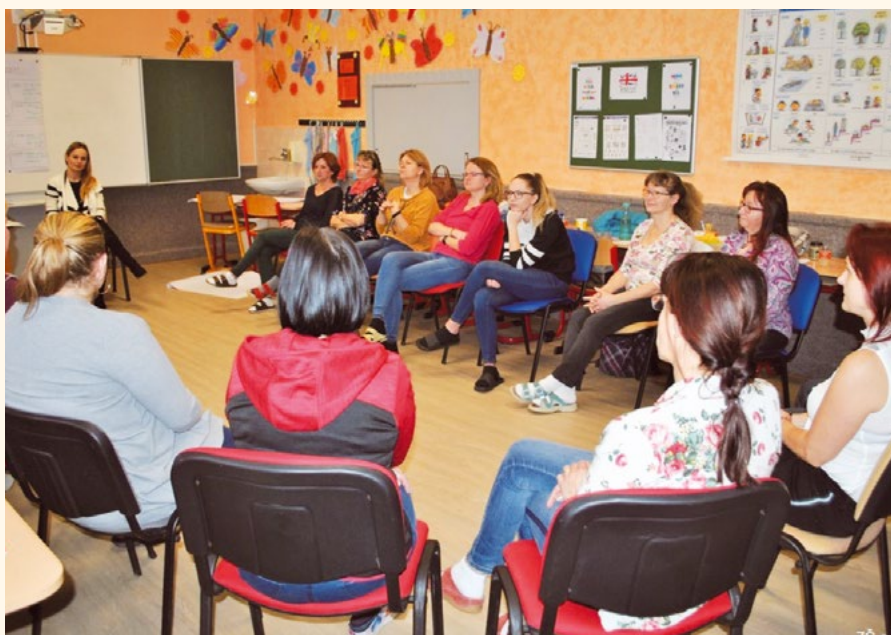
Školení učitelů v pilníkovské škole.