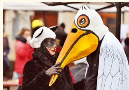
Při masopustu na náměstí nechyběl ani pelikán.