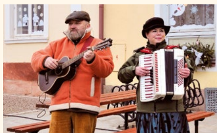
Duo Nešlapeto doprovázelo masopustní veselí v Pilníkově na náměstí.

1. 2. 2020 se skupiny organizátorů kolem radnice hemžily už v dopoledních hodinách. Chystalo se zázemí pro masopustní hosty. Stany, plynové ohříváče, brutar na ovar byly nachystány na radnici s několika denním předstihem. To vše proto, aby si všichni mohli dosyta užít hlavně tradiční zabijačkové občerstvení v podobě jitrnic, tlačanky, ovaru, ale také koláčů a nechyběl ani stánek s oblíbenými trdelníky a cukrovou vatou. Oproti loňským ročníkům museli prodejci masopustního občerstvení přistoupit k drobným opatřením. Stávalo se totiž, že milovníci za-