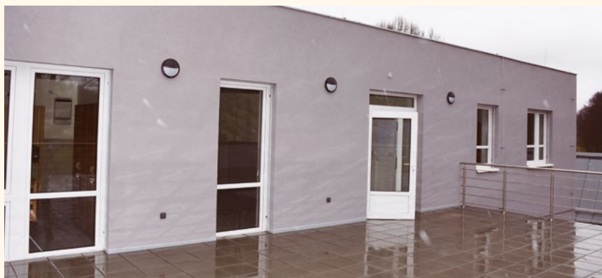
Přístavba Domova pro seniory v Pilníkově.

Královéhradecký kraj otevřel přístavbu Domova pro seniory v Pilníkově za více jak 15 milionů korun. Kraj tím rozšířil ubytovací kapacity o osm nových sociálních lůžek. Stavební práce trvaly jeden rok. V plánu je další výstavba za přibližně 135 milionů korun.