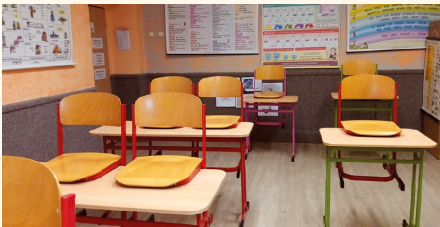
Třídy v novém i na druhém stupni.

Tak tohle si určitě říkají od února žáci páté a šesté třídy. Po celkové rekonstrukci všech učeben na prvním stupni naší školy jsme se nebojálně pustili do zvelebování tříd na stupni druhém.