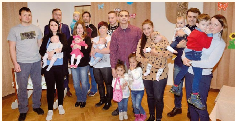
Vítání občánků.