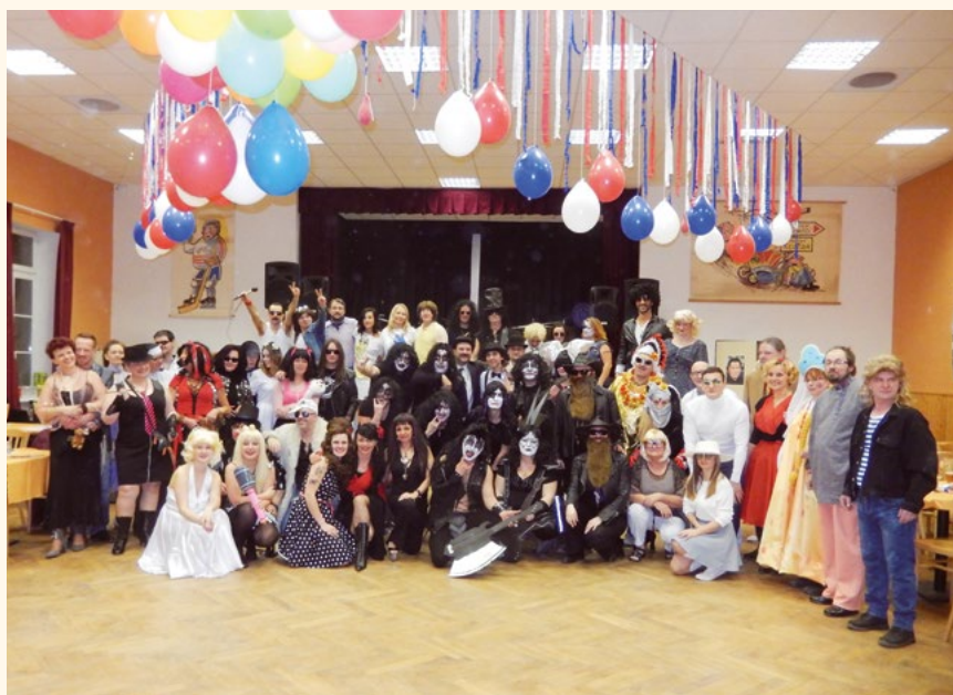
Maškarní bál v kostýmech šoubyznysu.