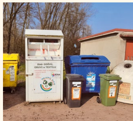
Třídění odpadu.