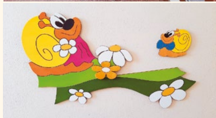
Ve zdravotním středisku můžete využívat otevřenou knihovnu.