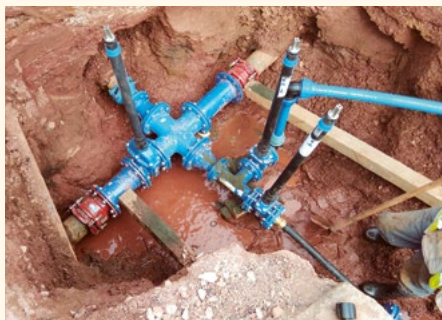
Vodovodní uzel ul. Ke Hřišti, Polní a Okružní.

Zastupitelé schválili novou cenu vodného, která činí od 1. ledna 2020 21,10 Kč bez DPH, včetně DPH 15% 24,26 Kč, a od května navíc bude pro fyzické osoby (občany) vodné a stočné levnější, protože dojde ke snížení sazby DPH z 15 na 10 %, tedy k poklesu na 23,21. Odběratelé tak za kubík odebrané vody zaplatí o 0,84 Kč více než dosud. Zdá se, že se jedná o drastický nárůst ceny, ale za poslední dva roky se cena neměnila. Museli jsme však zdrazit z důvodu navýšení ceny za vzorkování, chlorování a růstu minimálních mezd zaměstnanců, vše se totiž započítává do ceny vodného. Kvůli snížení daně dojde k odpočtu vodoměru za 1. Q až k 30. 4. 2020.