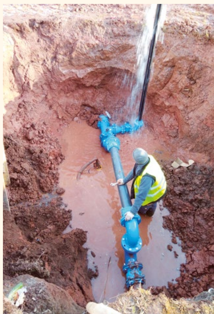
Oprava vodovodního řádu ul. Tovární.

Od ledna 2019 je v platnosti novela vodního zákona, z něhož a souvisejících vyhlášek citují: „Majitelé domů budou muset od ledna 2021 prokázat, kolik odpadu z jejich bezodtokových jímek (žump) bylo vyvezeno a zlikvidováno na čistírně odpadních vod. Tato informace je pro všechny, kteří nebudou napojeni na centrální splaškovou kanalizaci a nemají zajištěn odtok jiným povoleným způsobem (domácí čistička nebo filtr). Pokud objem nebude odpovídat spotřebě domácnosti, vodoprávní úřad uloží pokutu až do výše 100 tisíc Kč. Pokutu vodoprávní úřad uloží i v případě, že majitel nemovitosti nebude mít zákonem požadované doklady, a to až do výše 20 tisíc Kč“. Nechci vás strašit, ale je možné, že k této situaci dojde, neboť jsme v současné době trochu chráněni výstavbou ČOV.