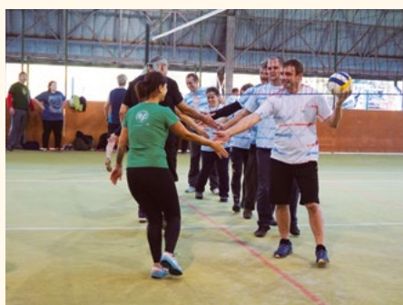
Děkovačka po „přáteláku“ s Batňovickými – podzim 2019.