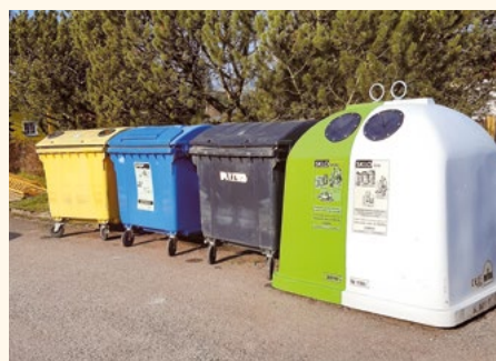
Kontejnery v Pilníkově.