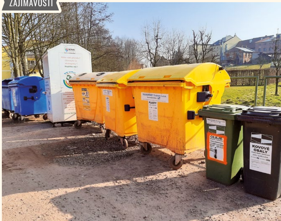
Třídění odpadu.