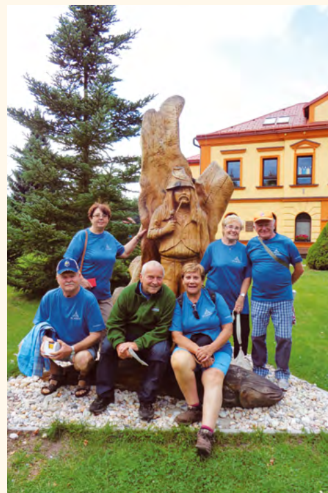
JČ Senioři u havlovického vodníka.

V pozdních odpoledních hodinách jsme se vraceli plni zážitků s přesvědčením, že za rok určitě znovu vyrazíme. Jistě také rádi přivítáme nové členy, nebojte se nás kontaktovat.