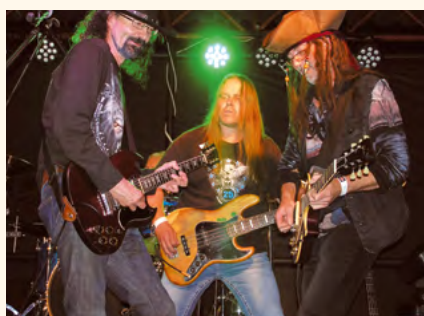
Pumpa – legenda české rockové scény – rok narození 1981.

už po zaznění prvních akordů. Zlatým hřebem večera, ba dokonce snad i letošního rockového léta byla kapela Pumpa, která působí na naší hudební scéně už od roku 1981 a byla vybrána posluchači rádia Beat jako předkapela skupiny AC/DC v pražských Letňanech. To je znát jak na jejich fanouškovské základně, která se k nám díky tomu stáhla z širokého okolí, tak i na úrovni hraní. Již při prvních tónech nám bylo jasné, že půjde o výjimečné vystoupení.