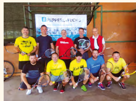
Účastníci tenisového turnaje 2019.

Akce se zúčastnilo 10 tenisových nadšenců, kteří za úmorného vedra bojovali o umístění od ranních až do večerních hodin. Řekl bych, že všichni zúčastnění byli vítězové, protože není důležité vyhrát, ale zúčastnit se a za úmorného vedra si všichni zasloužili vyhrát, přesto až v 21:30 h večer vzešla z turnaje trojice nejlepších. Na třetí místo dosáhl po boji