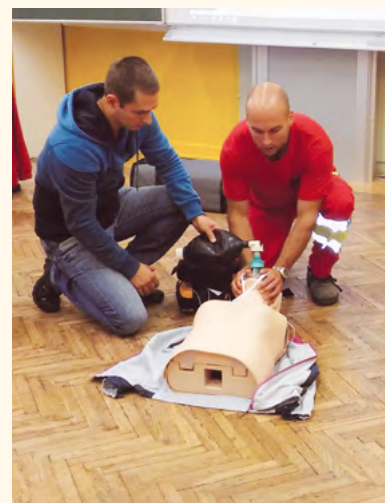
Pilníkovští hasiči si zkoušejí záchranu života na školní resuscitační figuríně.