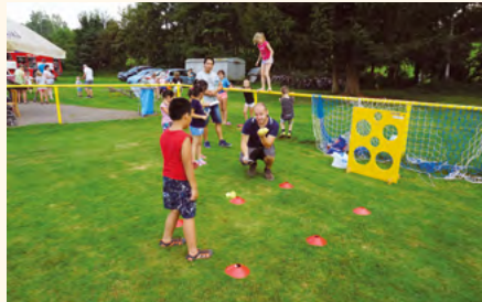
Při loučení s prázdninami byl pro děti nachystán velký výběr soutěžních disciplín.

Naše mužstvo dospělých po těžkých bojích v hlavní části a následně „nadstavbě“ ukončilo sezónu v „Okresní soutěži III. třídy“ z 12 týmů na 7. místě se skóre 50:39. Mohli jsme se umístit na vyšších příčkách, kam budeme ale určitě mířit v sezóně 2019/2020. Pro následující sezónu 2019/2020 jsme přihlásili po dlouhé době tři družstva.