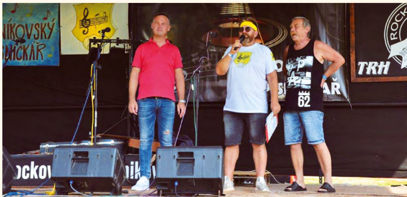
Zahájení Pilníkovského písničkáře 2019.