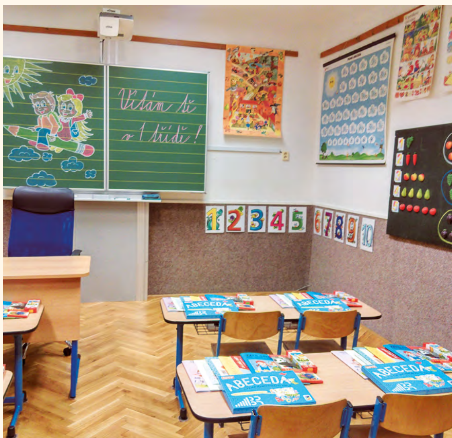
Třída připravená na příchod školáků.