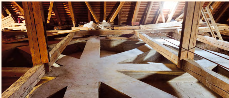
Žebra na obnovené klenbě.