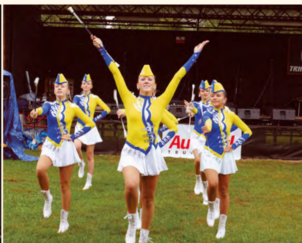
Nemesis z Trutnova.