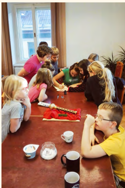
K podzimnímu nocování v knihovně tradičně patří podpis na listinu krále Knihoslava, která je uložena v tajné schránce.

Pozůstalým rodinám vyslovujeme upřímnou soustrast