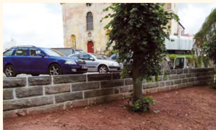
Oprava opěrné zdi u kostela byla dokončena během letních měsíců.