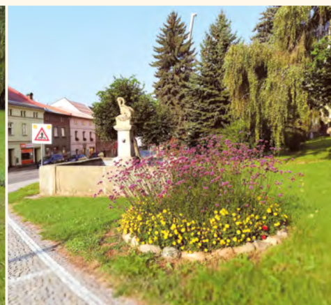
O zkrášlení prostředí parku se postaraly ženy z klubu senierek.