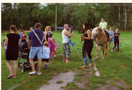
Loučení s prázdninami 2019 bylo na hřišti i v sedle koní.

Turnaj kategorie U15/U17 vyhrál Trutnov, druhý skončil Rudník, třetí Pilníkov/Staré Buky.