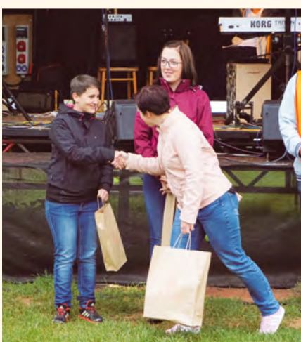
Tři nejlepší ženy v hodu nafukovací paličkou.