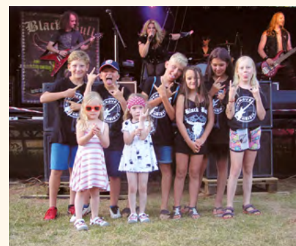
Nová generace fanoušků, někteří už ve firemních tričkách a Black Bull potřetí u nás.