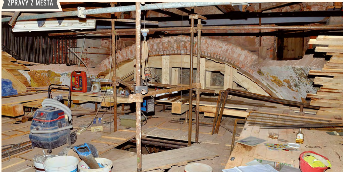
Oprava klenby.

V loňském roce 2018 byla dokončena obnova zřícené klenby a byly zahájeny práce na obnově klenby nad presbytářem. Pod klenbou byl proveden podpůrný systém z lešení. Byla vysekána spárovací hmota a nově vyspárováno zdivo pomocí aktivované malty. Následně byla provedena také injektáž zdiva. Do sanovaného zdiva byla dodatečně vlepena výztuž a byly sanovány trhliny obvodového zdiva presbytáře. Byla vysekána spárovací hmota poškozeného zdiva a vše bylo nově vyspárováno pomocí aktivované malty. Poškozené prvky zdiva byly přezděny a opět byla provedena injektáž trhlín a sanace zdiva pomocí dodatečně vlepených výztuží. Tuto práci můžete vidět i zvenku na jižní straně kostela. Byla jí opravena největší svíslá trhlina v celé obvodové zdi kostela. Trhlina se rozbíhala na obě strany od malého okna a byla místy tak široká, že nebyl problém do ní strčit celou pěst.