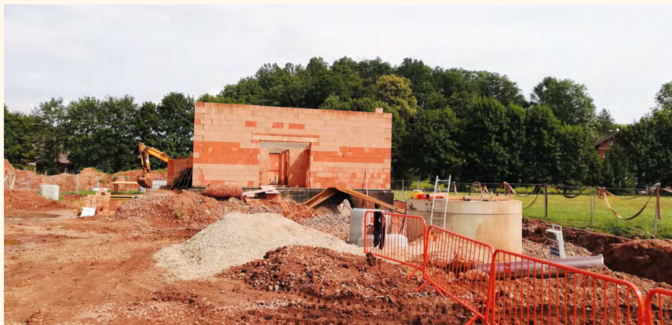
Součástí nové kanalizace budou i nové budovy.