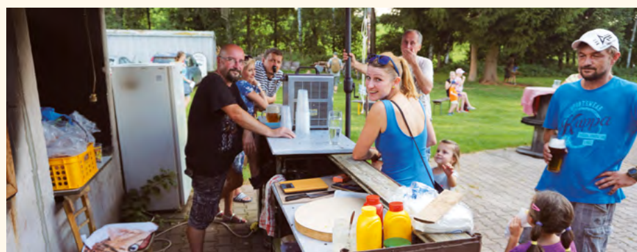
Pěkné počasí při loučení s prázdninami na hřišti podtrhla ještě nabídka občerstvení.

Vikendová akce se velmi podařila a myslím, že všichni budou mít dlouho na co vzpomínat.