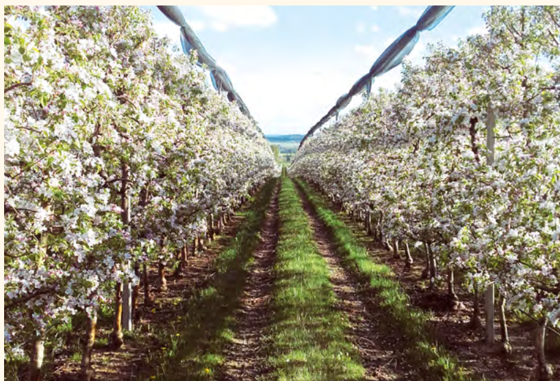
Kvetení po mechanizovaném řezu.

Jablka Dolany nemusíme v Pilníkově představovat. V pravidelných intervalech se zde na náměstí objeví nákladní auto a přímo z jeho nákladního prostoru si Pilníkovští mohou od dobře naladěných prodejců nakoupit kvalitní ovoce, zeleninu a třeba i med. Zemědělské družstvo Dolany patří k největším pěstitelům jablek v České republice, a co tato práce obnáší a jak se na trhu českým pěstitelům daří, nám pověděl Ing. Jiří Fišer.