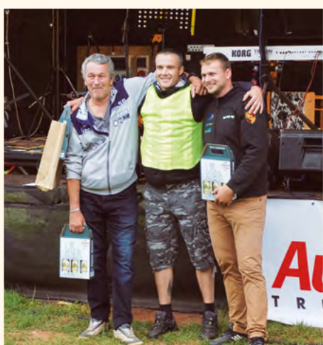
Vítězové hodu soudkem.