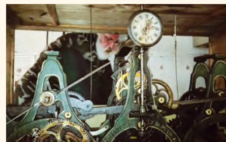
Hodinový stroj v pilníkovském kostele.

V roce 2017 byly dokončeny podélné obrubní pasy kolem zřícené klenby a zahájeny práce na obnově samotné klenby – byl vytvořen podpůrný systém z lešení a ramenátů pod klenbu a bylo provedeno bednění klenby.