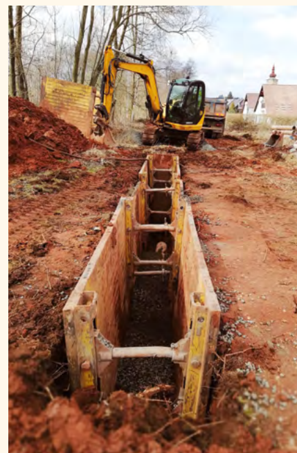
Výstavba kanalizace v roce 2019.