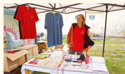
Při vstupu si návštěvníci mohli zakoupit upomínkové předměty s logem Pilníkov.