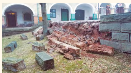
Takto vypadal stav zdi v březnu 2019.