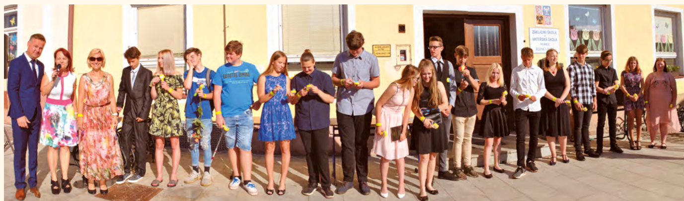
Loučení s devátou třídou, červen 2019.