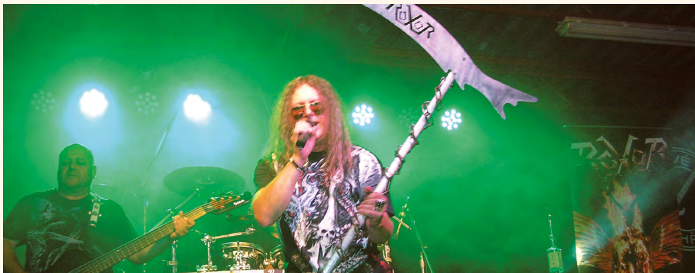
Roxor – parta rockerů z Nymburka.