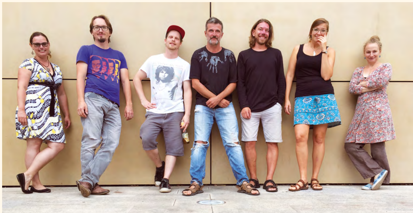
Tlupa u Uffa – Trutnovské hudební léto 2018.