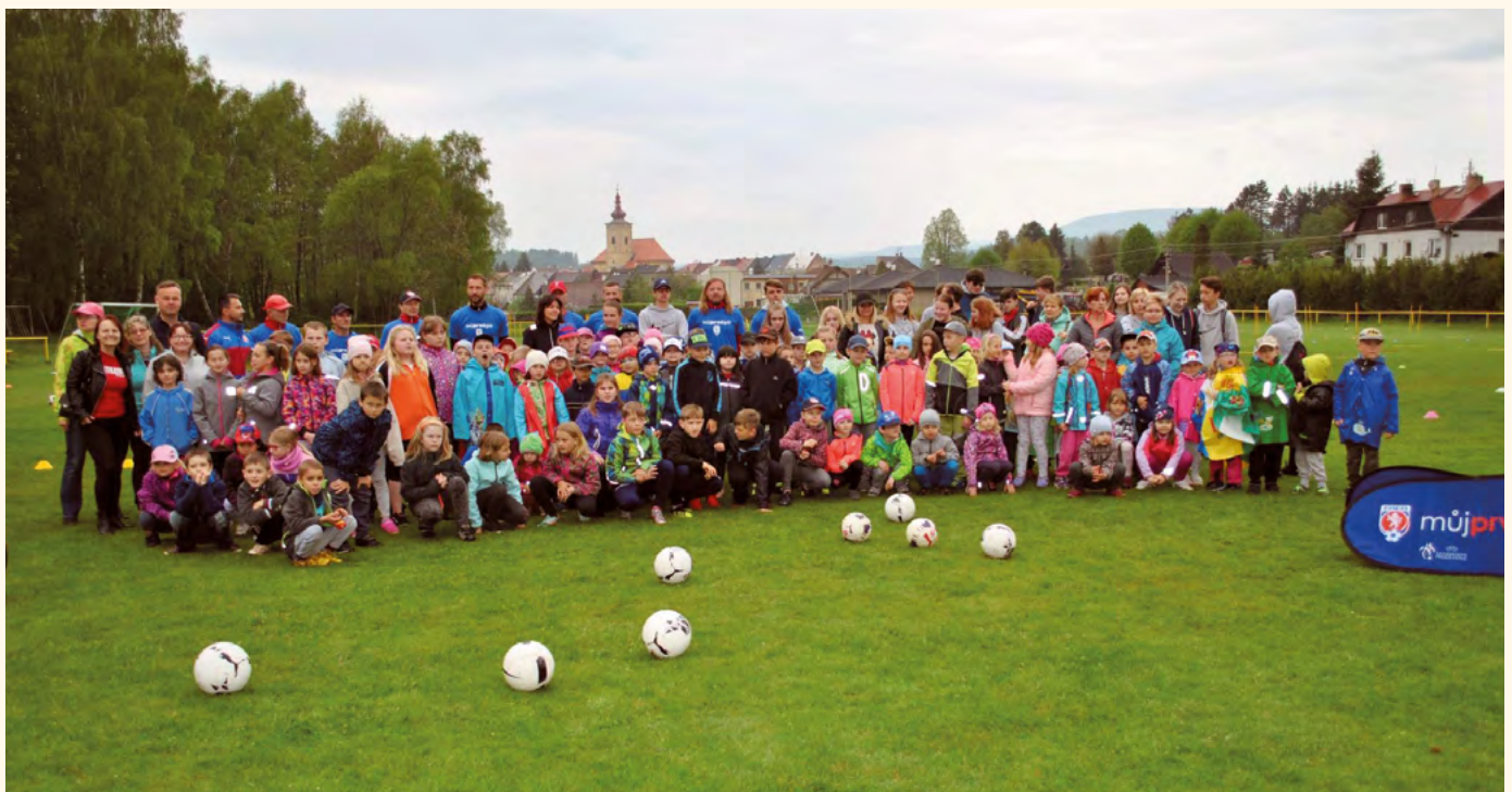
Náborový den 20. 5. 2019.

Samozřejmostí jsou dále plánované akce na rok 2020, soustředění dětí a dospělých, ples, nohejbalový a tenisový turnaj, mezinárodní fotbalový turnaj, sportovní odpoledne pro děti, případně další akce.