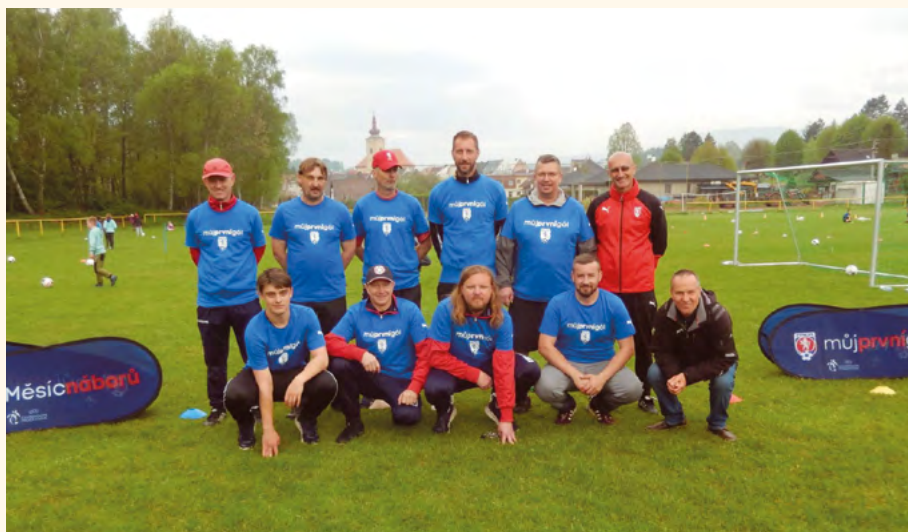
Pořadatelé a členové TJ Spartak Pilníkov.

V turnaji kategorie U10/U12, kterého se účastnily týmy Pilníkov, Profenu, Vítězná a Rudníku, skončil na 1. místě tým Profenu, dále se umístily týmy Pilníkov/Staré Buky, Rudník, Vítězná.