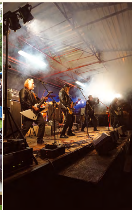
Vaták a písně Kabátů v Pilníkově.