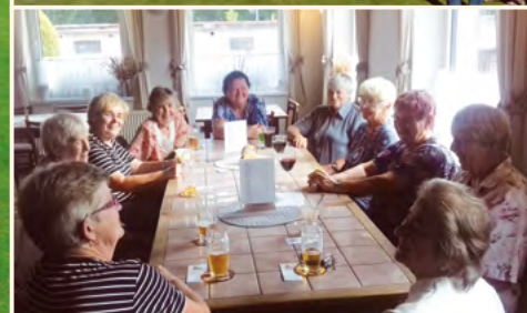
Zleva: Družstvo seniorů na havlovické olympiádě pro starší a dříve narozené. Seniorky při pravidelném setkání.