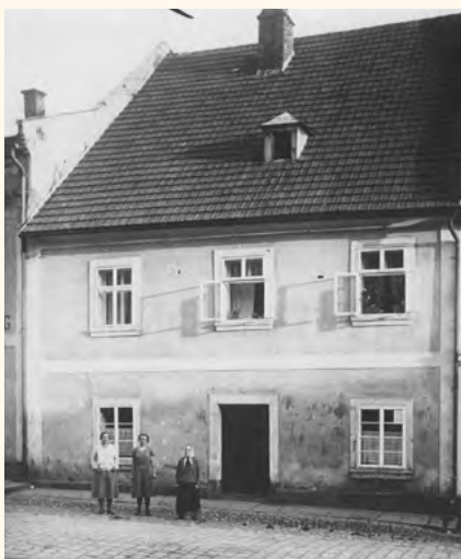
Zatím nejstarší nalezená fotografie okolo roku 1905