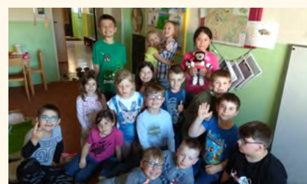
Žáci naší školy sledují putování Lumpíka na mapě ČR.

Na své cestě Lumpík poznal kromě své medvědí lásky také různá města a památky naší země, navštívil hvězdárnu, kino, chodil s dětmi na výlety a další aktivity ho ještě čekají. Z letmého nápadu ostravské družiny vyslat malého medvídko do světa se stala dobrodružná aktivita pro přibližně 50 školních družin z ČR. Pilníkovská družina byla puntík číslo 28 na mapě.