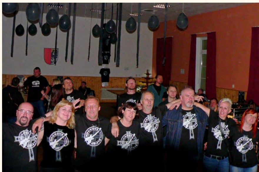
Rockové tance a tanečky.