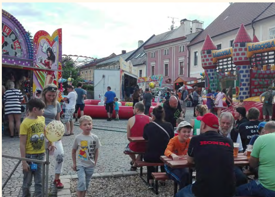
Pouť 2019 v plném proudu.