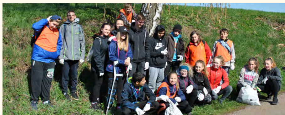
Počasi přálo a úklid se dařil.

Po společném zahájení akce na náměstí, kde zúčastněné přivítal pan starosta a paní ředitelka školy, se skupiny mladých pomocníků rozesly na předem určená místa na trasách v Pilníkově a okolí. Devátá třída dobrovolně pomohla uklízet i část území u větrné elektrárny, které patří obci Vítězná.