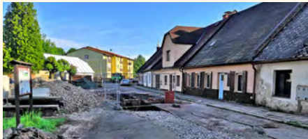
Výkopy v ulici Hradčín patří k nehlubším.

číslo 21 stanic, což platilo pro připojení Vlčic. Pro zajímavost ještě doplním, že energetická náročnost všech šesti přečerpávacích stanic dohromady bude přibližně 110 tisíc kWh/rok, takže i energetická úspora snížením počtu přečerpávacích stanic bude dost výrazná, nemluvě o dalších nákladech. Protože nemám podklady k nerealizovaným čerpacím stanicím (každá stanice obsluhuje jiné množství EO, tak mají i různou spotřebu), tak jen velmi hrubým odhadem může být úspora elektrické energie v rozmezí 600 tisíc až jednoho milionu korun ročně. A to již není zanedbatelná částka! A když už jsme u nákladů, ještě něco o nákladech na domácí čerpací stanice. Majitel připojené nemovitosti hradí provoz stanice, což je závislé na množství odpadních vod, které vyprodukuje. Energetická náročnost je 0,5 kWh/m 3 , takže pokud EO počítá se 150 litry na jednu osobu, 1000 litrů vy-