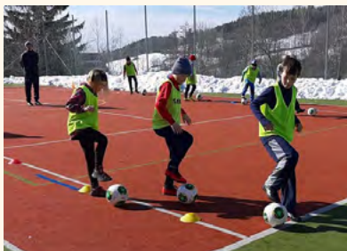
Benecko zimní soustředění – děti.