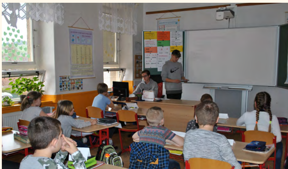
Škola naruby – v hlavní roli 9. třída. Fotoarchiv ZŠ