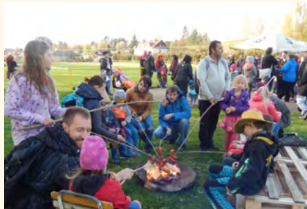
Hasičská hranice pro čarodějnice a opékání u čarodějnického ohně 2019.