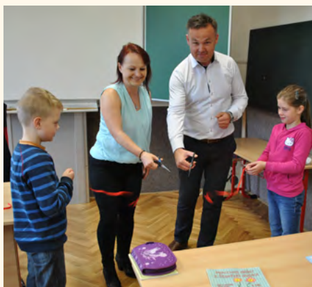
Slavnostní zahájení výuky v novém.