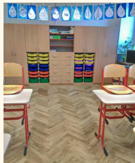
V novém se to bude učit.