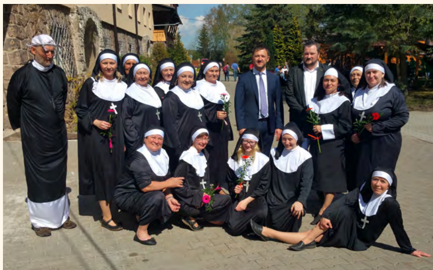
Farářovy schovanky v Temném dole.