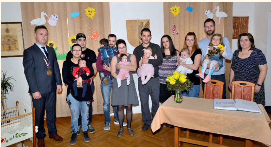
Vítání občánků 7. 4. 2019.

Na nedělní odpoledne 7. 4. 2019 připravil sociální výbor spolu s panem starostou první letošní vítání nových občánků, a protože je jaro, byla výzdoba sálu v jarním stylu. Ve slavnostně nazdobené zasedací místnosti na radnici se sešli nejmladší občánci se svými rodiči i prarodiči a zástupci města.