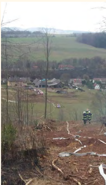
Pilníkovští hasiči při akci v Prosečném.

Kroužek mladých hasičů se ve spolupráci s mysliveckým kroužkem zúčastnil 17. 4. 2019 zájezdu do aquaparku v Polsku. 4. 5. 2019 děti závodily na trati 60 m překážek požárního sportu ve Vlčicích a 19. 5. 2019 opět na trati 60 m hasičských překážek v obci Hajnice.