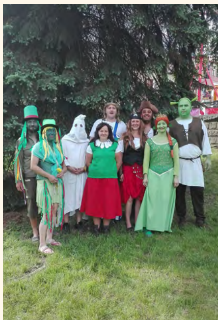
Kostýmovaná jednotka po výkonu u soutěží pro děti.