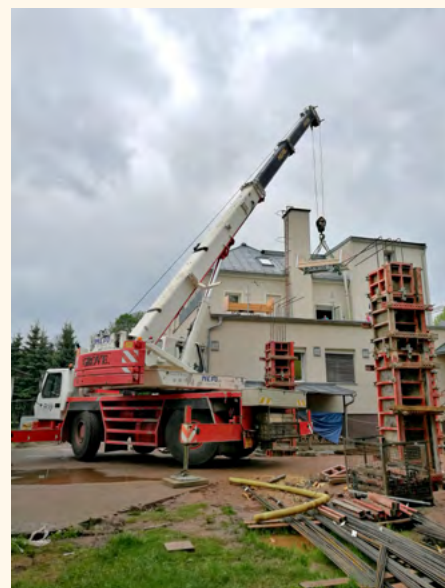
Nešlo to jinak, než s pomocí jeřábu.