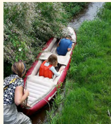
Plavba na potoce – zkouška na otevřenou ulici, léto 2017.