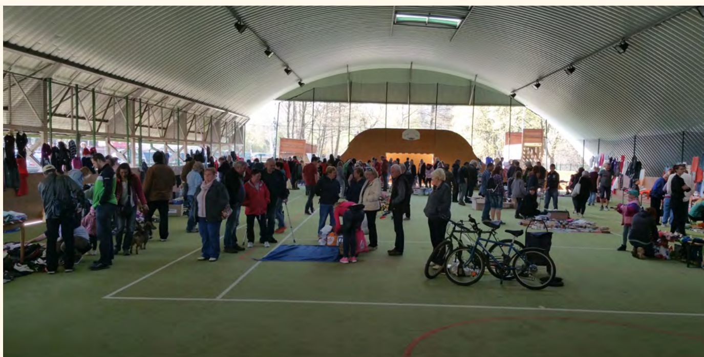
Pilníkovský blešák sklízí úspěchy v širokém okolí.