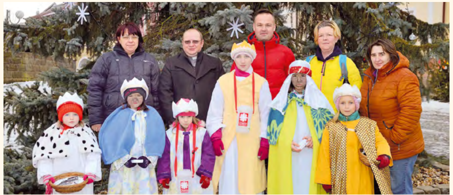
Tříkrálová sbírka.

V sobotu 5. a v neděli 6. ledna 2019 odpoledne se na pilníkovském náměstí již popáté sešly dvě tříkrálové skupiny, které v doprovodu dospělých vedoucích procházely městem a nezapomněly se zastavit ani v Domově pro seniory Pilníkov.