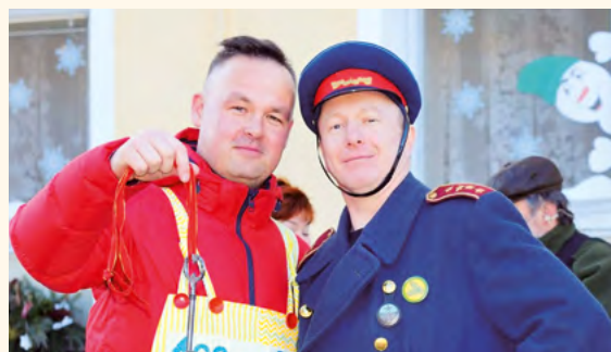
Starosta s policajtem.

Mohlo by se zdát, že masopust je jedna z tradic, jak už se s tím v naší době setkáváme, která se lidem vzdaluje. Je tomu tak z více důvodů, o kterých tu nechci psát. Mění se společnost, kulturu ovlivňují nové technologie, lidé si myslí, že k sobě mají blíží, a možná je to všechno jinak. Při jedné akci – masopustním průvodu, kdy si byli lidé hodně blízko, jsem se zeptala, jak masopust a tradice vidí návštěvníci a občané Pilníkova.