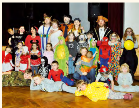
Závěrečné fotografování.