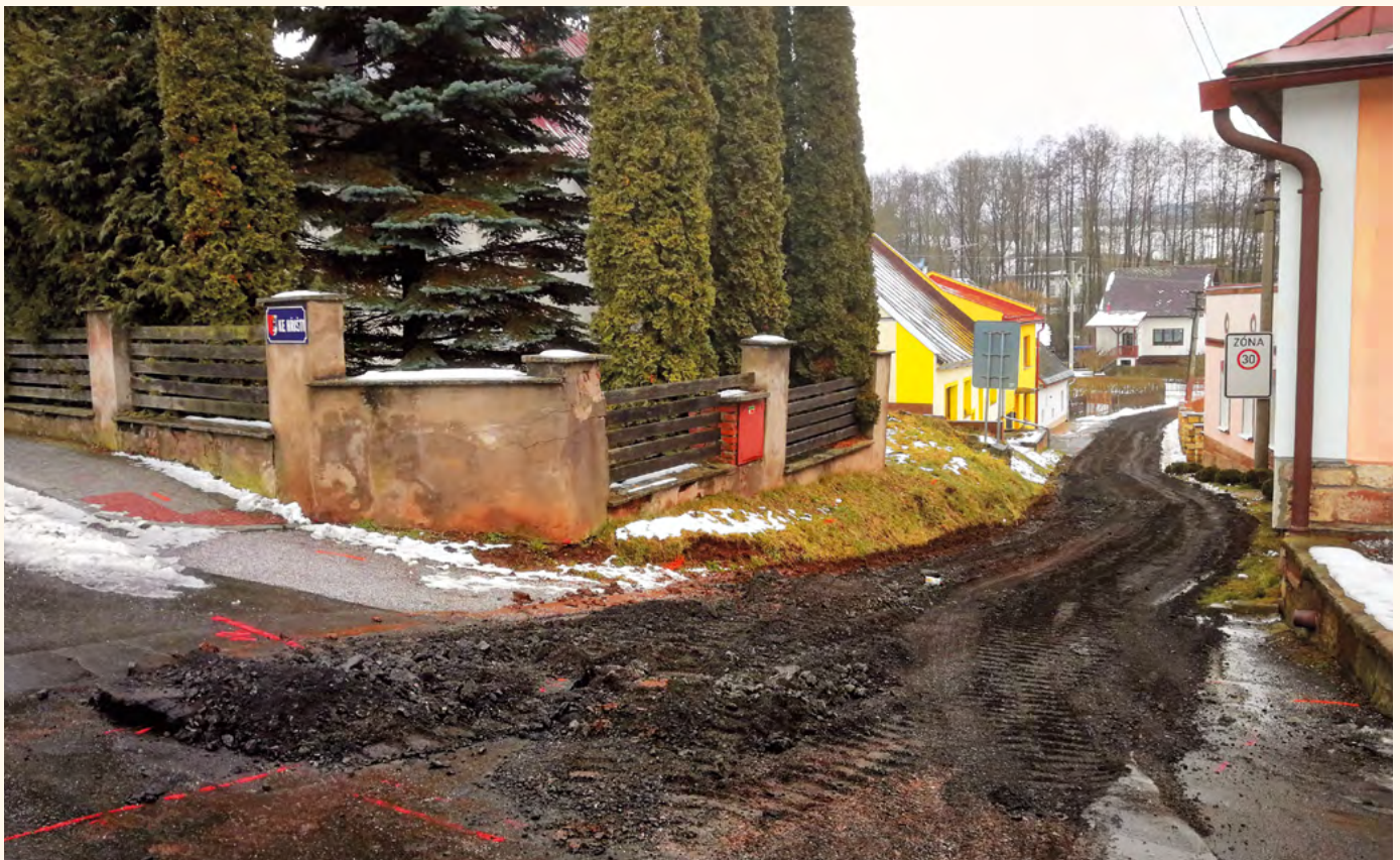
Kanalizace v ulici Ke Hřišti.