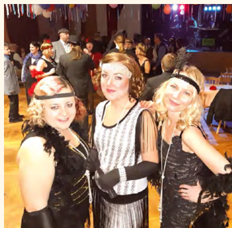
Sportovní ples 2019.