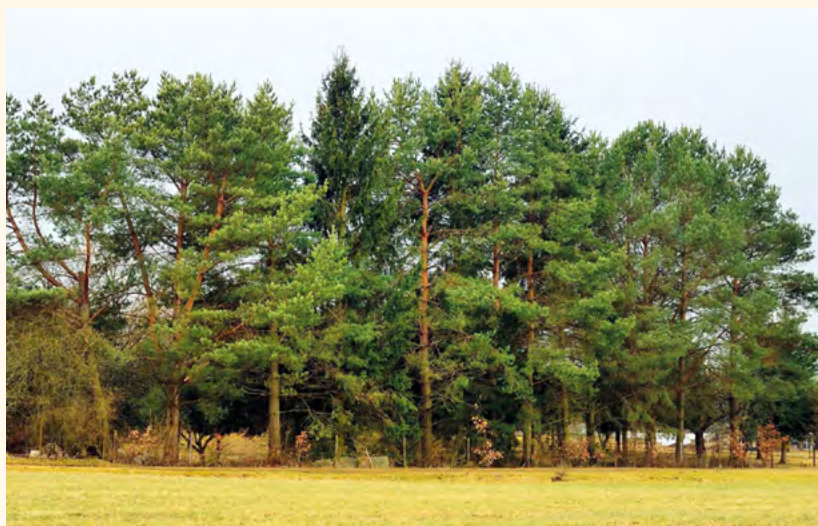
Ilustrační foto. J. Blažek