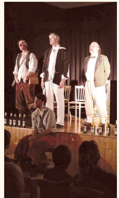
Divadlo Baf a Atentát .