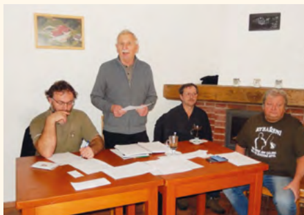
Schůze rybářů.

Na závěr předseda místní skupiny popřál všem členům a jejich blízkým hodně zdraví, pohody a hezkých chvil strávených u vody.