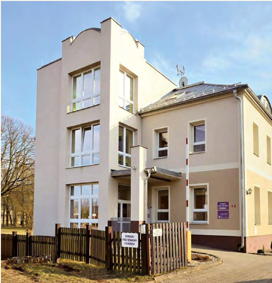
DPS Pilníkov.