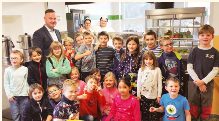
Starosta se strávníky a s kuchařkami