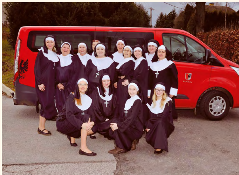
Farářovy schovanky v Chotěvicích.