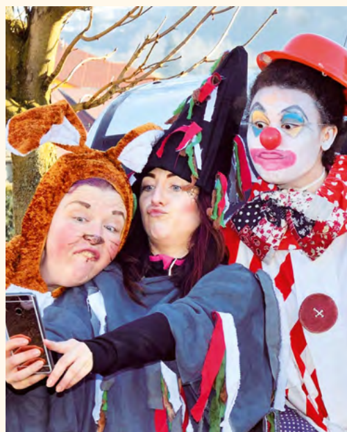
Selfíčko z masopustu.