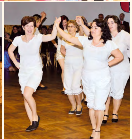
↗ Sál byl plně vyprodán. ↖ Schovanky.