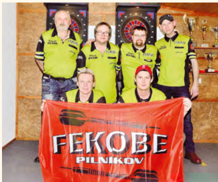
FEKOBÉ Pilníkov.