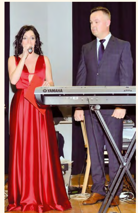
Moderátorka se starostou města.

I o letošní ples projevíli zájem nejenom místní sponzoři, kteří do tomboly dali mnoho zajímavých cen. Dokonce i samotná vstupenka byla poukázkou na slevu v cestovní kanceláři.