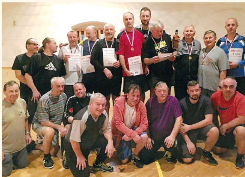
Nohejbalový turnaj prosinec 2018.

Nohejbalistům i turnaji přejeme další vydařené ročníky a chuť trénovat celoročně, dárek za svou píli v podobě medaile z prosincového turnaje na sebe určitě nenechá dlouho čekat.