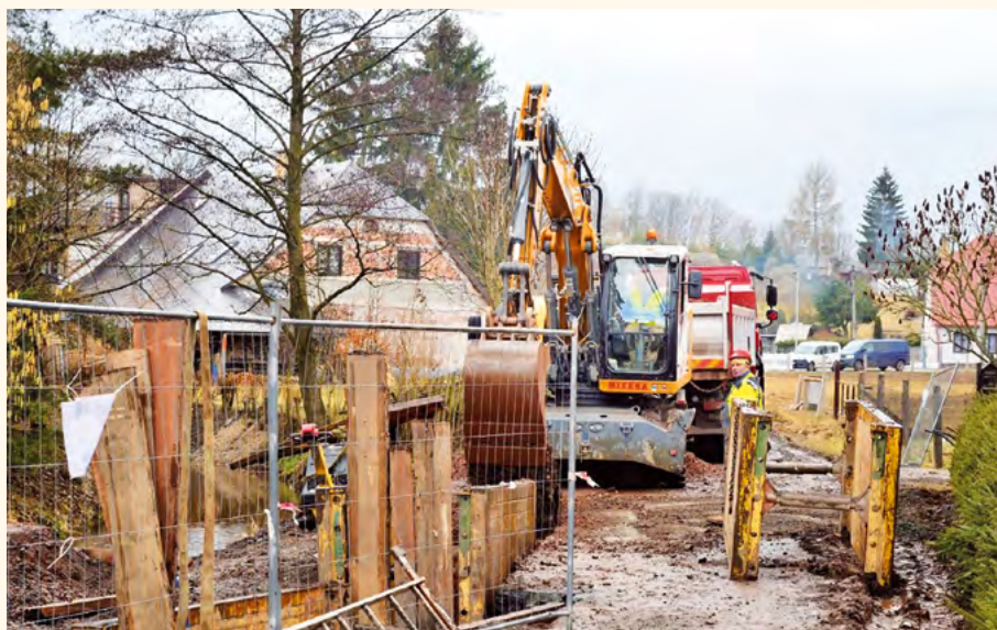
Výstavba kanalizace v Tovární ulici.

O kanalizaci a ČOV se mluví již dlouho. Jednou byla výstavba zastavena těsně před realizací a nemá cenu si nalhávat, že nyní jde vše bez problémů. Některé ulice jsou rozkopané a špatně se po nich pohybuje. Je jedno, zda jdete pěšky, či jedete autem. Na internetových stránkách obce ale najdete předpokládaný rozpis plánovaného postupu prací. Nyní si trochu zrekapitulujeme, co o kanalizaci a ČOV bylo napsáno. Ale jen velmi stručně, protože vše najdete na webu Pilníkov.cz v rubrice Pilníkovský zpravodaj a v zápisech z veřejných zasedání.