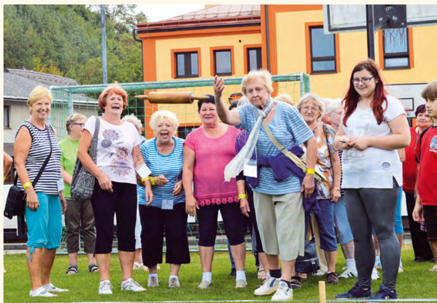
Hod válečkem.