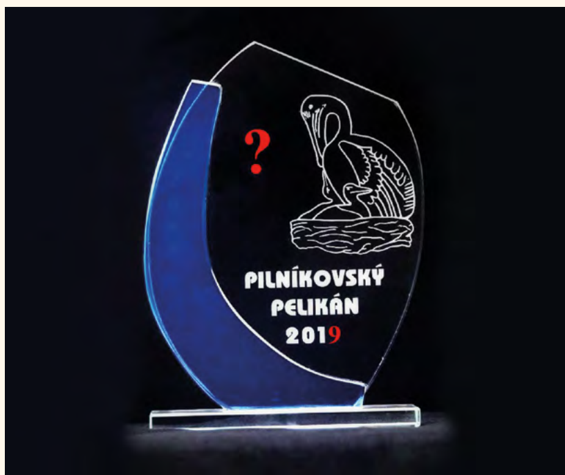
Cena Pilníkovský pelikán.