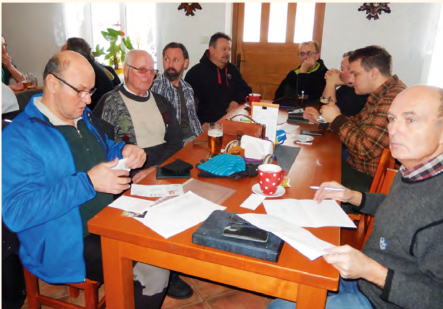
Schůze rybářů v Penzionu u Skutilů.