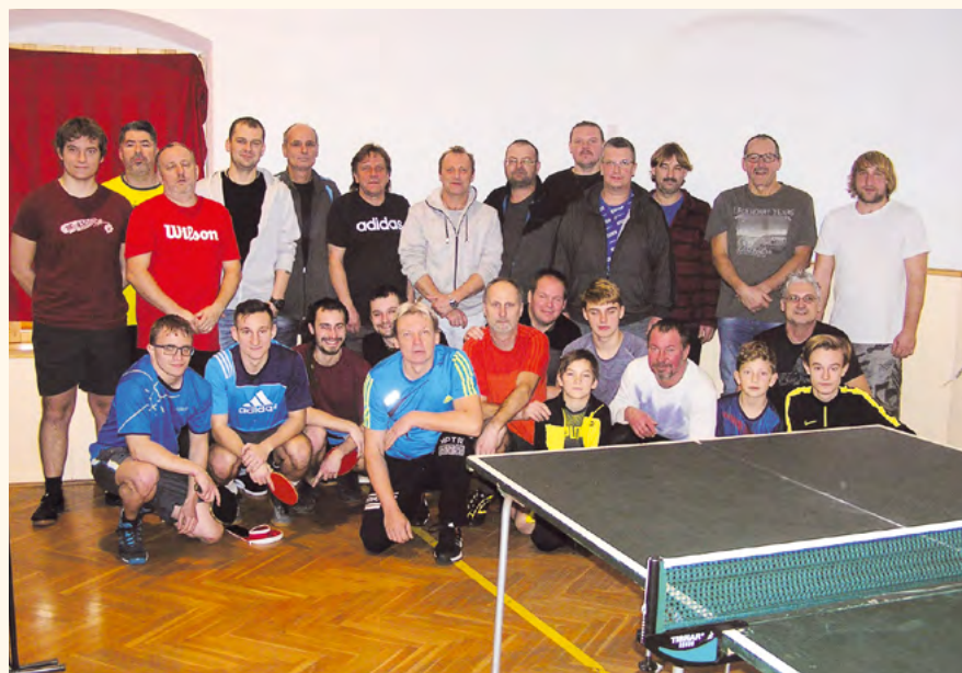
Účastníci výročního třicátého turnaje 2018.