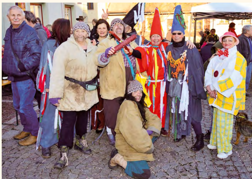
Masky na náměstí.