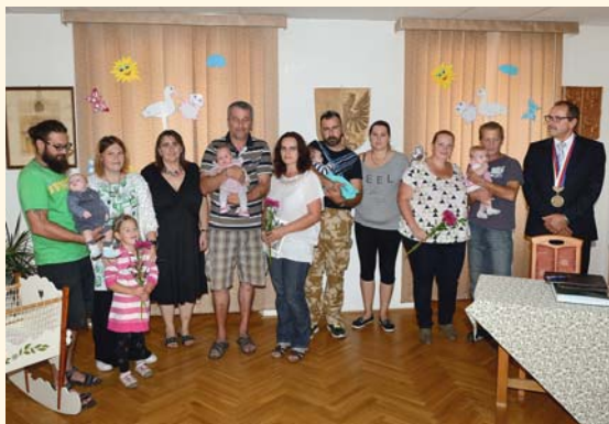
Vítání našich občánek

■ Přejeme dětem šťastný a radostný život v našem městě. JB