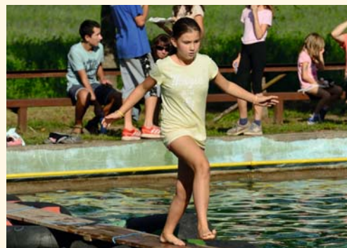
Běh po lávce přes požární nádrž

děra, který dlouhá léta vychovával a stále vychovává mladé rybáře, jezdí s nimi po soutěžích, pořádá rybářské tábory. Prostě se jim obětavě věnuje. V současné době asi není v Pilníkově mezi mladšími rybáři žádný, který by neprošel Láďovýmma ruka-