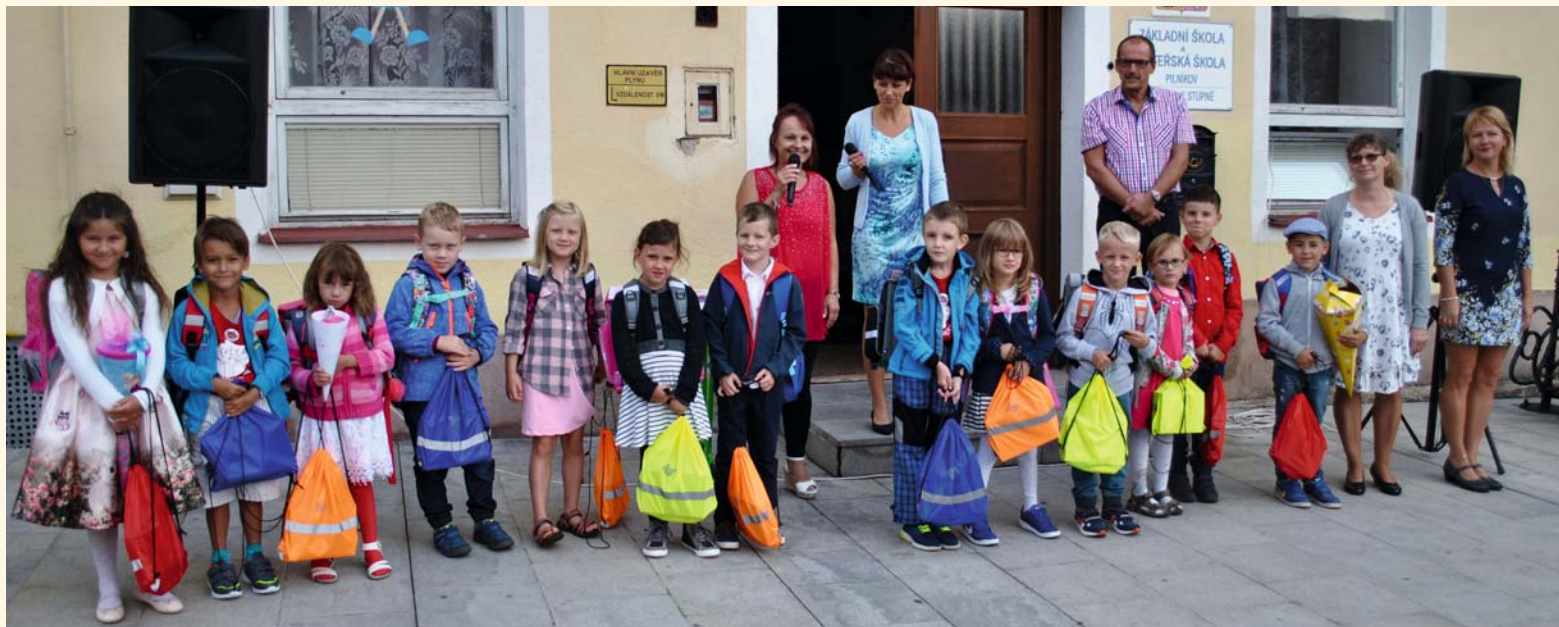
Naši prvňáčci byli slavnostně přivítáni při zahájení školního roku.