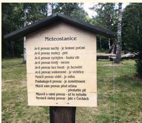
Tomu rozumí každý

■ Lesní areál v osadě Hájemství je určen všem milovníkům přírody. Nachází se zde řada dřevěných soch, keltský stromový kalendář, model Krkonoš, cesta dřeva nebo hřbitov odpadků. V areálu začíná nauč-