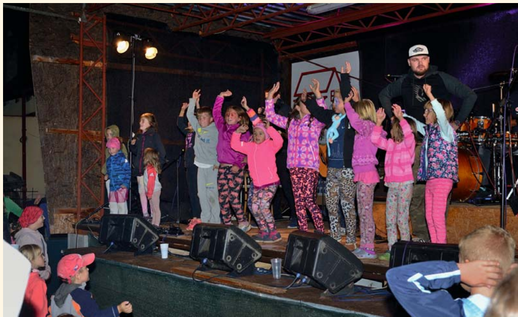
Děti na pódiu se skupinou Divokej Bill Revival