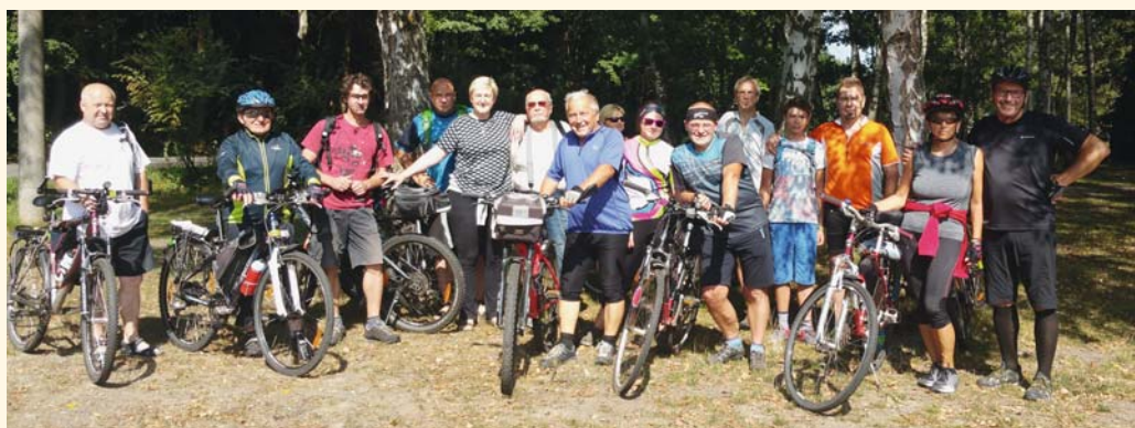
Účastníci cyklovýletu do Orlických hor 2018