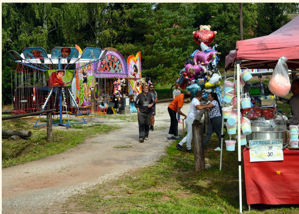
Na dnu nechyběly ani klasické pouťové atrakce jako řetízkový kolotoč, zmlina a cukrová vata