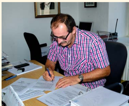
Podpis smlouvy 12. 9. 2018

Dne 12. září 2018 byla na městském úřadě podepsána smlouva s výhercem veřejné zakázky na výstavbu kanalizační sítě a čistírny odpadních vod, kterým se stala Společnost BAK & PDV Stavby – Pilníkov.