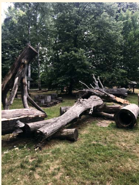
Příroda všude, kam se podíváš

Že nevíte, kde to je??? Já jsem to také nevěděla. Byla to náhoda. Jeli jsme na kolech na výlet na přehradu Les Království. A když jsme projížděli Vítěznou, kamarád se nás zeptal, jestli jsme již někdy navštívili osadu Hájemství. Je to po cestě, tak co kdybychom se tam zastavili? No a proč ne.