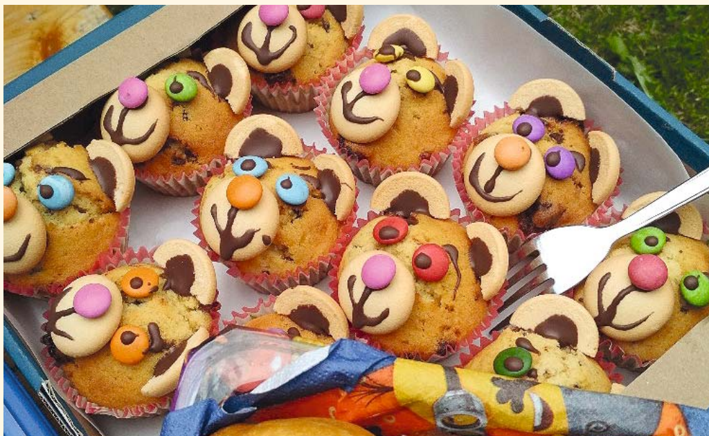
Pohoštění pro hosty na zahradě MŠ

■ Škola se zapojila do projektu Podnikavá škola. Projekt je na tři roky a po skončení získá škola certifikát Podnikavá škola. Zapojeny jsou také 4 další školy v Královéhradeckém kraji. Úkolem je pilotovat aktivity