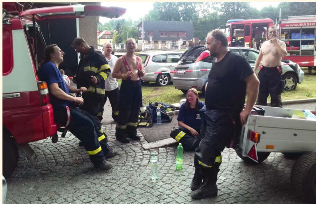
Zasloužený odpočinek po ostrém zásahu našeho HZS při požáru v Maršově.

Dne 8. 8. 2018 bylo potřeba pomoci s likvidací následků bouřky, kde strom spadl přes železniční trať v Pilníkově.