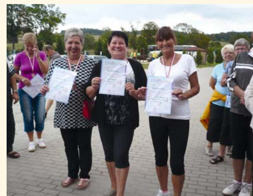
Radost z úspěchu