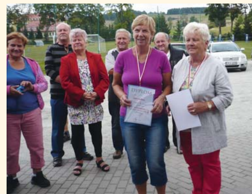
Předávání diplomů pro nejlepší

Ve čtvrtek 6. 9. se opět 22 důchodců z Pilníkova účastnilo 10. ročníku olympiády pro starší a dříve narozené. Vše se