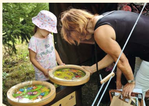
Nová hra – kuličková

Letošním jedenáctým půlením myslivci vstoupili do druhého desetiletí konání této úspěšné akce pro děti i dospělé. Půlení se konalo opět od 16 hodin u mysliveckého