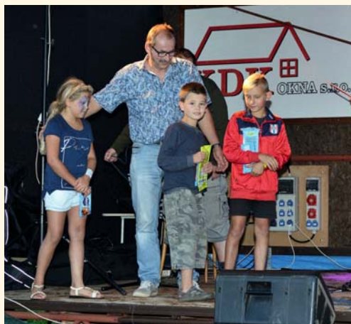
Ceny pro nejlepší