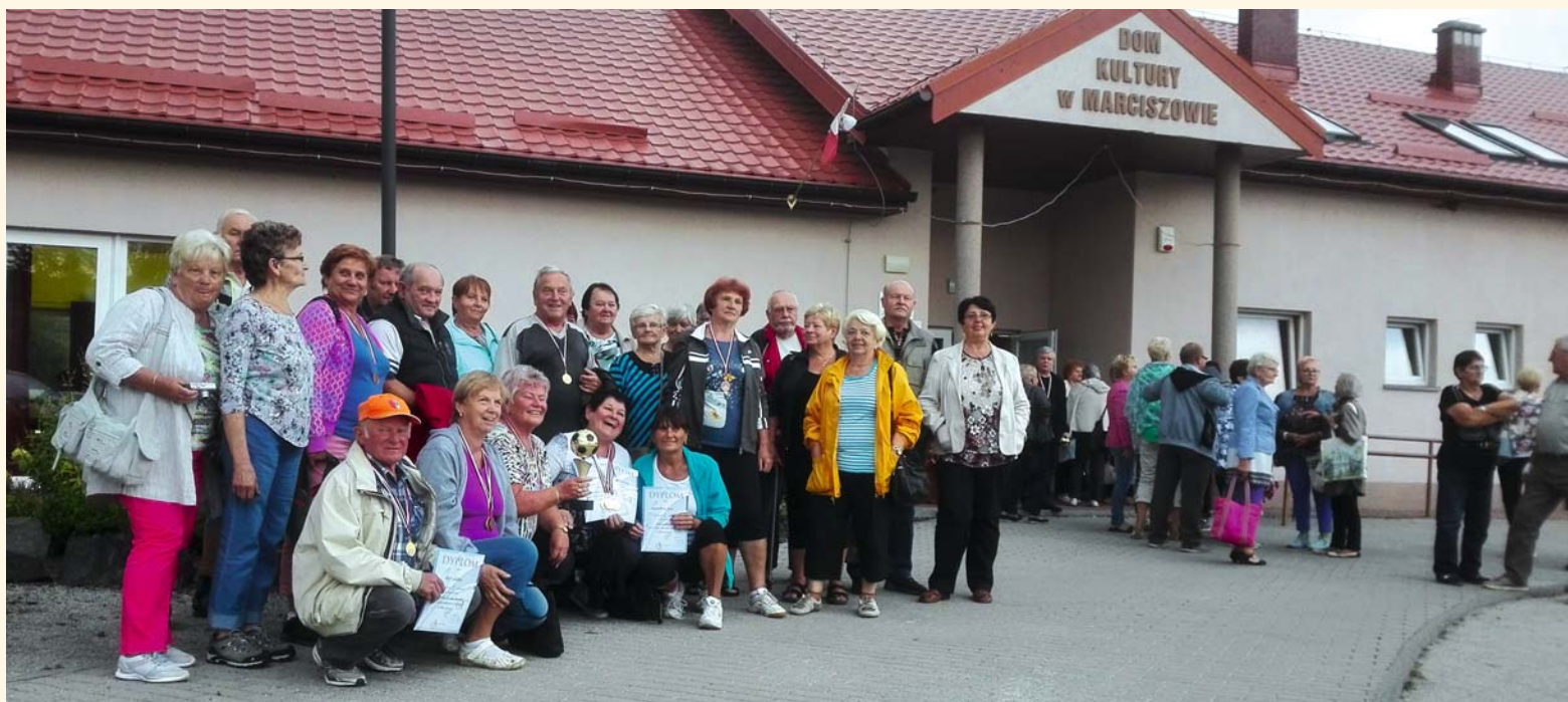
Úspěšná výprava v Polsku