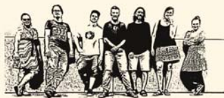
Textová ochutnávka na závěr: