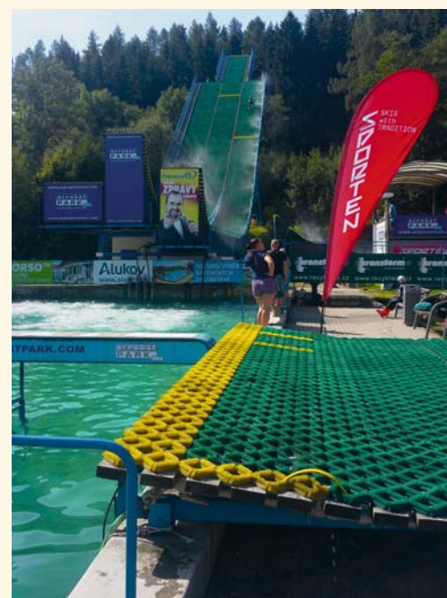
Odrazové můstky tréninkového areálu ve Štitech.

■ První část úkolu jsem splnil. Začal jsem hledat trasu na výlet, přeci jenom chalupa ležela v nadmořské výšce 566 m. Hledal jsem dlouho a zobrazoval jsem si výškový profil cesty a nakonec našel. Přes Albrechtice, Lanškroun, Horní a Dolní Dobruč do Ústí nad Orlicí. Cesta příjemně ubíhala hezkou přírodou a množstvím zastávek na