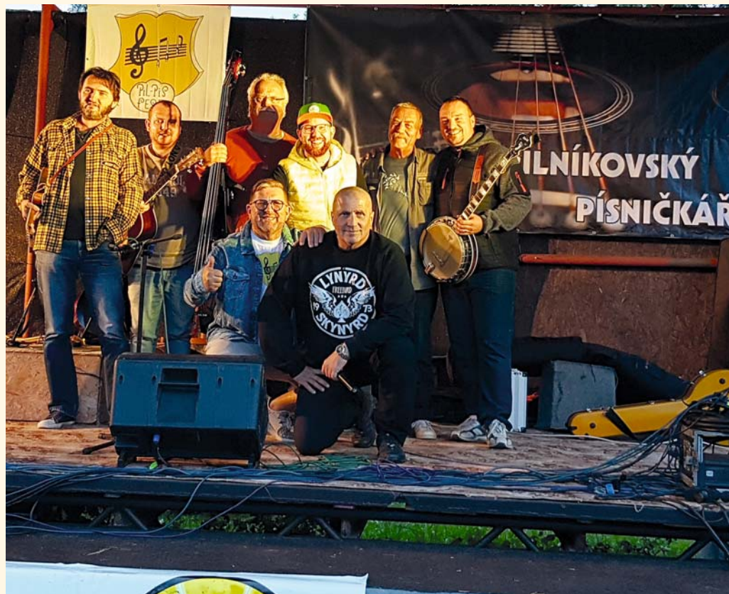
Poutníci - koncert v rámci Pilníkovského písničkáře

těm, kteří přeci jen nevědí, během léta na pilníkovském hřišti proběhly akce jako již třetí ročník Rockového hřiště, tradiční Pilníkofest, pokus o letní kino, Pilníkovský písničkář, fotbalové zápasy, dětský den – vítání prázdnin, zápasy v šipkách a postup soutěživých do extraligy.