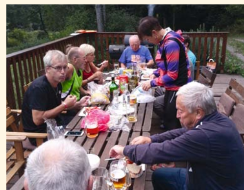
Zasloužené večerním posezení

Od pana starosty jsem dostal nelehký úkol, najít hezkou lokalitu na cyklovýlet s ubytováním pro 20 osob. Po dlouhém a intenzivním hledání jsem našel přesně to, co jsem hledal. Ubytování jsem našel ve vesnici Výprachtice, která leží v malebném údolí Moravské Sázavy v Orlických horách. Chalupa se jmenovala Orlička a splnila vše, co jsme očekávali.