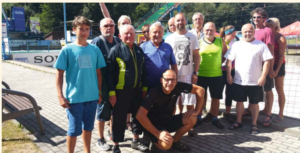
Společná fotografie s olympijským vítězem Alešem Valentou