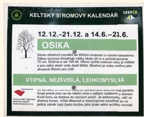
Keltský stromový kalendář

■ Velmi oblíbený je např. keltský stromový kalendář. Na ploše areálu si podle data svého narození najdete z celkového počtu 22 stromů ten svůj. Z tabulky se poté kromě jeho popisu ještě seznámíte s vaší charakteristikou.