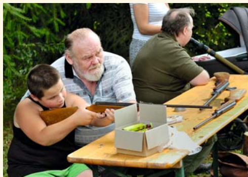
Střelba ze vzduchovky nemohla chybět

Po splnění každého úkolu děti dostávaly potvrzení o jeho absolvování, obrázky zvířat, omalovánky, pastelky i nějakou tu sladkost, které si mohly uložit do papírové tašky, již na úvod dostaly. Po absolvování