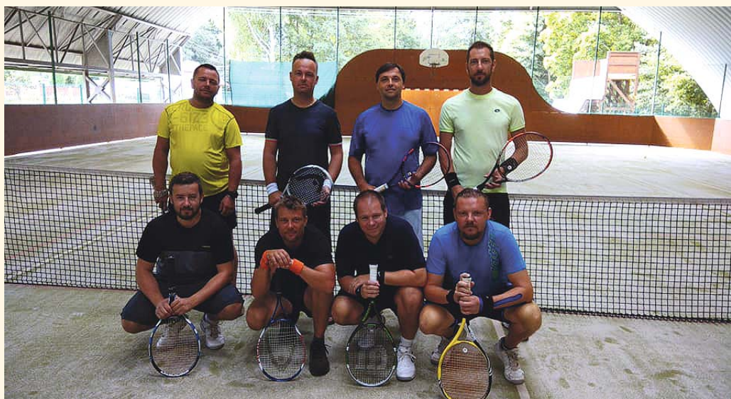
Tenisový turnaj v létě 2018