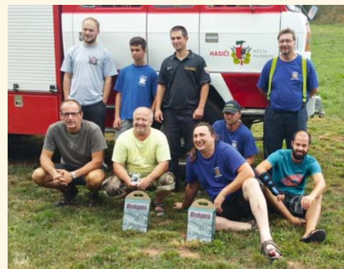
Soutěžní družstvo našich hasičů skončilo časem 29:35 sekundy na druhém místě.

což dokazuje, že musela být na místě dislokována i záchranná služba, která ošetřila 4 zraněné hasiče z různých jednotek (z naší naštěstí ne). Jelikož bylo velké horko, při práci v zásahových oděvech jsme ihned byli přehřátí. Bylo potřeba síly rozvrhnout a pravidelně se střídát, proto se na místě protočilo přes 80 hasičů z různých jednotek. Na základnu jsme se vrátili v pořádku něco po 18. hod. odpolední. Z naší jednotky pomáhalo celkem 9 hasičů a moc