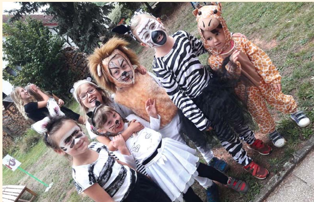
Madagaskar na zahradě MŠ