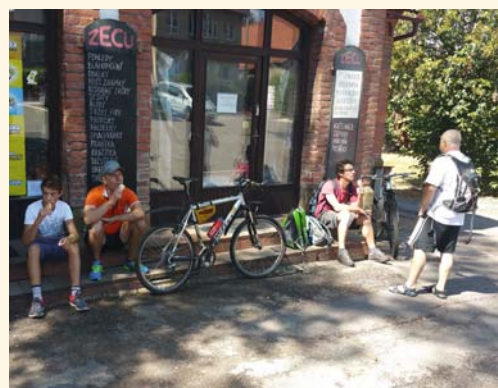
Zastávka na zmrzlinu