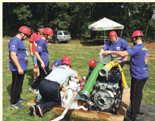
Péčlivá příprava družstva SDH Bernartice před startem. (foto: Miroslav Klapka)

■ V sobotu 18. 8. 2018 se konala od 10 hodin tradiční soutěž v požárním útoku s názvem O ŠTÍT MĚSTA PILNÍKOV na louce