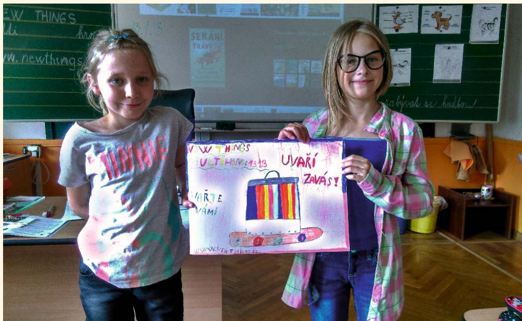
Podnikavá škola v Pilníkově

k rozvoji podnikavosti a k rozvoji podnikání dětí. Cílem celého projektu je seznamovat žáky s principy podnikání, seznamovat je s firmami v regionu, rozvíjet nápady a podnikatelského ducha, přemýšlení v této oblasti, dále rozvíjet kreativitu a morální kodex podnikatele a podporovat komunikaci a spolupráci žáků. Projekt podporuje Česká hospodářská komora. Škola již uspořádala v červnu 2018 celodenní projektový den Učíme se podnikavosti pro žáky 1. – 9. tříd. Děti se seznámily se základními podnikatelskými pojmy a také v rámci programu ve třech medailoncích zhlédly firmy tří mladých podnikatelů. V druhé polovině projektového dne žáci v jednotlivých třídách vymýšleli svoji vlastní firmu, s čím by se na trhu měla prosadit nebo jaké služby by poskytovala.