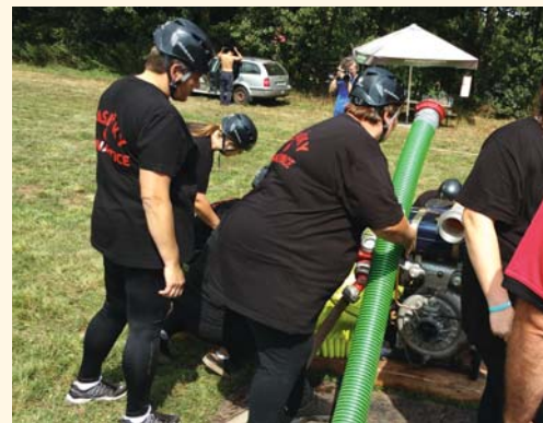
Příprava ženského družstva z Bernartic před soutěžním zásahem.

ranních hodinách došlo k požáru barokního zámku v obci Horní Maršov a byl na místě vyhlášen 3. stupeň požárního poplachu. Naše jednotka byla na místo povolána operačním střediskem hasičů kolem 11 h dopolední, abychom vystřídali v hasebních a likvidačních pracích již zasahující jednotky, které tam byly již od rána. Naším úkolem na místě zásahu bylo pomáhat s dohašením a rozebráním střechy zámku. Zásah byl velmi náročný z hlediska fyzické kondice i nebezpečím úrazu při hašení,