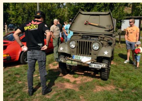
Ukázky historických vozidel

bing a také hasiči organizovali soutěž v přejezdu úzké lávky přes požární nádrž na jízdním kole, a kdo si netroufl přejet, mohl alespoň běžet. Také bylo možné se účastnit různých her organizovaných rybáři. A nezapomnělo se ani na nejmenší