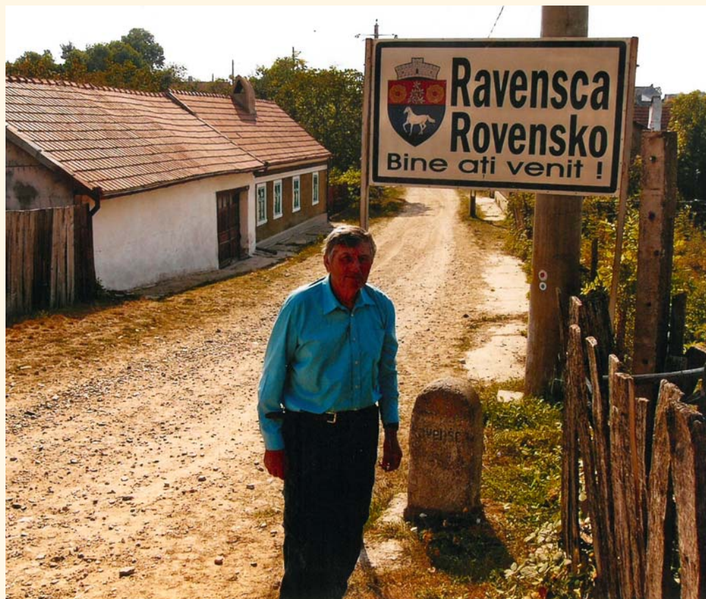
Vítejte v Rovensku