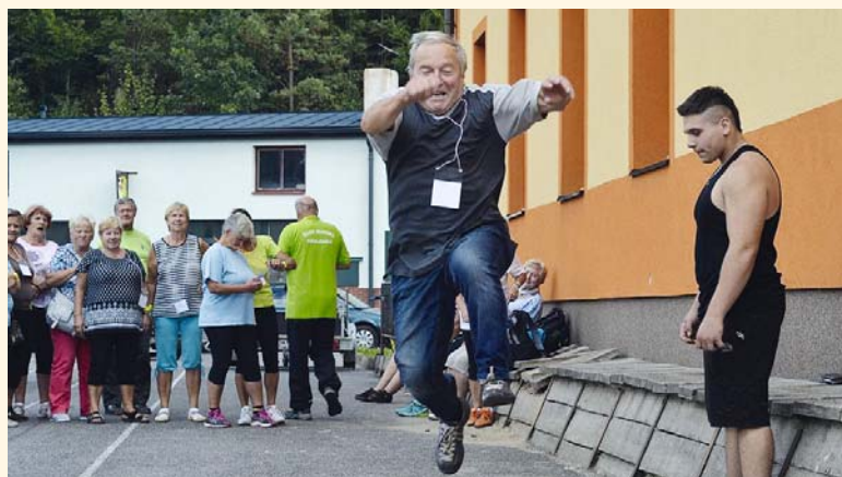
Skok do dálky