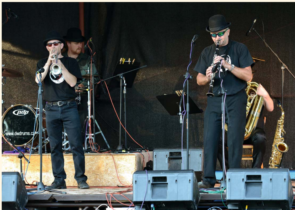
Koncert skupiny Koplahoband

■ Po vyhlášení ankety se návštěvníci rozprchlí mezi připravené atrakce. Tentokrát jich ale hodně zůstalo u hlavního pódia,