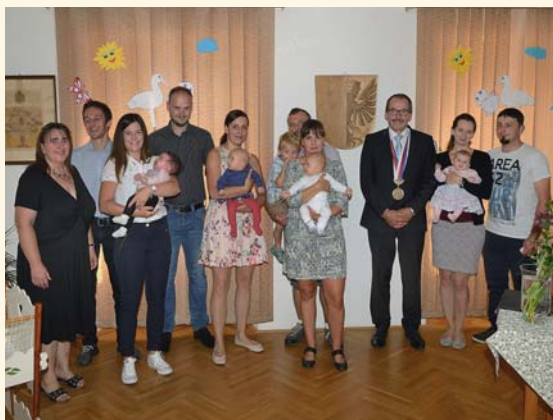
Vítání našich občánek