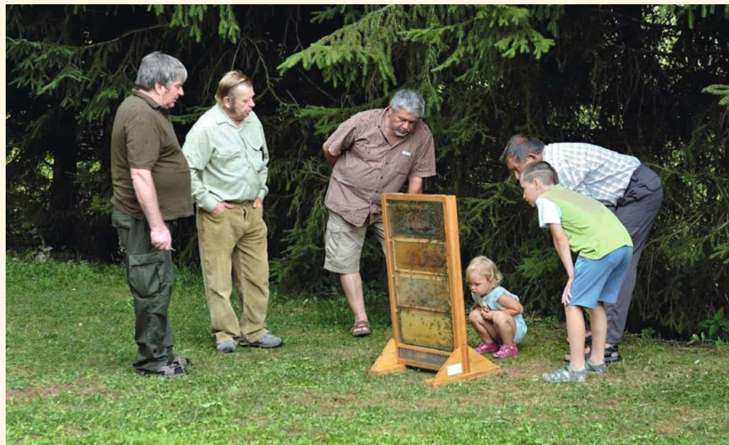
Kde je včelí královna?

Z celého roku vždy nejrychleji utíkají právě prázdniny hlavně dětem, a protože se již přiblížila jejich polovina, tak jako již předchozích deset let ani letos nemohlo chybět myslivecké půlení prázdnin.