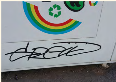
Výsledek sobotní noci III.

kulturní informace, informace z úřadu, chataře, pejskaře, seniory, sport a dobrovolníky. Skupina dobrovolníků bude informována o programech, při kterých bychom uvítali pomoc s organizací společenských sportovních a kulturních akcí. V současné době nejsou výjimečné stížnosti na fungování městského rozhlasu. Víím,