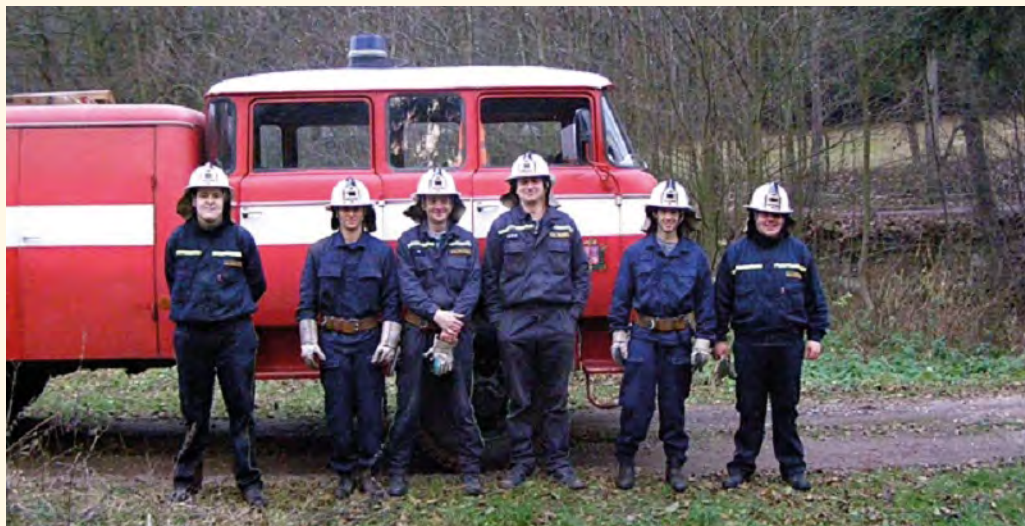
Vycvik 15. 11. 2008 – dřívější výstroj hasičů Pilníkov