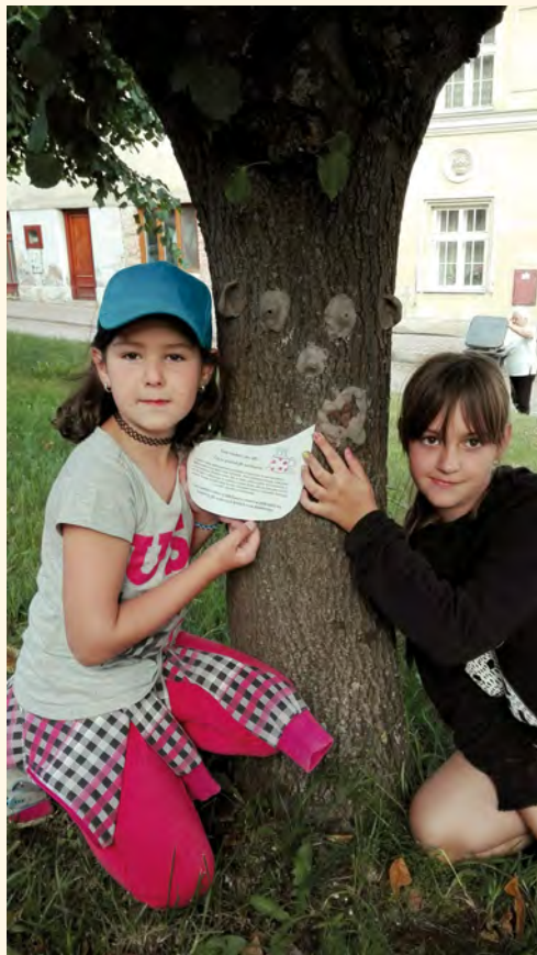
Dokud byla hlína vlhká, na kmenech byla vidět jen zblízka, když proschla, obličej se rozjasnil.