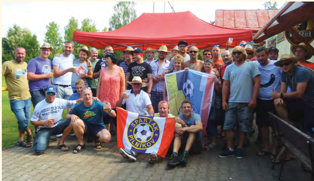
Mezinárodní turnaj dospělých