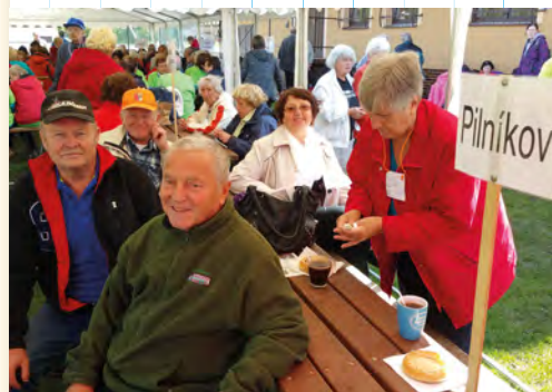
Tým pilníkovských seniorů