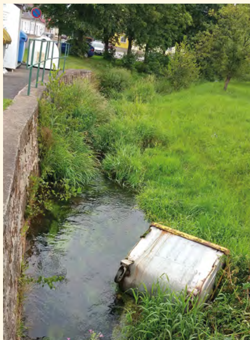
Kontejner vhozený do potoka v ulici Hradčín

plínu. Letos si mohly děti vyzkoušet práci s detektorem kovů, a pokud byly úspěšné, vyhrabaly ze země kapesní nožik. Cyklistický výlet do Marciszówa byl tentokrát zastoupen pouze účastníky z Pilníkova a o všech 13 cyklistů bylo opět díky pol-