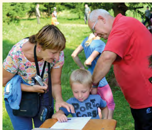
Malování mysliveckých motivů