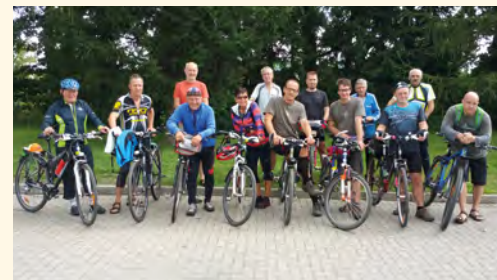
Zastávka v Kamienné Góre

chelberg jsme se někteří kochali výhledy z rozhledny Eliška. Je to dobře provedená dřevostavba, která byla pořízena z dotací poskytnutých Euroregionem Glacensis. Více na www.stachelberg.cz . Rozlouče-