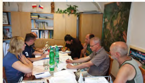
Společné jednání investora a projekčního týmu