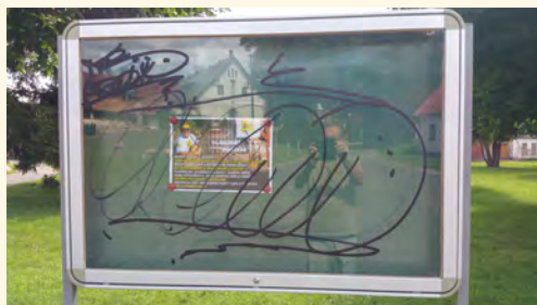
Výsledek sobotní noci II.

■ Asi vás nepotěším ani dalším sdělením. Bohužel jsme nebyli úspěšní v podání žádosti o dotační příspěvek na domácí kompostéry. Pro dosažení 43bodového ohodnocení žádosti jsme se spojili s obcí Vlčice.