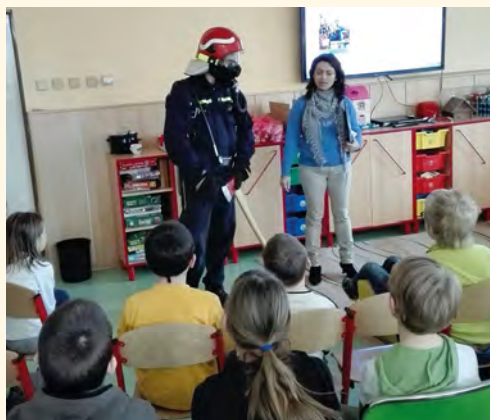
Hasiči z Pilníkovy provádějí i prevenci na školách

za tento finanční příspěvek. Přístroj bude použit ve spolupráci se Zdravotnickou záchrannou službou Královéhradeckého kraje do systému First Responder pro záchranu života člověka s náhlou zástavou srdečního oběhu.