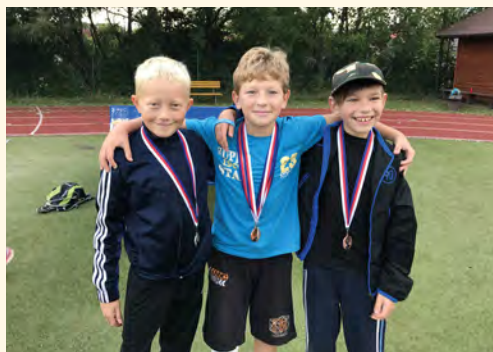
Máme medaile

bání, zapisování a předávání medailí a odměn. Na závěr jsme si společně zazpívali státní hymnu, aby dojem z olympiády byl kompletní.