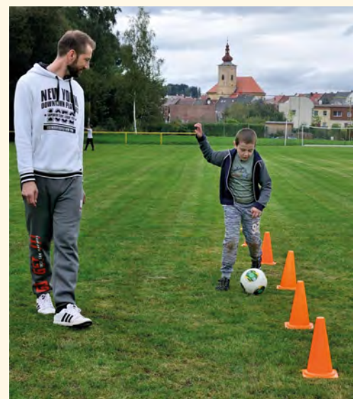
Slalom s míčem

■ Když děti absolvovaly všechny disciplí-