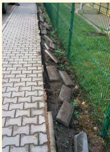
Vyvalené obrubníky u kryté haly

Hlavním parametrem bylo totiž vykázání předpokládaného množství vytríděného biologicky rozložitelného odpadu. Tato výše bodů bohatě stačila žadatelům v minulé dotační výzvě. Z důvodu velkého převisu žadatelů vyhlásil poskytovatel novou hranici bodového ohodnocení na 46, a tím byla naše žádost o dotaci vyřazena. Tento výsledek ovšem neznamená, že bychom se