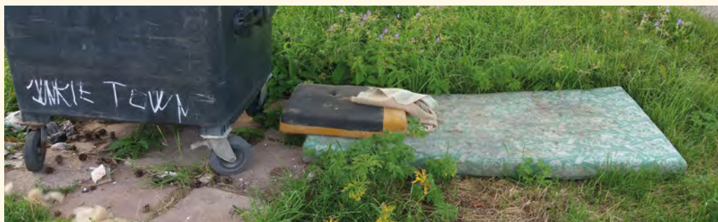
Tento odpad k popelnici rozhodně nepatří

■ Pro všechny máme jednu „novinku“. U vlakového nádraží je sběrný dvůr, který je otevřen každou sobotu dopoledne, a tam můžete tyto věci zdarma odložit! EF