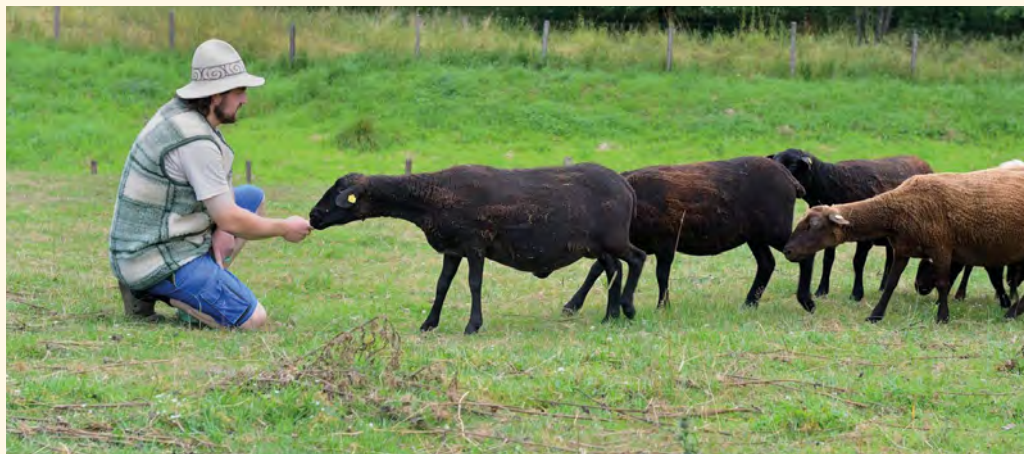
Pan Moravec u svého stáda

■ DK: Jiné plemeno jsem nezkoušel, ale na začátku jsem měl různé kříženko s jurskou ovcí, ale nyní se již postupně dostávám do plemenitby s rodokmenem, která je mým cílem.