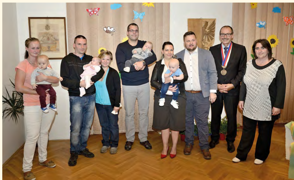
Tradiční vítání občánků na radnici za přítomnosti našeho starosty

■ Přejeme dětem šťastný a radostný život v našem městě. JB