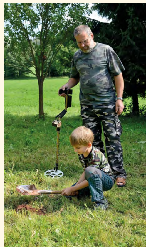
Hledání nožíku