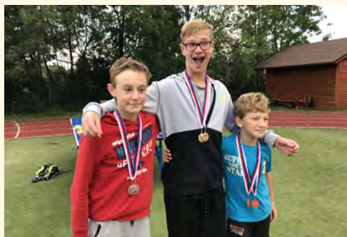
Blahopřejeme, chlapci