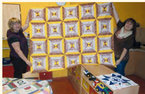
Patchwork je naše vášeň

Orlicko-krkonošský patchworkový klub vznikl v červenci roku 2007. Jak již název napovídá, v klubu pracují či pracovaly členky nejen z Trutnova a blízkého okolí (Pilníkov, Vlčice, Starý Rokytník, Svoboda