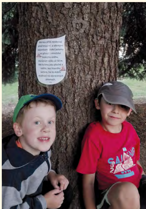
Po ukázce a praktických radách se pilníkováci pustili do díla