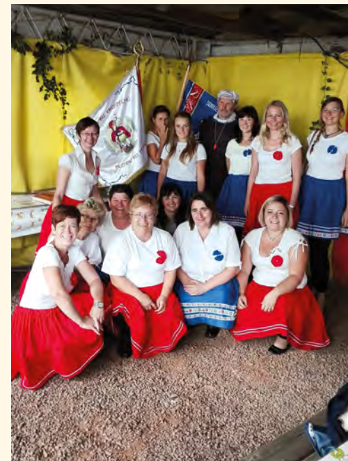
Farářovy schovanky se účastnily setkání rodáků ve Strážkovicích

Vystoupení místní amatérské taneční skupiny Farářovy schovanky, jehož premiéra se odehrála na pilníkovském reprezentačním plese 17. března 2017, kde sklidili účinkující zasloužený úspěch u všech přítomných diváků, jde dále do světa. Zatím tedy jen do toho okolního, ale kdo ví, jestli se nakonec nestane hitem silvestrovského pořadu.