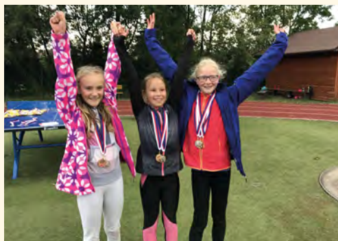
Radost z úspěchu