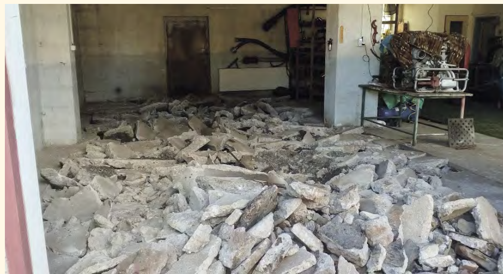
Bourání staré podlahy

a upravit vjezd před hasičárnou, což udělají odborné firmy. Po stavebních pracích jsme vymalovali garáže hasičárny a upravili šatnu pro jednotku. Odpracováno bylo mno-