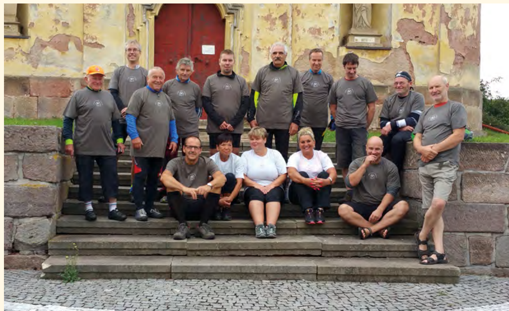
Letošní sestava cyklistického výletu

Letošní pravidelné, v pořadí již páté cyklistické putování do polské obce Marciszów ohrožovala nepříznivá předpověď počasí. Po krásném letním počasí měla přijít právě v den výletu deštivá změna. Možná právě proto vzdala svoji účast obec Vítězná, se kterou celou výpravu organizujeme.