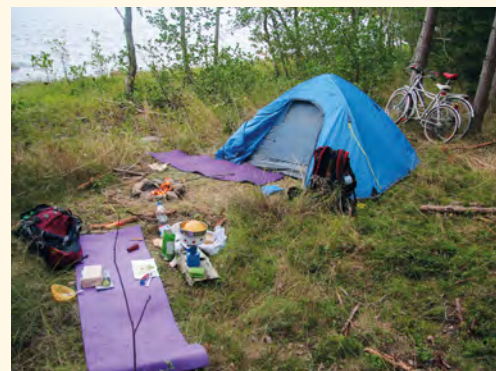
Bivakování na finském pobřeží

■ Stopování je forma cestování, která není jistě pro každého. Každý má o ideál-