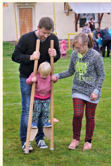
Chůze na chůdách

hování lanem, chůzi na chůdách, pouštění draka a další. Protože se však největší část sportovců Spartaku věnuje fotbale, bylo mnoho disciplín zaměřeno na fotbalový