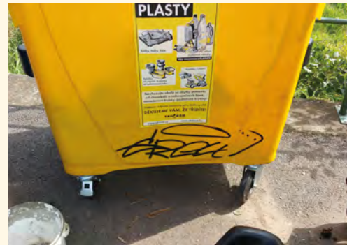
Výsledek sobotní noci I.

■ Využili jsme období, ve kterém není využíván kulturní sál, k jeho další modernizaci. Pro nadcházející plesovou sezónu jsme jej vybavili novými stoly, novou úpravou jeviště, renovací podlahy a veškeré prostory jsme nechali vymalovat. Věříme, že se tam budete cítit zase o něco pohodl-