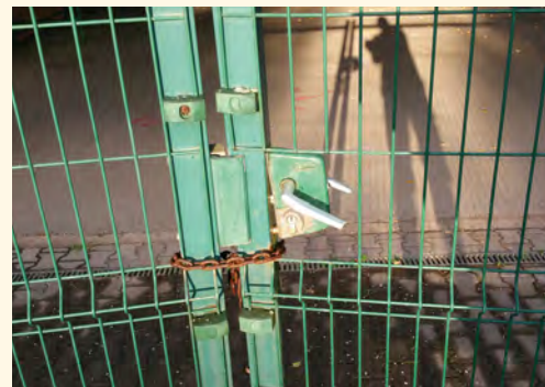
Vypáčená branka u oplocení sportoviště

olympiáda mládeže a Olympiáda seniorů se konala ve stejný den počátkem září. I o těchto akcích najdete podrobnější zprávy uvnitř Zpravodaje. Poslední akcí letního období bylo Setkání přátel tří obcí. I u tohoto setkání, jako i u několika dalších akcí, došlo ke změně termínu konání. V tomto případě o změnu požádaly dvě ze