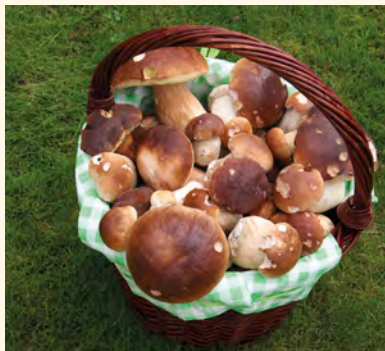
Pojď hříbečku do pytlíčku, pojď hříbečku do pytle.

■ Začátkem léta houbaři v trávě a jehličí nejčastěji najdou hřibovité houby, které jsou schopné brát vodu hlouběji pod zemí. Jedná se především o hřib dubový, kovář a koloděj. Také se objevují holubinky, rů-