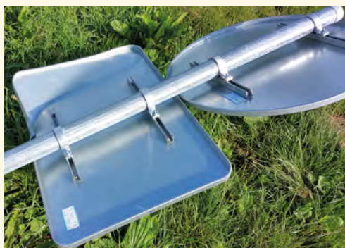
Vyvrácená značka na Letné

že je v některých lokalitách bez efektu. Důvody, proč odkládám finančně náročné opravy, jsou dva. Za prvé proto, že jsme podali žádost o dotaci na protipovodňová opatření, v níž se počítá se zcela novým městským rozhlasem, a za druhé proto, že v regionu není opravář tohoto zařízení a musí k nám přijíždět až od Nymburka. To je finančně náročné, a tak se snažíme využívat jejich pracovní cesty k nám do regionu v rámci oprav v okolních obcích. To