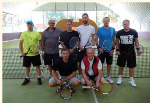
Vyznavači tenisu v Pilníkově