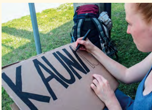
Psaní jmen cílových destinací na kusy kartonů

■ Nízkorozpočtové cestování po celém světě se stává stále oblíbenější formou trávení volného času. L: A není divu. Přednášky, fotografie a videa lidí na cestách,