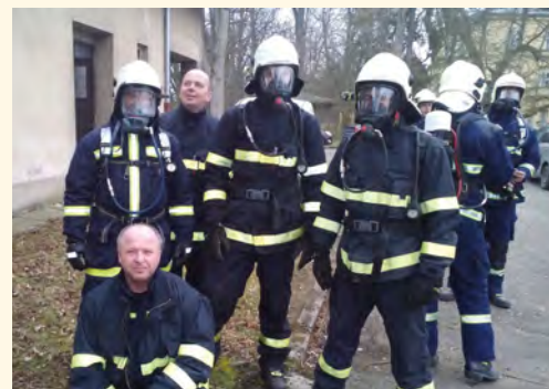
Školení nositelů dýchací techniky v roce 2016

oblast působnosti může krajské operační středisko hasičů vyslat i naši jednotku, což se čas od času stane. Během let se měnilo také vybavení hasičů, například byly pořízeny radiostanice a svolávací systém