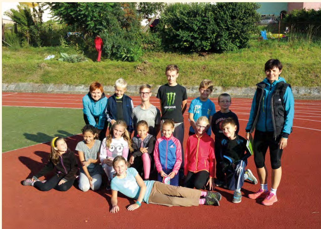
Náš tým je připraven na závod.

a i přes velké věkové rozdíly do závodění dávali vše. Musím všechny moc pochválit za velkou snahu a chuť, se kterou závodili. A samozřejmě velká gratulace vítězům. Moc děkuji všem, kteří přišli, a také děkuji rodičům za pomoc při měření, hra-