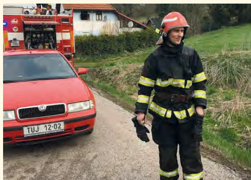
Současná výstroj hasiče Pilníkov

park, kde se odpracovalo mnoho hodin. V letošním roce se podařilo díky finančnímu příspěvku Nadace Agrofert pořídit automatizovaný externí defibrilátor Lifepak 1000. Chtěl bych touto cestou poděkovat