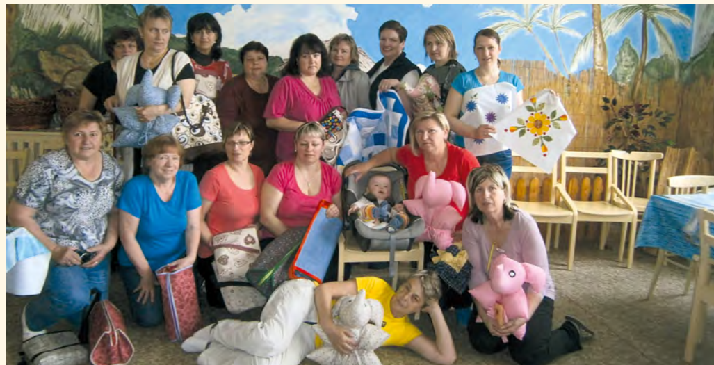
Švadlenky na víkend v Borovniče