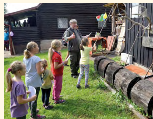
Kroužky na paroží

soutěže – poznávání stromů, zvířat i jejich stop. Pokud děti něco nevěděly, myslivci jim vše rádi vysvětlili. Samozřejmě ani letos nechybělo oblíbené „norování“, střelba ze vzduchovky, kreslení obrázků s libovolným mysliveckým motivem. Letošní novinkou bylo to, že si děti mohly odnést ještě jeden dárek. Byl jím klasický dětský