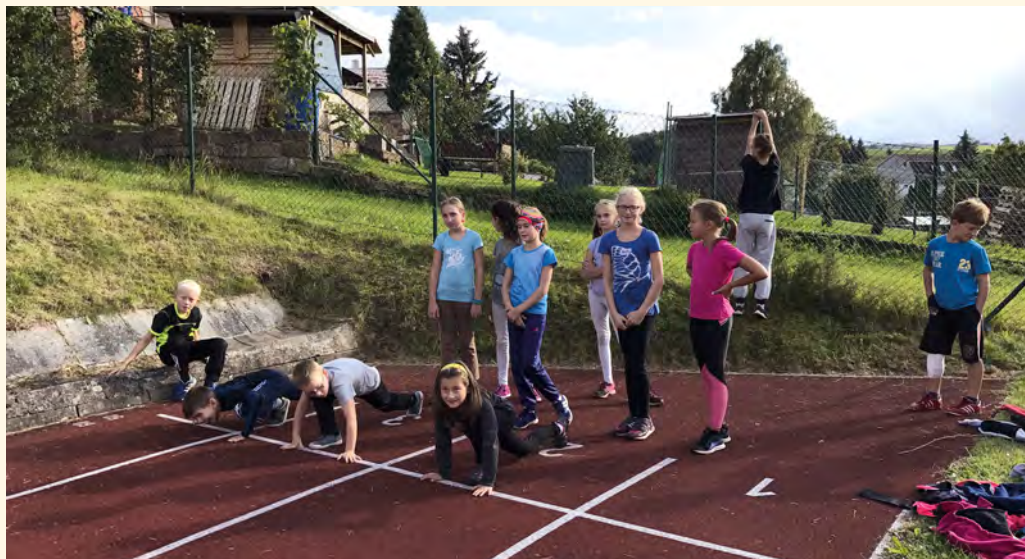
Připravit, pozor, start!

■ Celkem 13 závodníků si přišlo zasoutěžit a pokusit se vyhrát nějakou medaili. Snaha všech závodníků byla obrovská