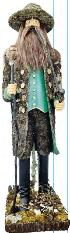
Socha pána hor v životní velikosti v Krkonošském muzeu v Jilemnicích

■ V tomto případě je vstup do noční knihovny pouze pro ty, co přinesou nějaký předmět, který se pojí ke Krakonošovi nebo k pohoří Krkonoše. Můžete vyrábět nebo hledat na půdě, důležité je, aby Krakonoš, který nás přijde navštívit, měl také svoje muzeum (předměty si budete moci druhý den zase odnést domů, pokud to třeba nebudou speciálně pro tuto akci vyrobené podobizny Krakonoše, které je možné nechat na výstavě v knihovně). Další informace naleznete na plakátech. Těšíme se na vás, malé i velké čtenáře knihovny Pilníkova. JP