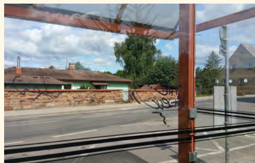
Již po několikáté pomalovaná autobusová zastávka

ně) Buštěhradský zpravodaj, Frýdlanstské noviny, Kolovratský zpravodaj, Magazin Zlín, Pilníkovský zpravodaj, Prio (Ostrava–Poruba) a Tišnovské noviny. Takže si