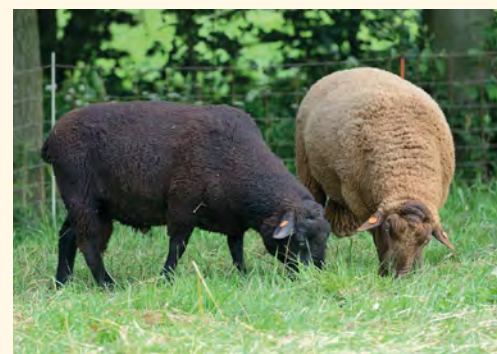
Berani jurské ovce

■ JM: Já mám v současnosti celkem 42 kusů ovcí, z čehož jsou dva plemenní berani, osm jehnic, 12 bahnic a 20 jehňat.