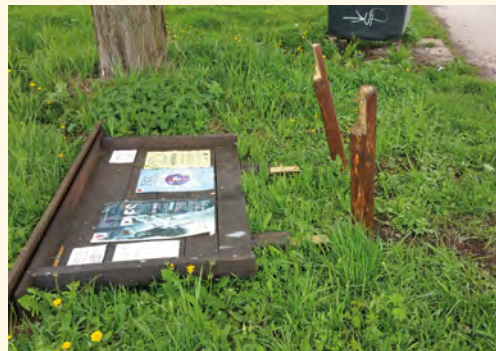
Již po několikráté zničená vývěsní cedule v ulici Mlýnská

■ Společenské a sportovní akce se uskutečnily se střídavou úspěšností. Hlavně co do počtu zájemců a návštěvníků. Pouze