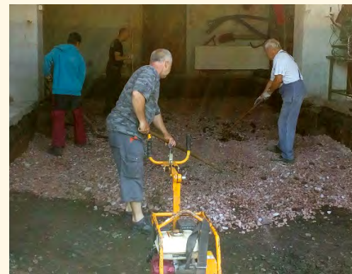
Pěchování podkladu pod betonovou desku

■ Dne 19. 8. 2017 od 10 h se konala na louce u požární nádrže soutěž v každoročním požárním útoku hasičských družstev. Soutěžila zde 3 družstva kategorie mužů z Třebihoště, Bernartic, Pilníkov a 2 druž-