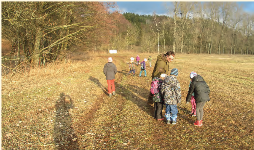
Procházka s poznáváním stop