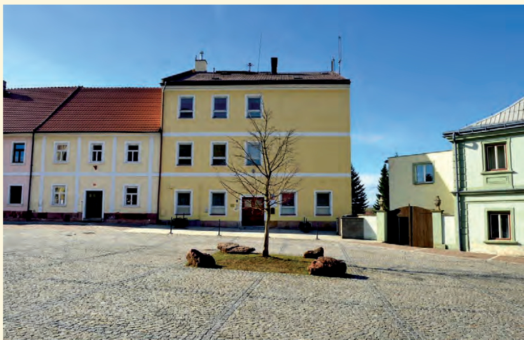
Školní budova na náměstí

Například ve školním roce 2015/2016 měla škola 161 žáků, z toho plných 43% bylo dojíždějících z okolních obcí. Škola je dnes moderně vybavena, například mají zcela nové šatny a na jejich původním místě, kde