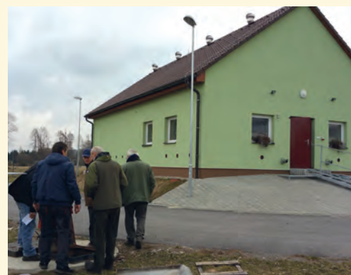
ČOV v Hajnici

■ Zástupci obcí a provozovatelů zařízení konstatovali, že kanalizace patří do základní infrastruktury města, která bude