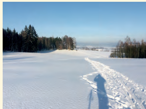
Bílé okolí Pilníkova

něženo, modré nebe, slunce svítilo, tak nebylo co řešit. Jela jsem cestou směrem na Chotěvice a Čermnou a postupně jsem se připojila na již projeté tratě. Měla jsem radost za každý kousek ujeté trasy. Druhý den jsem opět vyrazila na běžky a těšila se, jak si více vychutnám vyjetou trať a kousek se pořádně svezu. Naštěstí nejsem jediná, která tady u nás ráda jezdí na běžkách, takže běžeckou trať všichni běžci brzy krásně upravili. Následující víkend jsem vyrazila na delší běžeckou trať a od lípy nad Čermnou jsem se napojila na krásně upravenou běžeckou stopu, která vedla po loukách okolo Vlčic, Čermné, k Hostinnému a k Rudníku. Krásný výlet, upravené tratě,