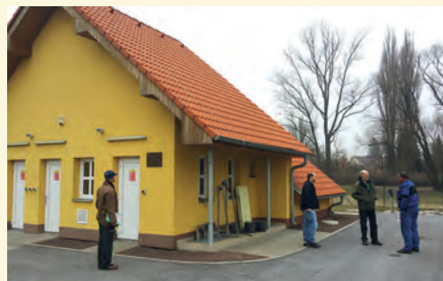
ČOV ve Vítězně

■ Jelikož od zpracování původní projektové dokumentace uplynuly již čtyři roky, projektant doporučil, aby zástupci města navštívili nově realizované čistírnny odpadních vod včetně čerpacích stanic a porovnali jejich technologie. Dne 7. 3. 2017 se zástupci města seznámili s provo-