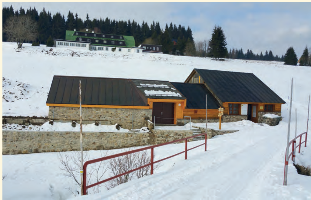
ČOV Horní Malá Úpa