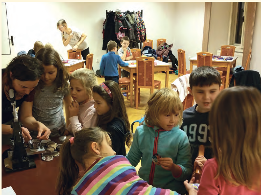
Pilníkováček se zatím musí scházet v zasedačce na úřadě

místě tohoto vydání Zpravodaje. Setkal jsem se tam se starostou městečka Stárkov, jenž použil citaci cyklistů, kteří navštívili jeho městečko a vyslechl jejich rozhovor. „To je nádherné náměstí, škoda že je tak hnusné.“ Tak to cítím i já v naší památkové zóně. Krásné domy, ale bohužel velmi zanedbané. Celkový průjezd Pilníkovem nemůže nikoho potěšit. Je zřejmé, že velký podíl