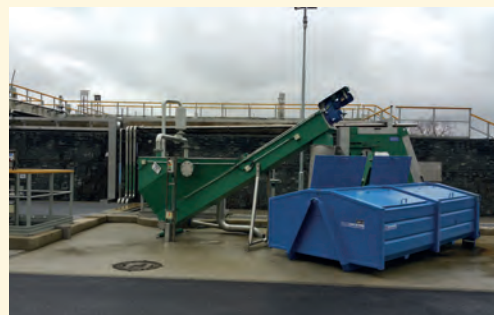
Technologie ČOV v Kněžmostě

■ Podle dnes známých informací bude na podzim 2017 vypsána poslední výzva