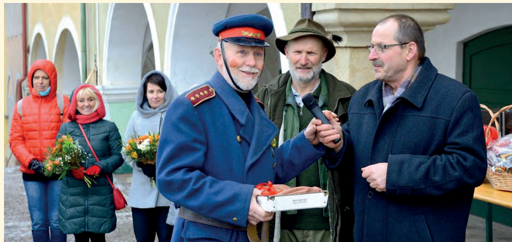
Předávání klíče od města

Oslava letošního masopustu připadla na sobotu 11. února 2017, a tak se v sobotním odpoledni pilníkovské náměstí postupně zaplnilo maskami a rej mohl začít.