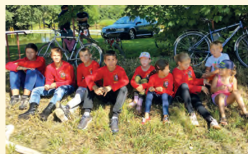
Oddíl mladých hasičů

Toho je velmi mnoho. Sám jsem přesvědčen, že máme krásné město, jenom je zanedbané v mnoha směrech. Začátkem března jsem byl na slavnostním křtu nové publikace, která se týká také našeho města. Jmenuje se Městečka na dlani a představuji ji na jiném