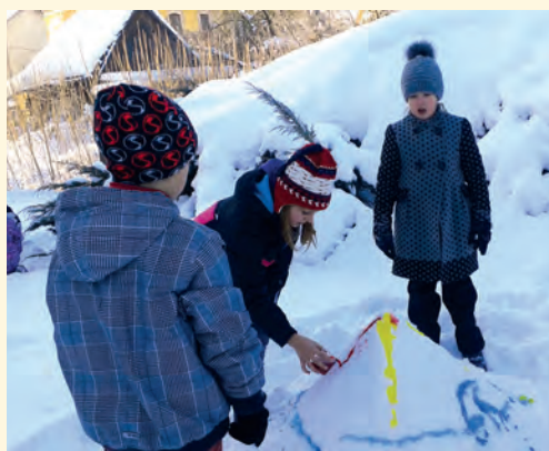
Barvami na bílou – land art, 4. třída