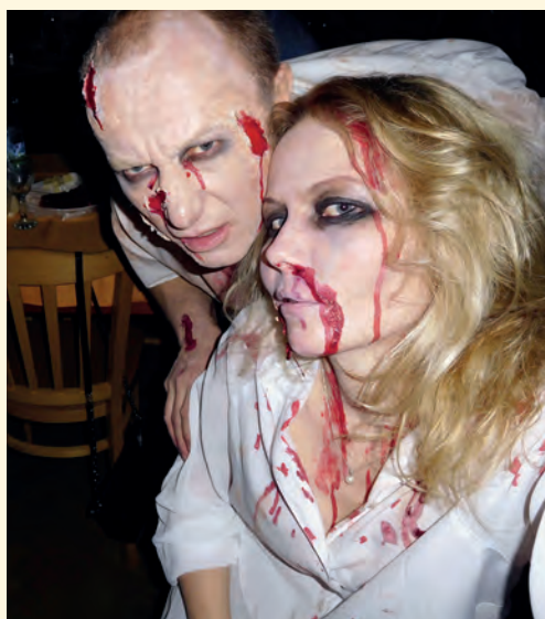
Láska až za hrob – Kolínovi

si strany, figury, kroky a o to víc, když se sejde skupina různého věku, s různými zaměstnáními a soukromými povinnost-