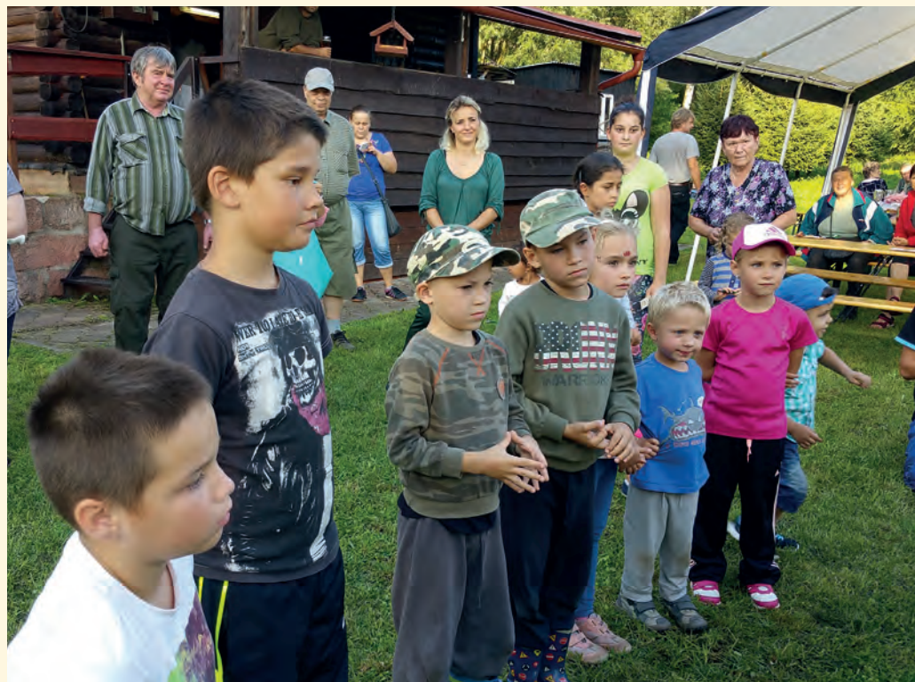
Půlení prázdnin na mysliveckém srubu