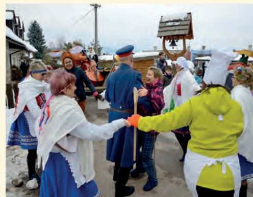
Policajt tancoval s každou hospodyňkou

■ Na závěr byla ještě dámská volenka. Bohužel kapela již uklidila nástroje, tak opět