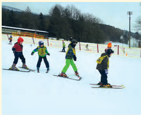
V plném nasazení