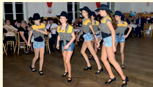
Star West z Trutnova

■ Tak zase jedna plesová sezona za námi. Poděkování směřuje těm, kdo si dali za úkol pobavit, připravit tu taneční podíva-