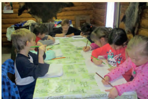
Ze srubu je to do lesa kousek