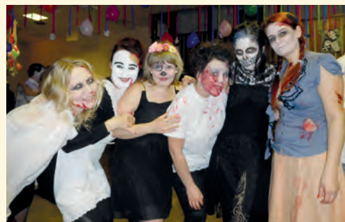
Zombie dívky na sportovním plesu

■ Poslední dobou se v Pilníkově vyskytuje několik tanečních formací více méně příležitostných a ty dělají předplesovou