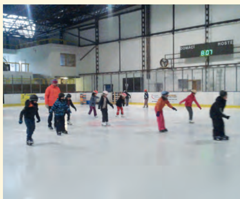
Pod vedením statného instruktora