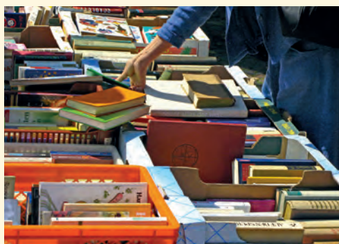
Za dobrou knihu půl království...