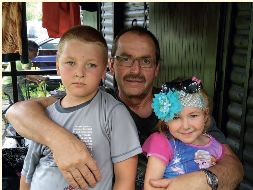
Času na vnučata mám jak šafránu...