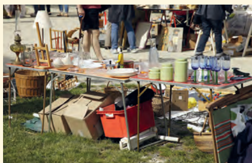
Na „blešáku“ vás campingové stolečky nepohorší

■ Na blešáku jsou nabízeny použité předměty, věci, oblečení, boty, starožitnosti. Bleší trh má rád komory, sklepy, dílny, dětské pokoje odrostlých dětí nebo úložné prostory pod postelí rodičů. Přijďte nabídnout svoje poklady k prodeji nebo nakoupit užitečné předměty, oblečení či kousky do sbírky.