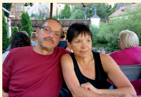
Děkuji Evě, své ženě, za její podporu

sněhové mantinely. Právě proto, že bylo všude spousta sněhu, tak se ta výzdoba dala ještě v únoru skousnout.