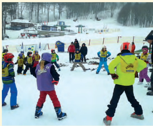
Zahajovací rozcvička