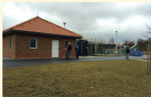
ČOV v Kněžmostě

vedené změny nebudou představovat navýšení rozpočtových nákladů, naopak přispějí ke snížení nákladů provozních. Projektant následně geodeticky doměří lokality, kde dochází ke změnám a provede sondy pro ověření inženýrsko-geologických poměrů v místech prohloubení kanalizačních stok.