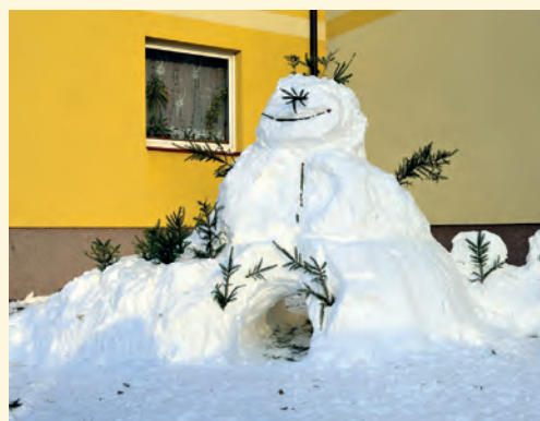
Netradiční sněhulák na Hradčíně

ho domu nazout běžky a hurá, už jsem jela. Vyrazila jsem směrem k vlakovému nádraží a kolem domu pana Hakena jsem vyběh-