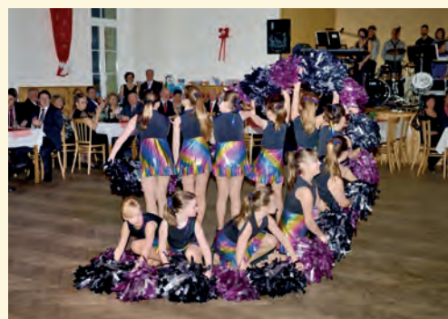
Mažoretky z Chotěvic

nou pro ostatní a trochu uvolnit náladu, aby se plesoví hosté přestali zdráhat a vrhli se na parket.