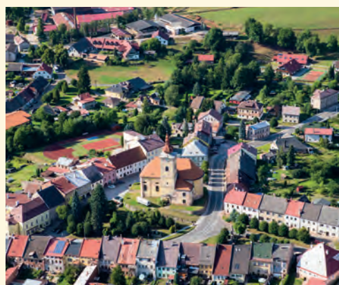
Pilníkovské náměstí si zaslouží změnu

studii území pro výstavbu deseti rodinných domů a zadáváme projekt pro zasilování a výstavbu komunikací v této lokalitě a v tomto roce se chceme věnovat podstatně více opravám městského majetku. Časově náročná je i úprava katastrálního operátu, která by měla být dokončena v říjnu. To je digitalizace intravilánu (vnitřního města) a týká se to mnohých z vás. Prioritně však pracujeme na přípravě opětovného spuštění realizace kanalizace a ČOV.