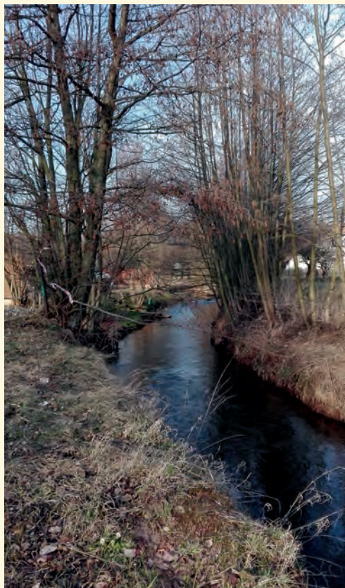
Pilníkovský potok, jaro 2017

...Bude-li sucho pokračovat, bude nám scházet hloupě zastavěná půda říčních niv, kam vždy směřovaly pravěké civilizace právě proto, aby se vyhnuly suchu. Údržba vodních nádrží musí být doprovázena péčí o celou krajinu. Nové, zejména městské domy by měly mít systémy na sběr vody ze střech a její