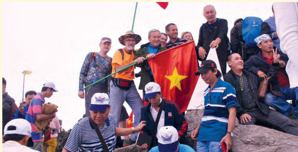
Na vrcholu nejvyšší hory Vietnamu Fansipan 3142 m n.m.