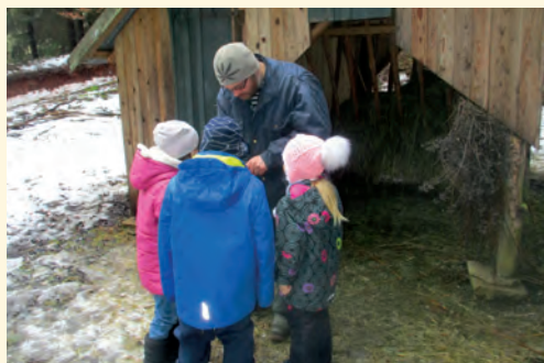
Procházka ke krmelci