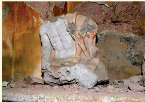
Zmizelé torzo Ježíše

chu, a mohla tak trochu prosychat. O rok později byla střecha provizorně zakryta plachtou, aby se alespoň klenba nezřítla. ■ K větší opravě kapličky došlo až na podzim roku 2016 na náklady majitele