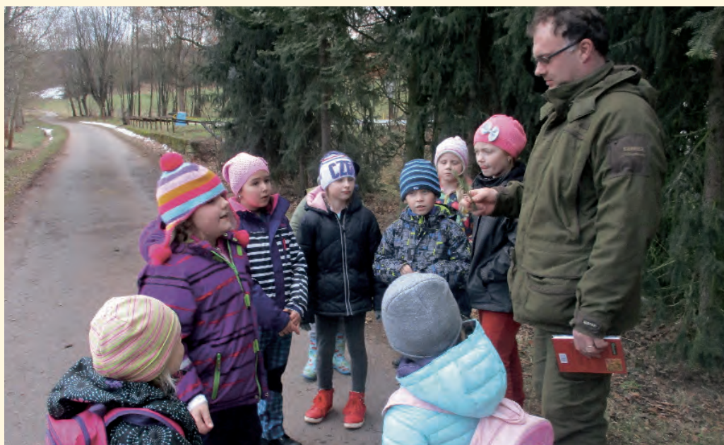
Poznáváli jsme stopy