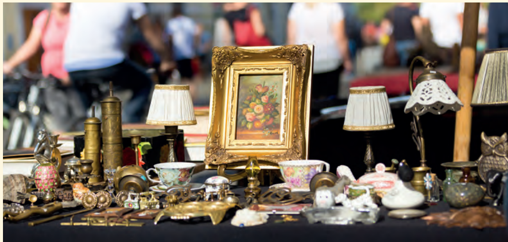
Staré věci mají svou duši či příběh a nemusejí vždy skončit na smetišti