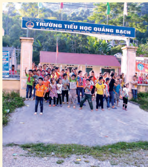
Ovace při průjezdu vesnicemi

■ Asi uprostřed našeho pobytu jsme navštívili horské středisko Sapa, kde jsme strávili dva dny, které jsme věnovali jednak návštěvě vesnice etnické skupiny Hmongů, jedné z 54 horských kmenů severního Vietnamu, jednak výletu na nejvyšší horu Vietnamu, 3143 m vysoký Fansipan. Nová lanovka, která byla zprovozněna na jaře