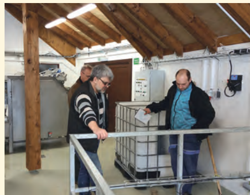
Technologie ČOV v Horní Malé Úpě

■ Bez veřejné kanalizace se nemůže rozvíjet investiční příprava staveb na území obce (například v Pilníkově výstavba nového mostu na ulici Kocléřovská, kde investorem je Královéhradecký kraj, je