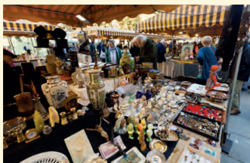
Každé místečko nad zlato!