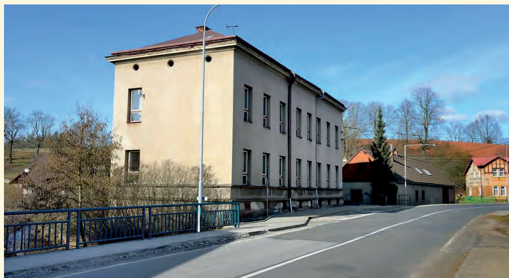
Budova nižšího stupně je přímo u hlavní silnice