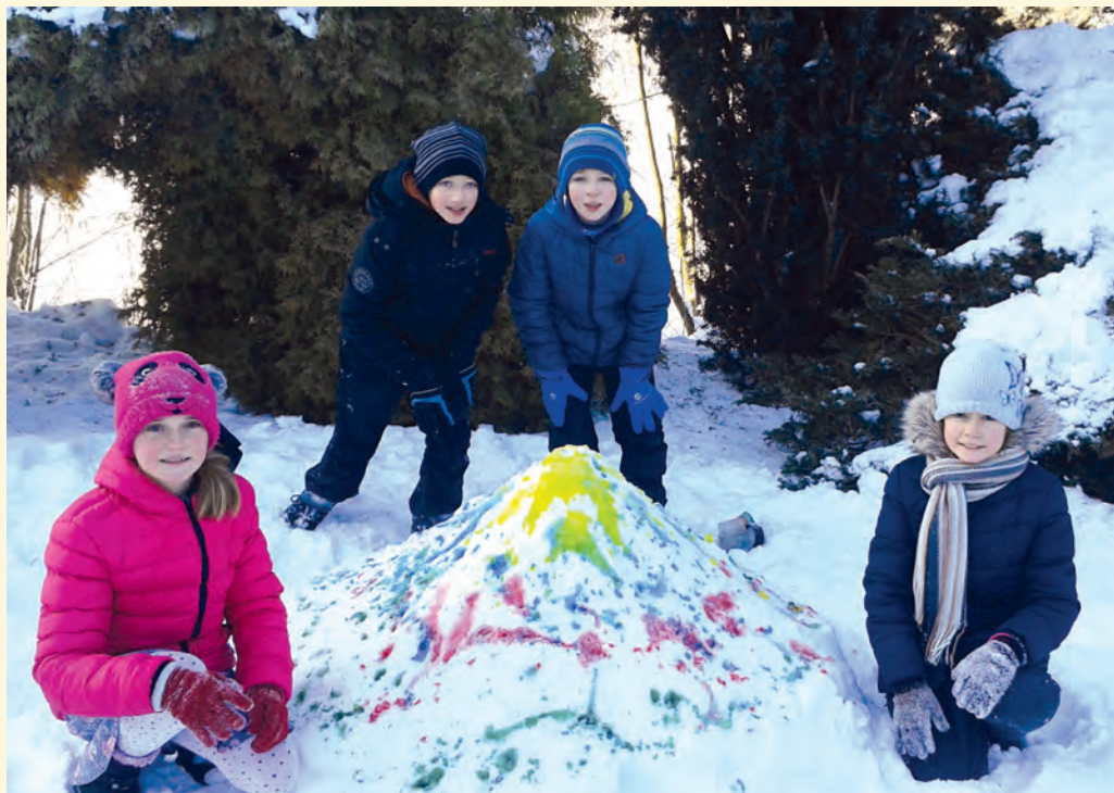
Barevná zima – land art, 4. třída

kroky v bruslení se snažily dělat děti ze 4. ročníku. Další kurz, který děti během zimních měsíců tradičně navštěvují, je plavecký a podnikli ho žáci 1. a 2. ročníku. ■ Nejen sportem žily děti. Bílá plocha, kterou připravil leden, byla jako stvořená pro barvy. JP