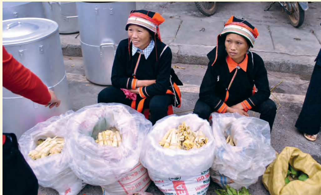
Prodavačky na velkém nedělním trhu jsou příslušnice jednoho z padesáti horských národů severního Vietnamu

doucí - průvodce, bývalý ultramaratonec, tzn. člověk pro nás z jiné planety, další člen – aktivní horolezec se šesti sedmitisícovkami na kontě. A zbytek výpravy – bytosti o deset až dvacet pět let mladší než my.