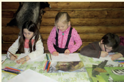
Kroužek ve srubu