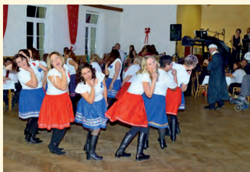
Včera večer u síla...

si strany, figury, kroky a o to víc, když se sejde skupina různého věku, s různými zaměstnáními a soukromými povinnost-