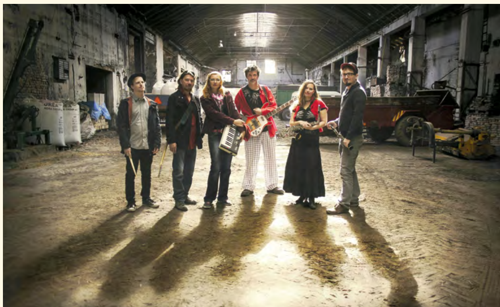
Tlupa Tlap 2015

■ „Matěj a Honza zatím nepíší asi proto,