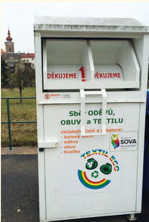
Kontejner na šatstvo

■ Přirozenou součástí práce s oděvy je i využívání takto sesbíraného oblečení v neziskových projektech se společnostmi, jako jsou Nadace SOVA, ADRA, ČČK, Armáda spásy a další.