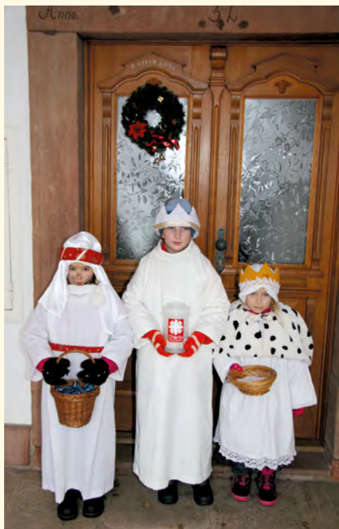
Sbírka tříkrálová 2016

■ Vstupujeme, alespoň podle mého vnímání ročních období, do nejkrásnější fáze roku, která bývá obdobím příprav a úklidu. Na veřejně prospěšné práce získáme v tomto roce rekordně nízký finanční příspěvek a pravděpodobně nebudeme moci zaměstnat nikoho, kdo již pro město Pilníkova tuto práci vykonával. Se ZŠ plánujeme opět úklid v rámci akce „Uklidme Česko a přitom Pilníkova“ a ostatní úklid budeme řešit v rámci služeb sjednaných se společností Lesy – voda, s.r.o. S odpadovým hospodářstvím vás seznámím v jiném článku tohoto Zpravodaje. Přeji vám krásné jaro a těším se na setkání s vámi při kulturních a sportovních akcích, projednávání investic, veřejných zasedáních zastupitelstva nebo nejpozději nad stránkami letního čísla Zpravodaje.