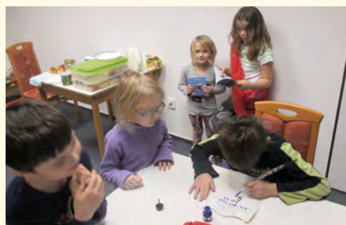
Podpis na listinu krále Knihoslava I. a dárečky za noc v knihovně

■ Vůně buchet a závinu ke snídani odlákala ranní štěbetání těch, kdo se vzbudili kolem 7. hodiny, a dala ještě chvíli spán-