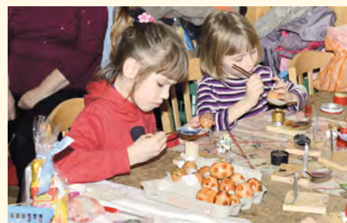
Malování vajíček

vajíčka, pomlázky nebo i rozmanité šperky, ručně vyřezávané vařečky, lodičky či jiné hračky. Také bylo možné ochutnat syrové poháry, medovinu a další zdravé výrobky z pilníkovského Medového dvora.