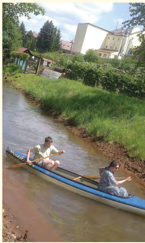
Pilníkovský potok 2013

Už od dětství mě lákaly nápady jako např. vzít si nafukovací lehátko, necky nebo duši od traktoru a plout na nich po Pilníkovském potoce. Trvalo jen 30 let a onen nápad jsem se svým kamarádem Jardou Andrlem v létě roku 2013 uskutečnil.