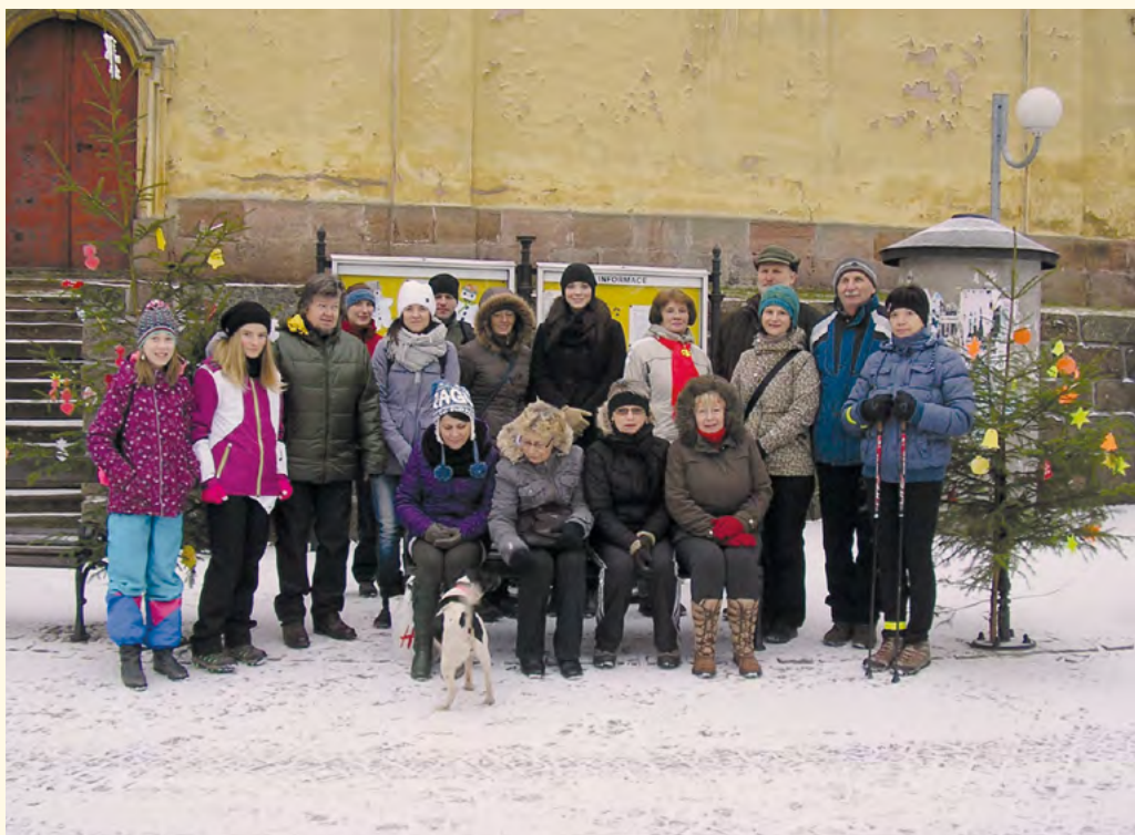
Účastníci novoroční vycházky

■ Dvacátého druhého ledna byla zahájena plesová sezóna mysliveckým plesem a byla ukončena dvacátého šestého února