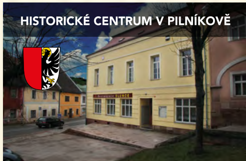
HISTORICKÉ CENTRUM V PILNÍKOVĚ