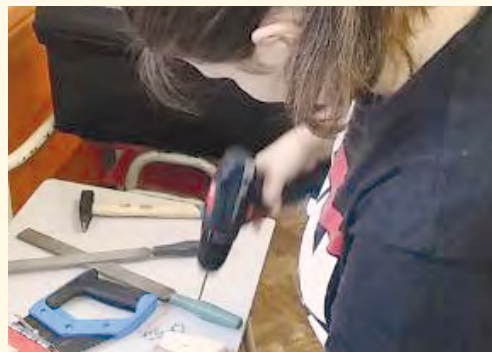
Práce s novými nářadím

■ Dívky z tanečního kroužku pod vedením paní R. Hurdákové předvedly svá vystoupení na obecním plese.