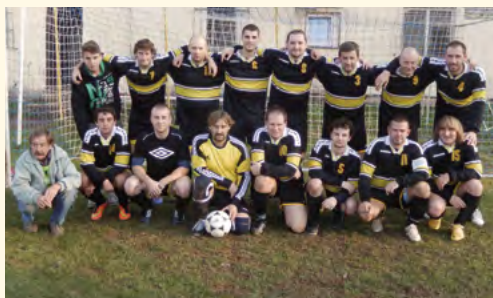
Spartak muži

Určitě každý u nás ve městě o Spartaku už někdy slyšel. Buď o některé ze sportovních událostí, nebo se třeba zúčastnil sportovně-maškarního plesu, který Spartak pořádá a těší se již řadu let velké oblibě. Málokdo už ale ví, že je to se svou 106člennou základnou největší sdružení v Pilníkově.