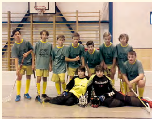
Hráči florbalu

■ Žáci deváté třídy stáli před nejtěžším rozhodnutím, kterým bylo zvolení budoucí střední školy, učebního oboru. Přihlášky jsou vyplněny a odeslány na střední školy a učiliště.