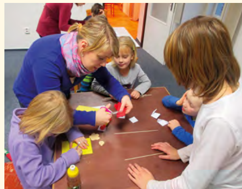
Výroba dárečků k MDŽ