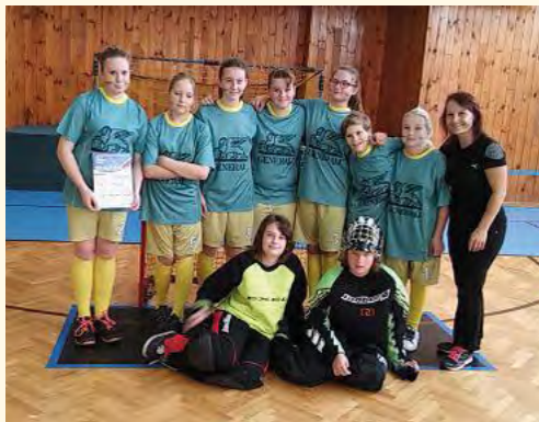
Na florbale

■ Na pilníkovské základní škole pracuje sedm kroužků s cílem aktivně a smysluplně trávit volný čas dětí. Na prvním stupni mohou žáci navštěvovat dva kroužky ke-