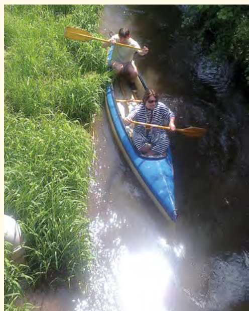
Šťěstí v očích

■ Světla ubývalo a na řadu přišly vyvrácené stromy. Šup ven s lodí na břeh, pár kroků a šup s ní zpátky do vody. Tento manévr jsme provedli asi čtyřikrát a pravdou je, že to pokaždé bylo jinak namáhavé a jinak zábavné. Na všudypřítomné větve vrby a olšy jsme už byli od počátku plavby zvyklí, ovšem jedna vrba tak mocně zatoužila po mých slunečních brýlích, že si je (velezkušeným rychlým hmatem) z mých očí vzala a pro jistotu si je schovala pod hladinu. „Škoda jich,“ říkám si, „ale asi je to mýtné za vplutí do zelených temnot místního lesa.“ Párkrát jsme museli loď vést ze břehu pomocí dlouhých provázků (tzv. koníkování) a po cca pětisetmetrovém náročnějším úseku vidíme na konci chotěvické džungle Labe. Mírně zabláceni ve tvářích a na těle vrháme se vstříc hlubším vodám řeky. Nutno dodat, že jsme se za celou dobu plavby ani jednou „necvakli“, ale měli jsme párkrát namále! Dáváme si ještě nějakých 300 metrů proti proudu, abychom si taky trochu zapádrovali, a při-