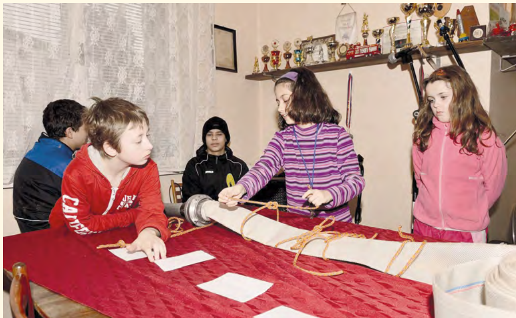
Mladí hasiči při tréninku uzlování

Málokdo asi ví, že se při SDH Pilníkov připravují také mladí hasiči. Jejich oddíl byl založen již v květnu 2014, ale na webových stránkách SDH Pilníkov ( http://sdh.pilnikov.cz ) se toho o nich moc nedozvíte, pouze v části „Soutěže mladých hasičů“ je zmínka o jejich účasti na soutěži Uzlovka v Radvanicích, které se naši mladí hasiči zúčastnili 4. dubna 2015 jako své první soutěže. A letos prý bude následovat účast v dalších!