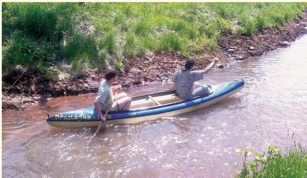
Klidnější úsek naší plavby v roce 2013