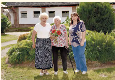
Zástupkyně soc. výboru u paní Skutilové

Představujeme další výbor, který pracuje na naší radnici.