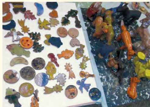
Děti tvořily z keramické hlíny

■ O keramický kroužek je v letošním školním roce na prvním stupni velký zájem. Svými výrobky žáci potěšili rodiče i účastníky vánočních trhů. Škola má vlastní keramickou pec a malou dílnu.