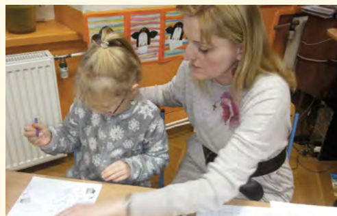
Zápis do první třídy 2016

■ Žáci od páté do osmé třídy žijí florballem. Odpolední čas na kroužcích florbalu aktivně tráví 40 dětí. Navštívili jsme dva turnaje. Soutěžily dívky i chlapci. Chlapci