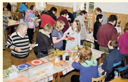
Návštěvníci předvelikonočního jarmarku

■ Jarmarku se zúčastnilo celkem sedmáct prodejců různých, nejen typicky velikonočních výrobků, a také osm dětí z nového místního kroužku pro děti Pilníkováček se svými vedoucími. Koupit jste si mohli různé perníčky a chaloupky, malovaná