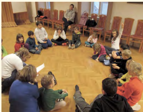
Děti z Pilníkováčky