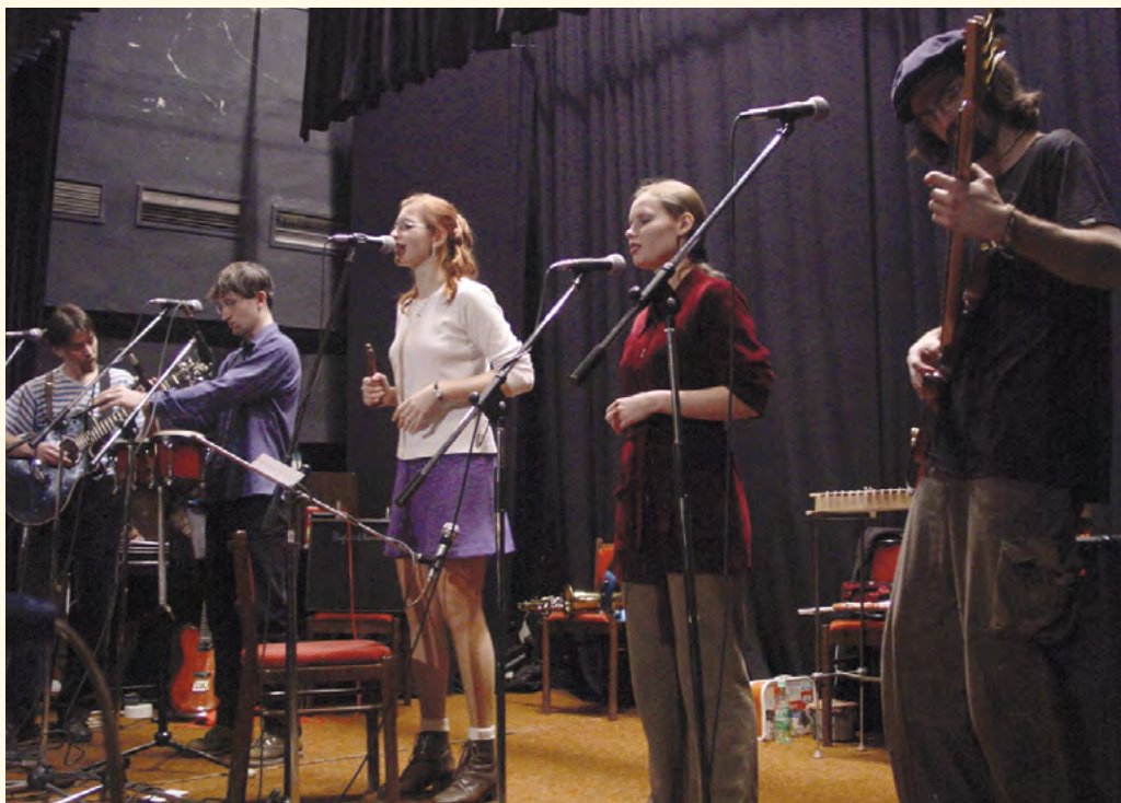
Kaluže, Havlíčkov Brod 2002

Rumplování v kumbále a ještě nějaké další. No a mezi nimi samozřejmě Tlupa Tlap. A tu jsme vylosovali.“ A potom mi ještě prozradili, že: „Změny názvu nás baví, tak do budoucna nevyklučujeme ještě další.“