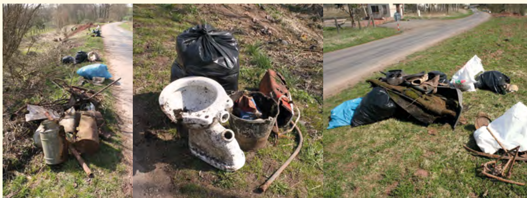
I tento odpad, který děti uklidily podél cest, patří do sběrného dvora

ze které plánujeme nákup kontejnerů a nakladače, posílíme sběr odpadů ještě o jedno místo BRKO v oblasti nového města. Ve Zpravodaji je vložen anketní lístek, který po vyplnění a navrácení na MěÚ prokáže, jaký by byl zájem mezi občany o kompostéry. Formu přidělování, zda bezplatnou, pouze s vratnou kaucí, či s případnou finanční spoluúčastí občanů, navrhneme až na základě výsledku