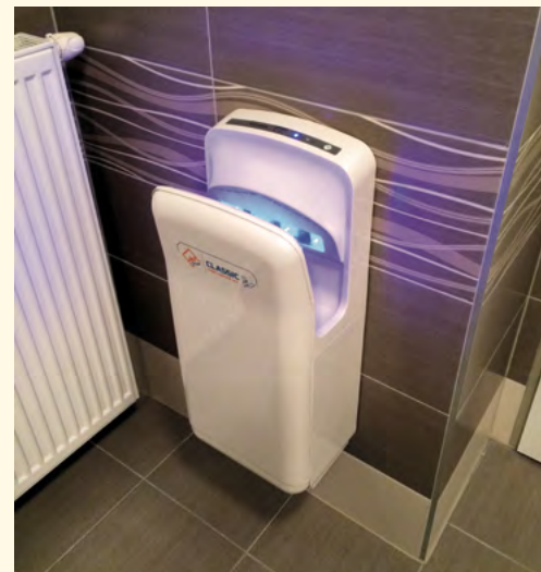
Moderní vysoušeč rukou