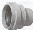
přechod kamenina/PVC 160 (včetně těsnění)