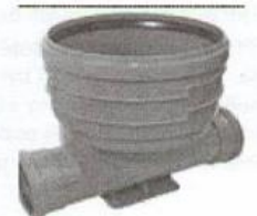
šachtové dno 400/160