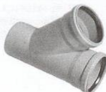
kanalizační odbočka 160/160 45°