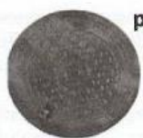
poklop 1,5t DN 400 lehký pochůzný