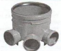
šachtové dno rozvětvené 400/160