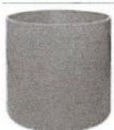
šachtová trouba 400/1000