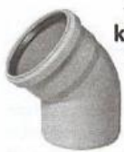
kanalizační koleno 160, 15°, 30°, 45°